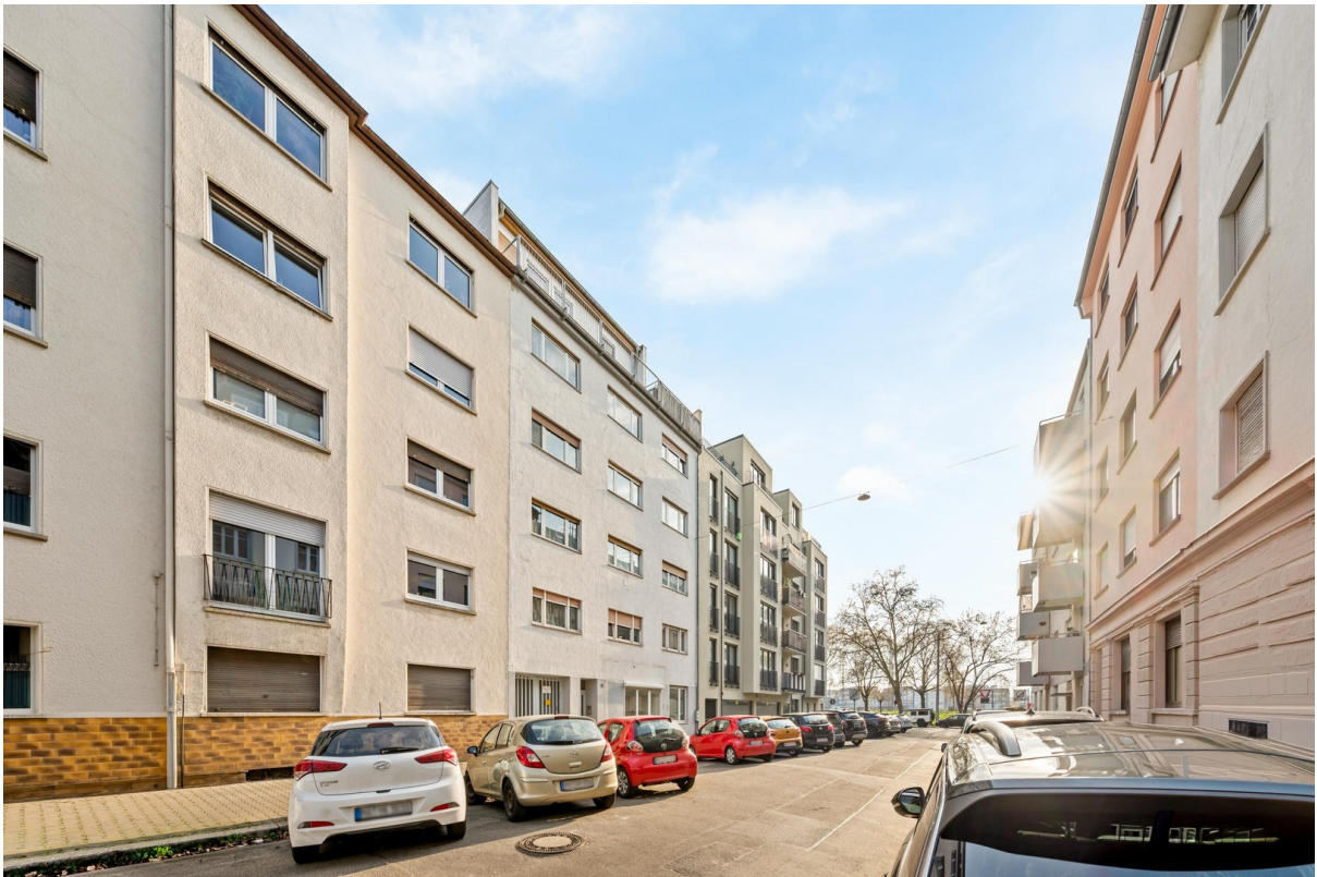
Gebäude vom außen