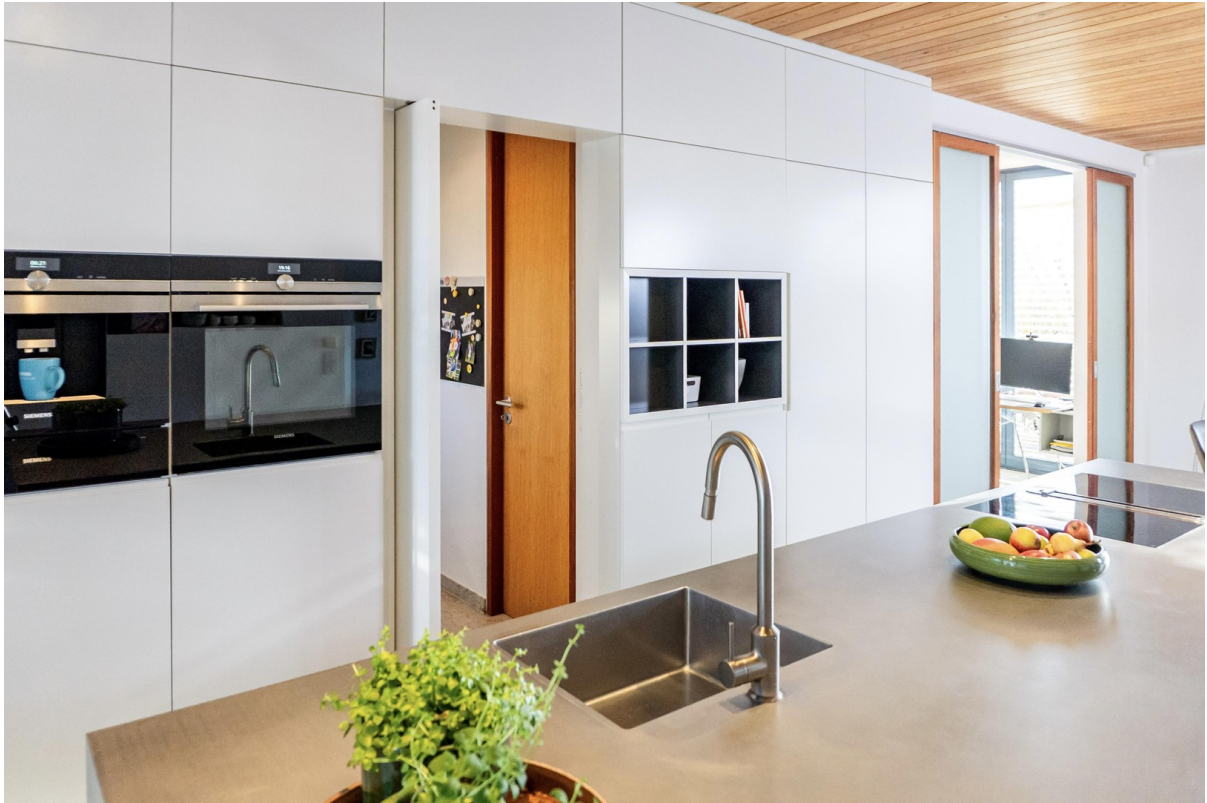
Küche mit Schwenktür - offen -