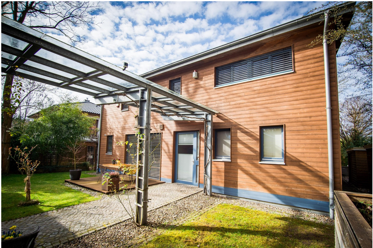
Innenhof - Frühstücksterrasse