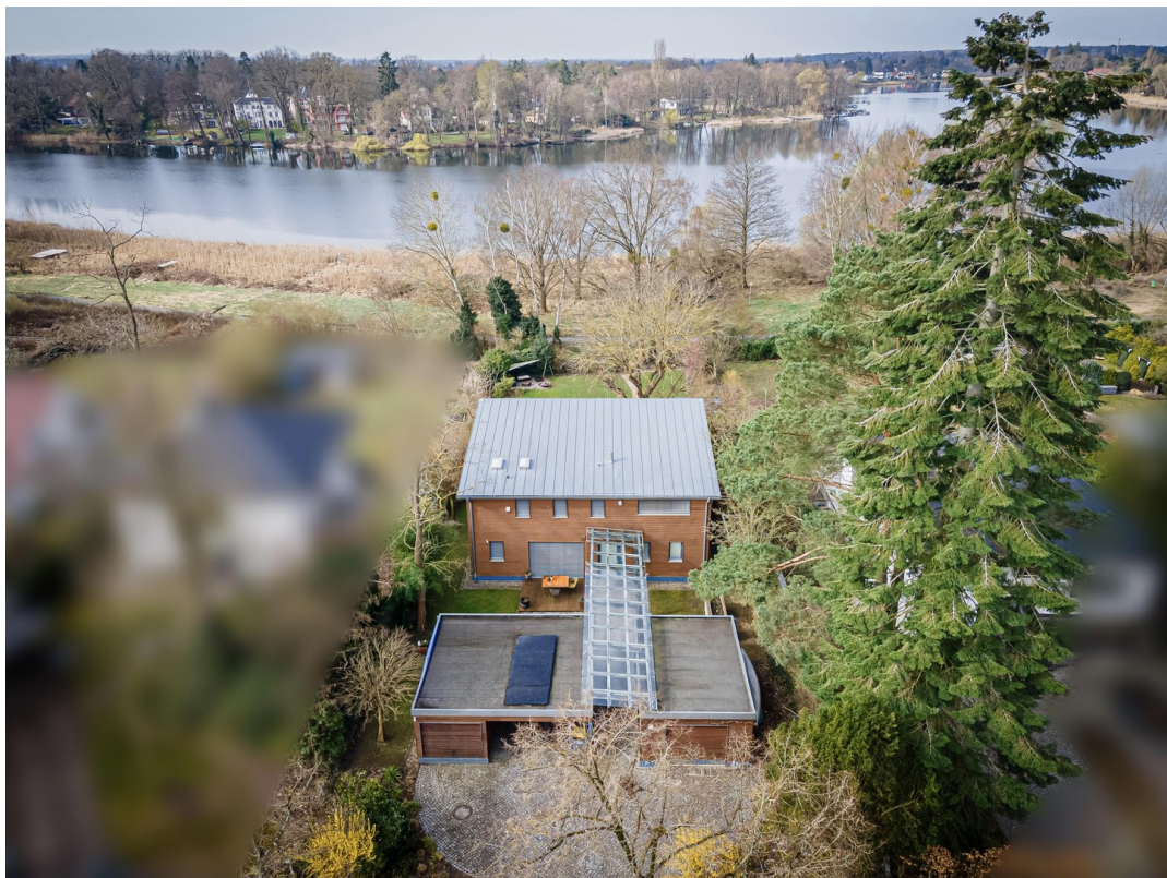
Luftaufnahme in Seelage