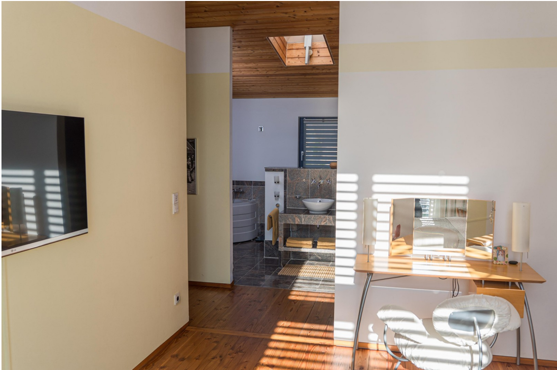
Schlafbereich mit Bad en suite