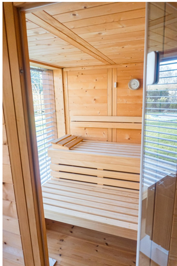
Sauna mit bodentiefem Fenster