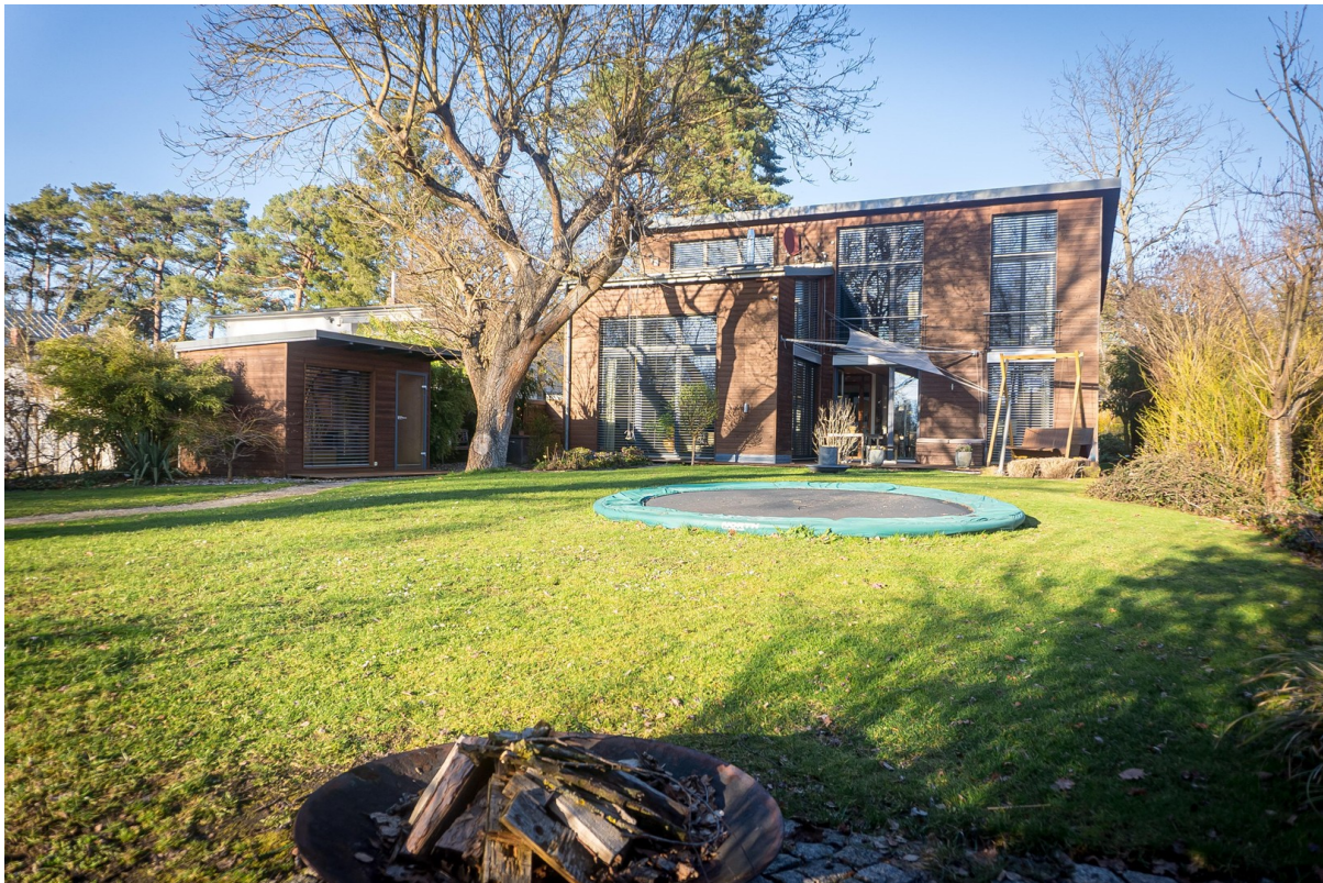
Außenansicht mit Garten