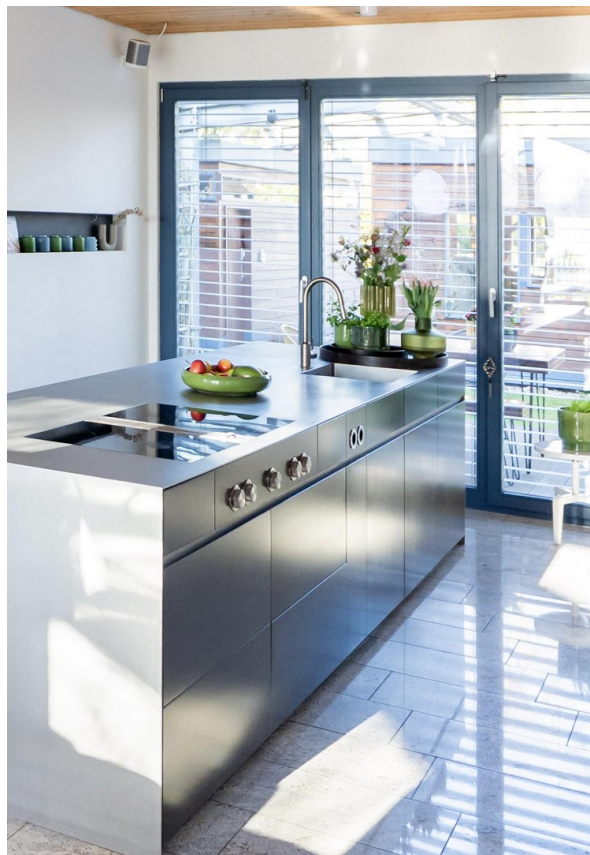
Kücheninsel mit BORA System