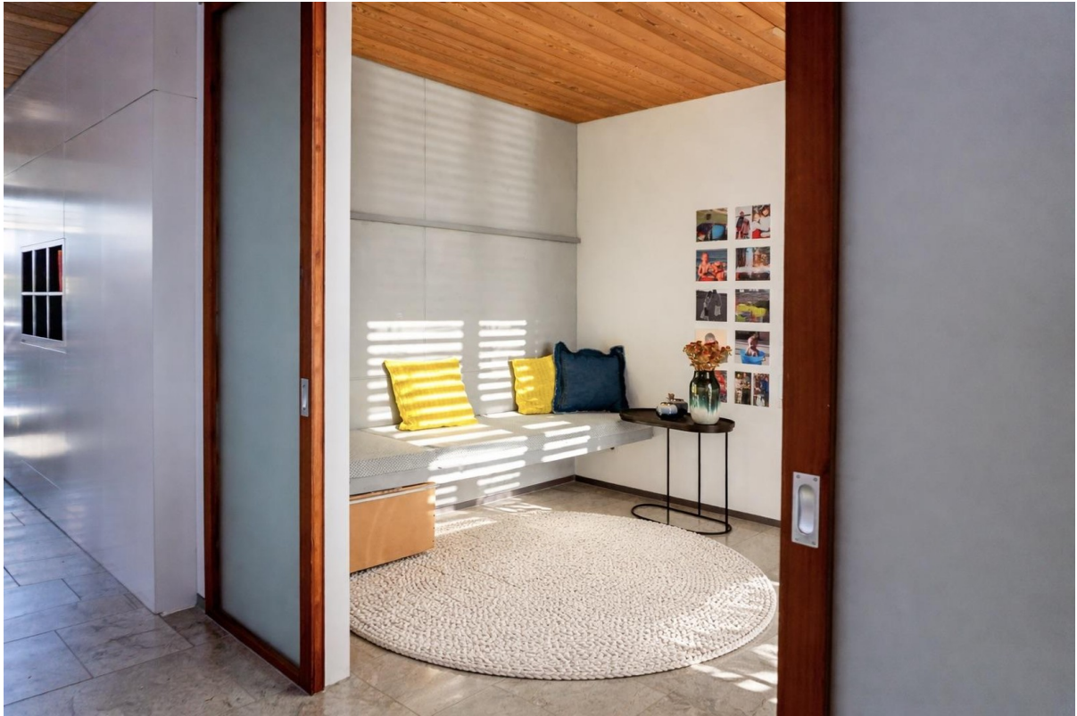
Büro mit Sitznische