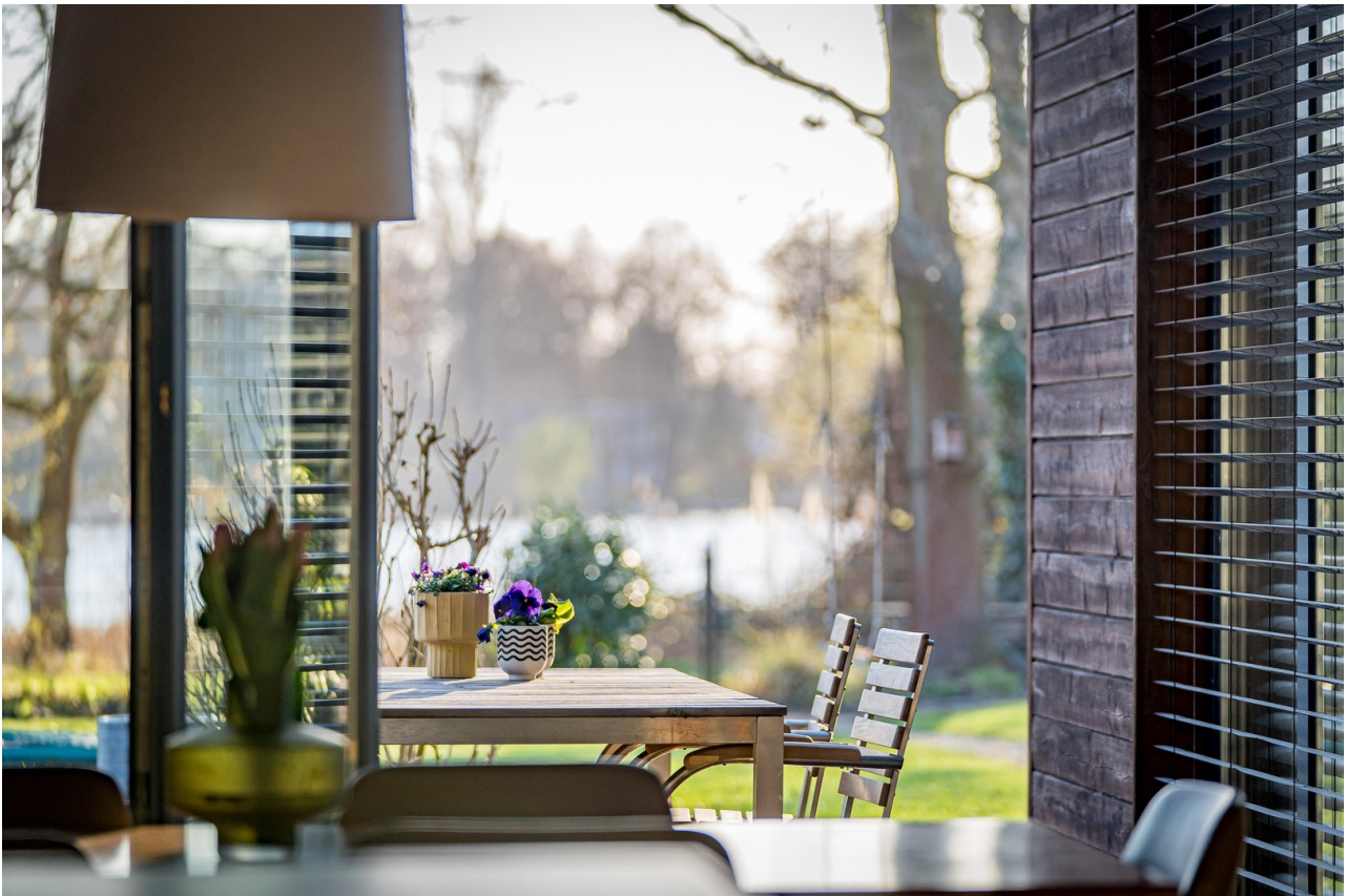
Essbereich mit Seeblick