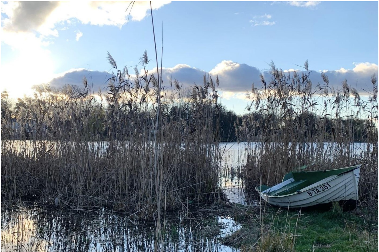
See im Abendlicht