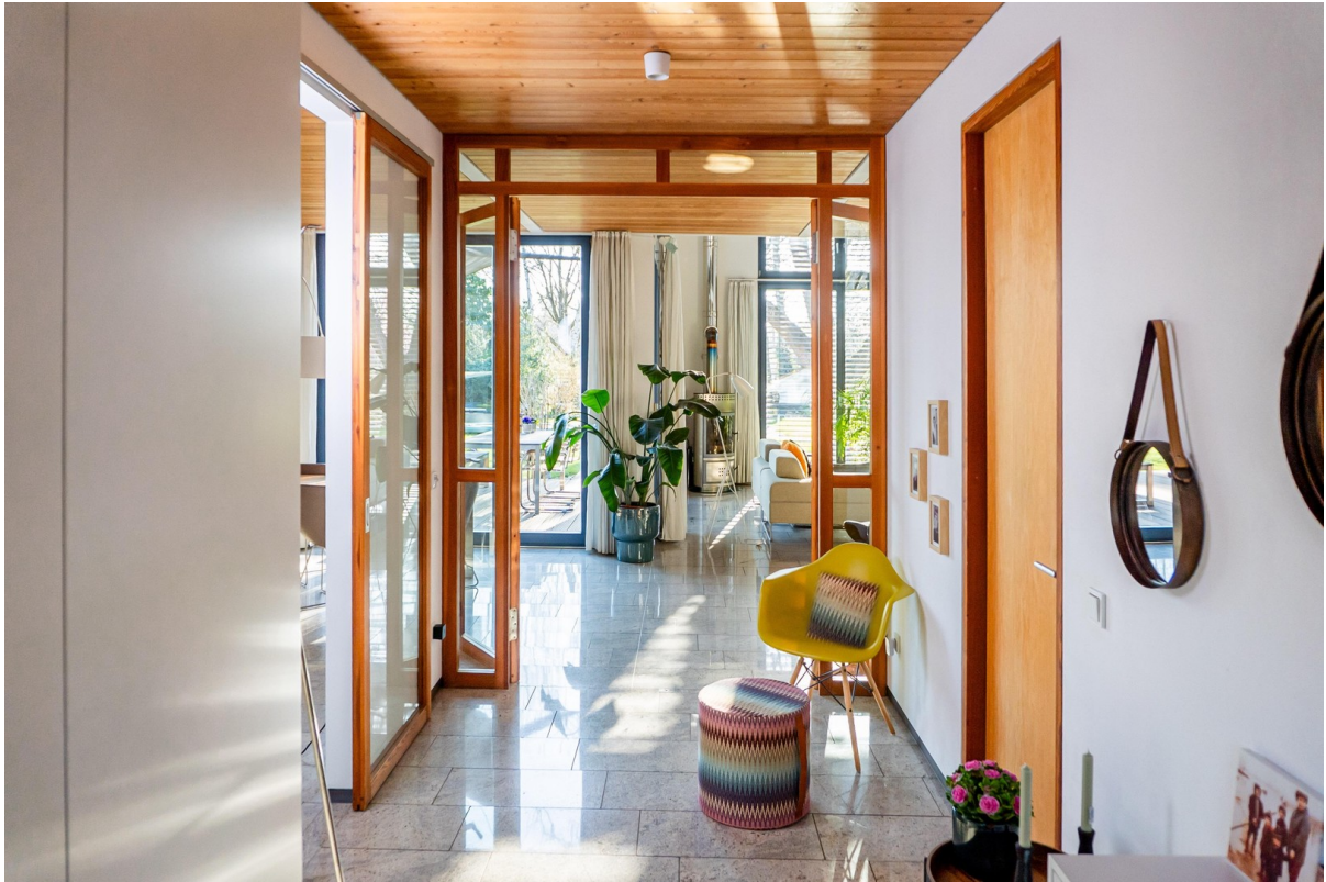
Eingangsbereich m. Sichtachsen