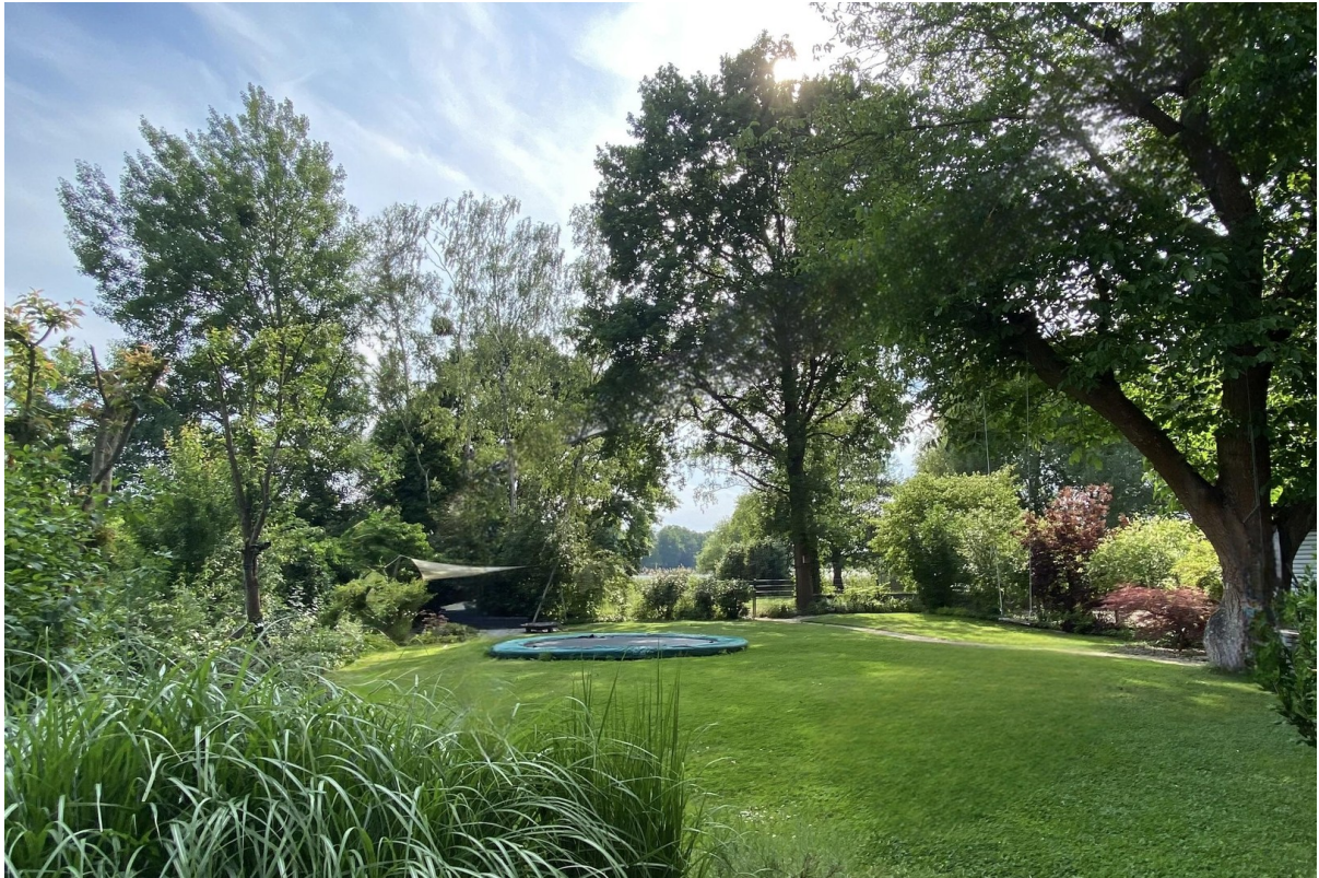
Gartenidylle im Sommer