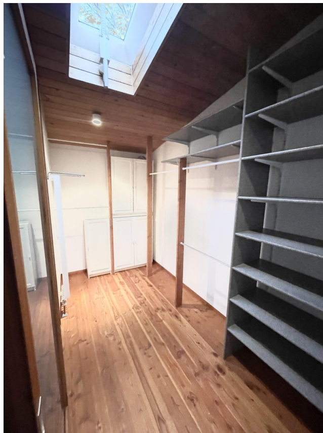
Ankleide mit Dachfenster