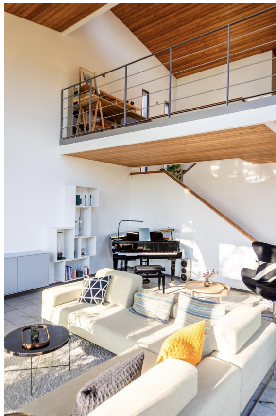
Wohnbereich mit Galerieebene