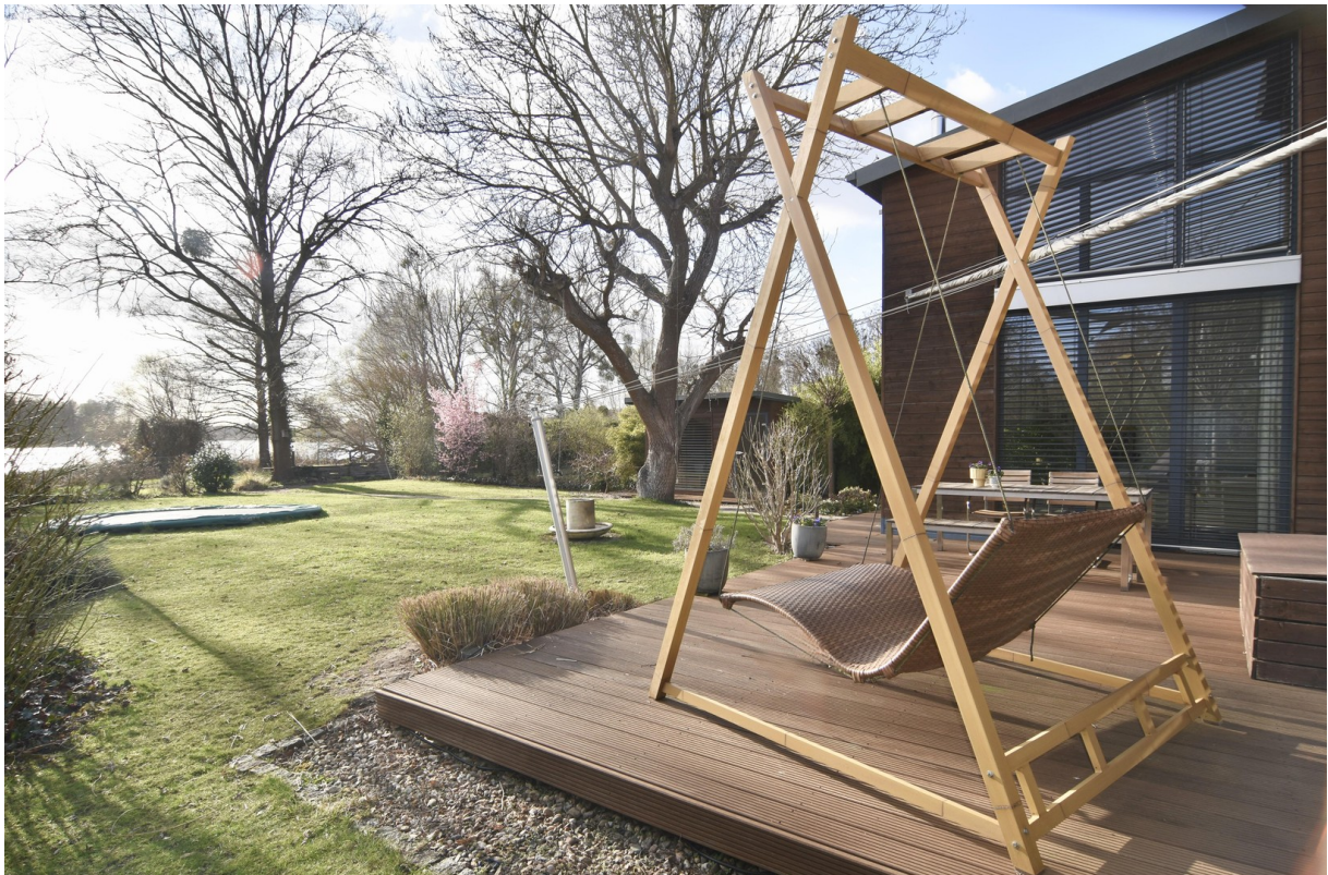
Sonnenterrasse mit Seeblick