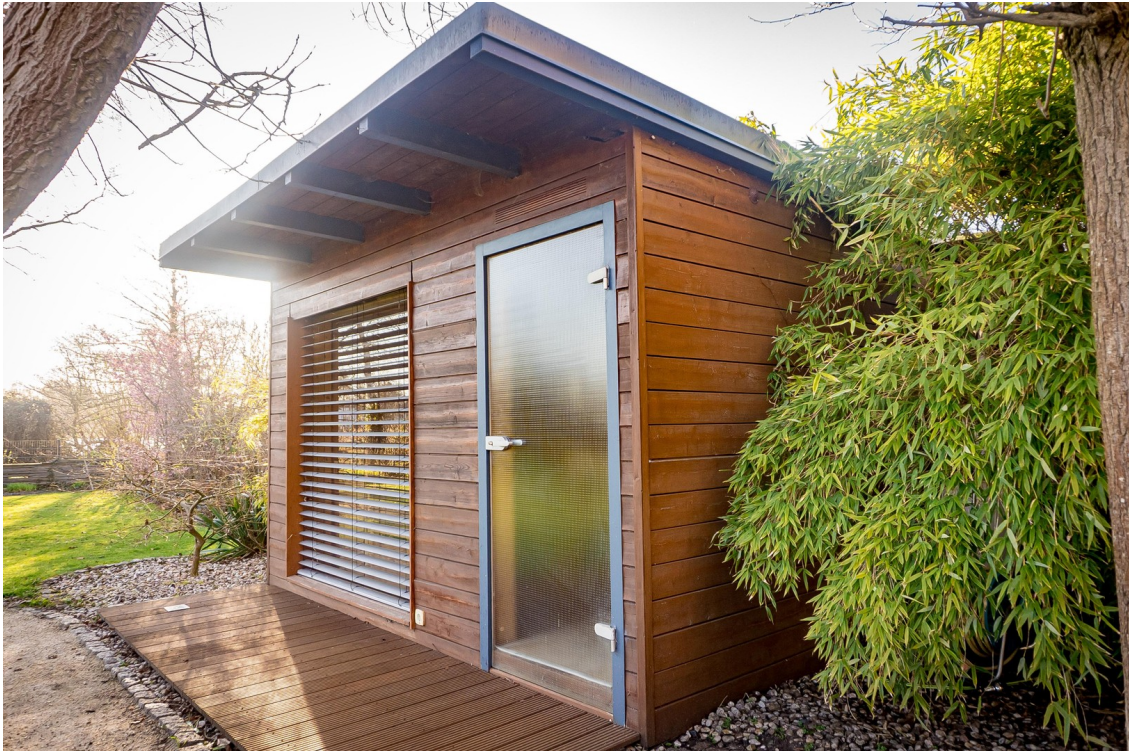
Gartensauna mit Blick Garten