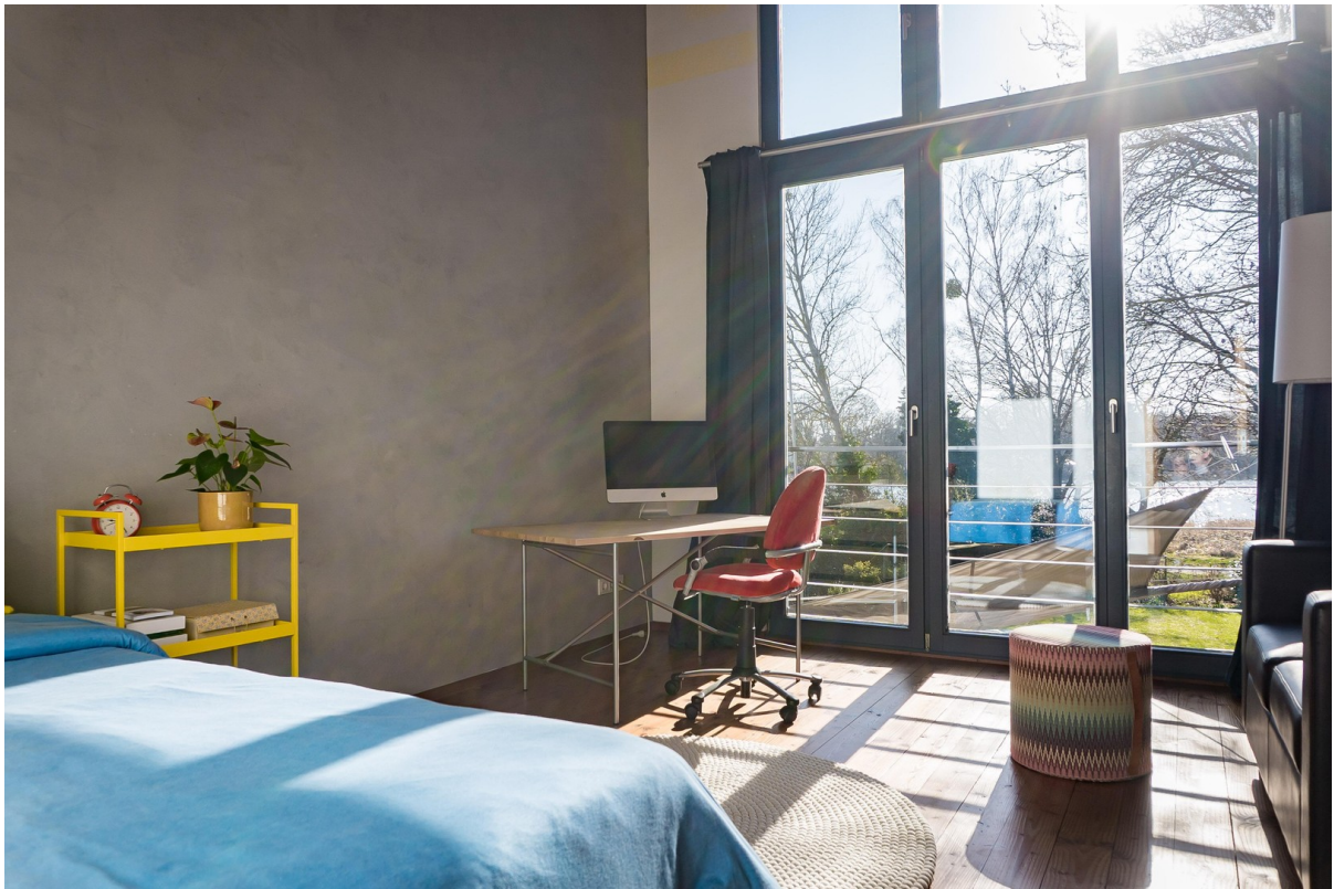
Lichtdurchflutetes Zimmer Kind