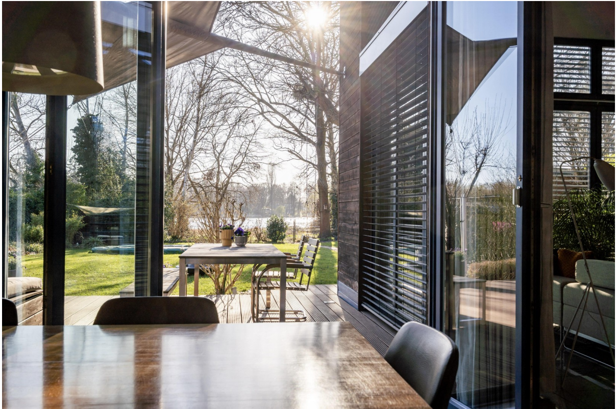
Essbereich mit Seeblick