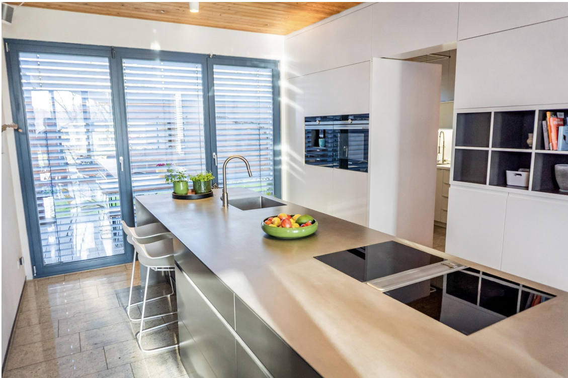
Küche - Blick HW Raum