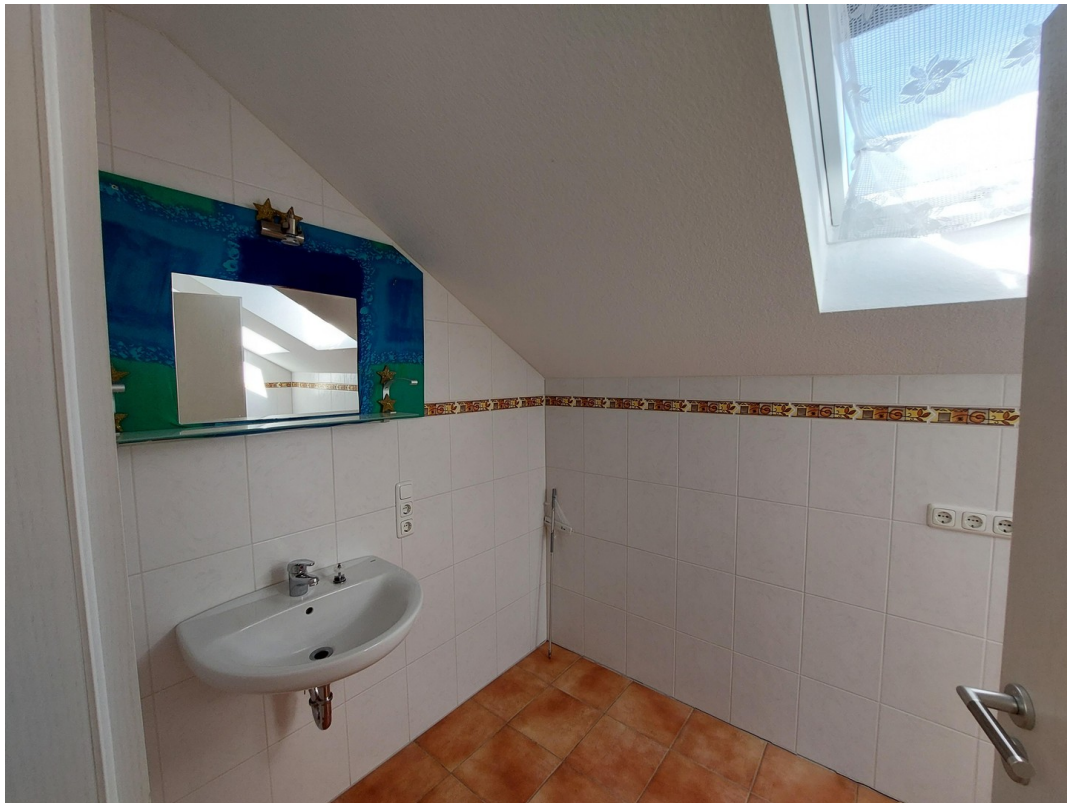
Bad, rechts Platz für WM u WT