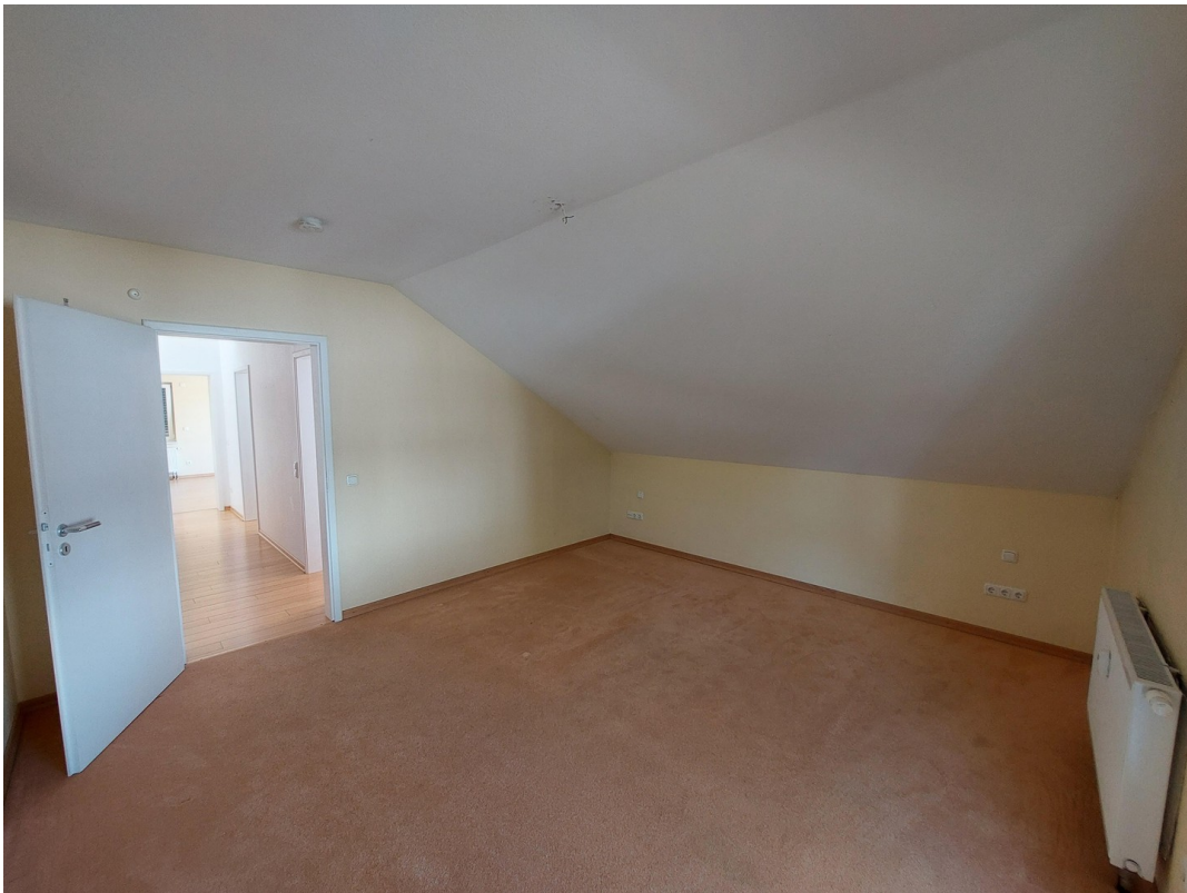
Schlafzimmer vom Fenster