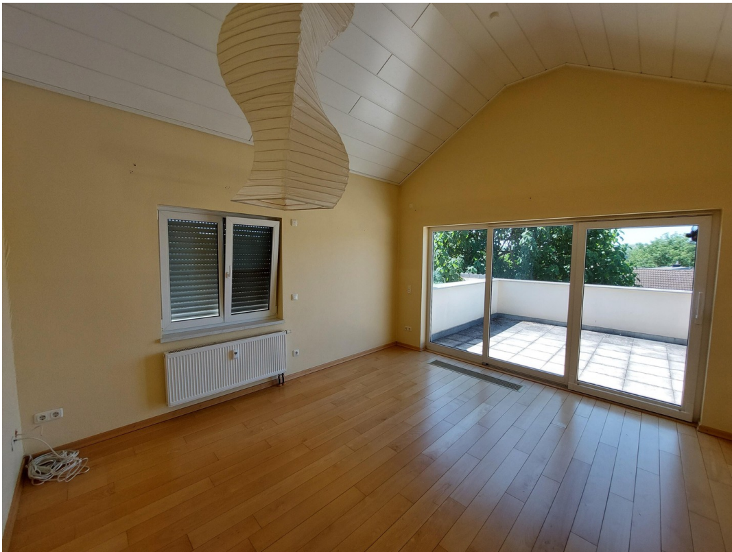
Wohnzimmer mit Dachterrasse