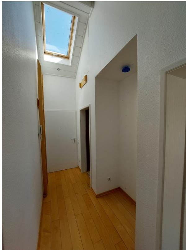
Flurbereich / Eingang