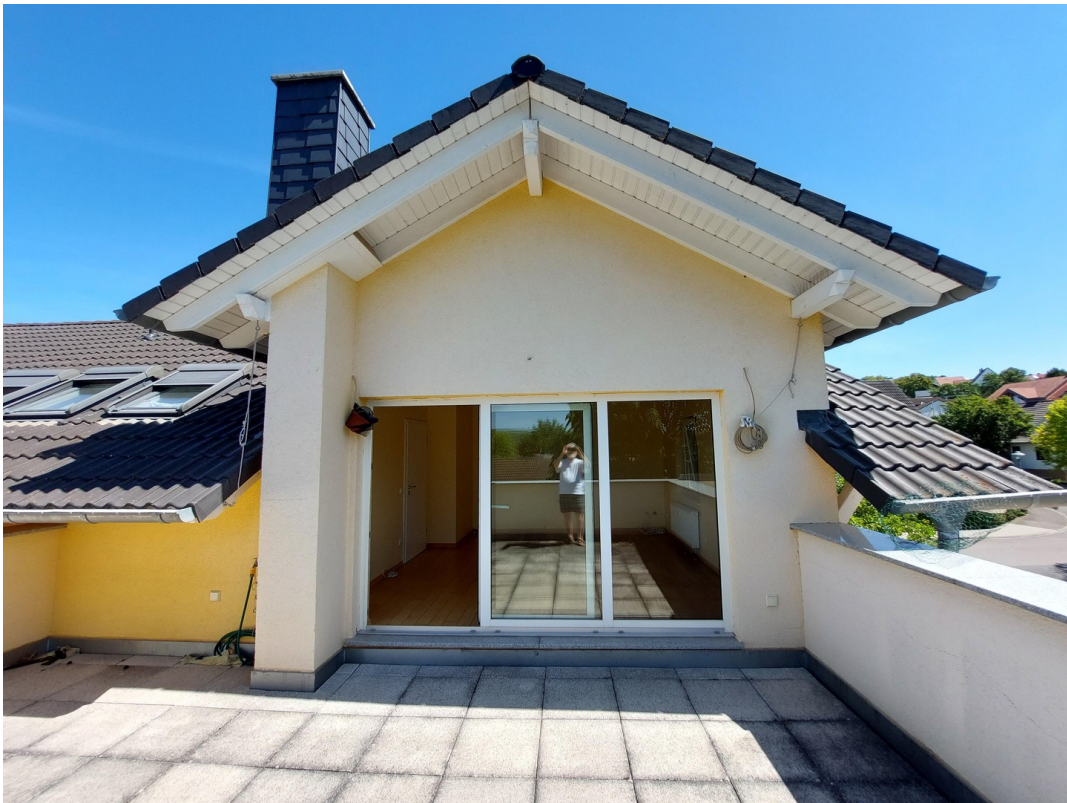
Dachterrasse, Blick auf WZ