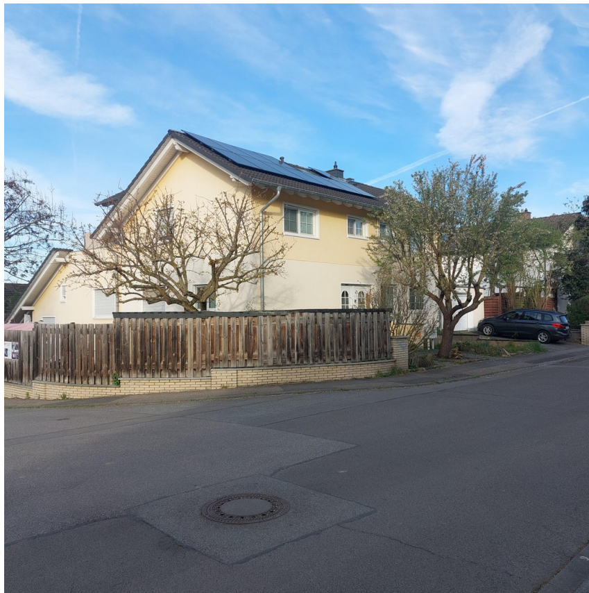
Blick aus Osten