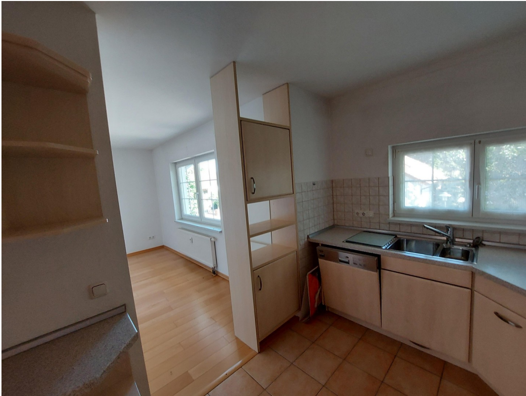
Übergang zum Esszimmer