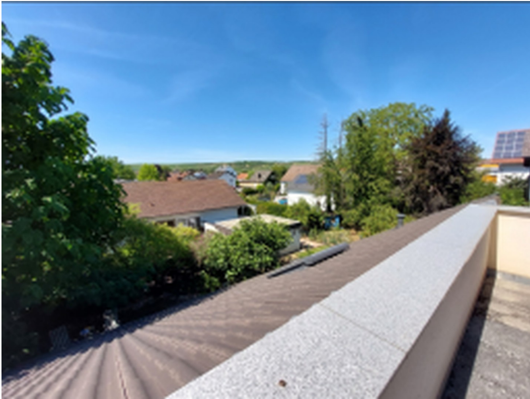
Blick von Dachterrasse