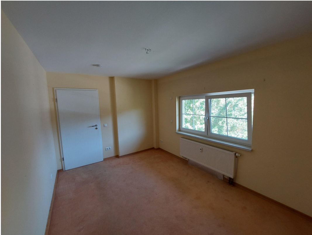
2. Schlafzimmer / Büro