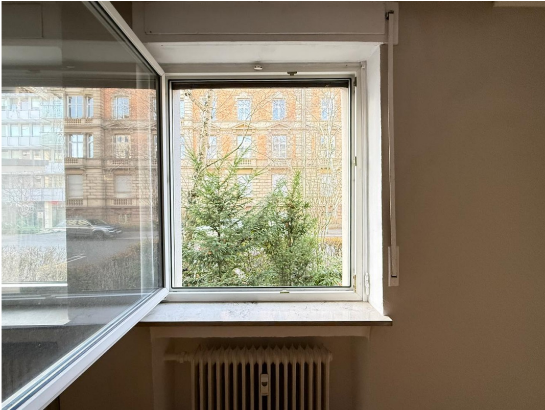
Wohnzimmer Fenster Ausblick