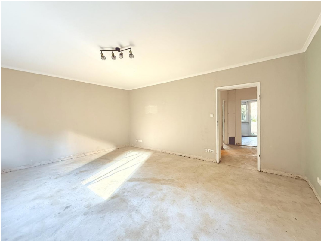
Wohnzimmer Flur Küche