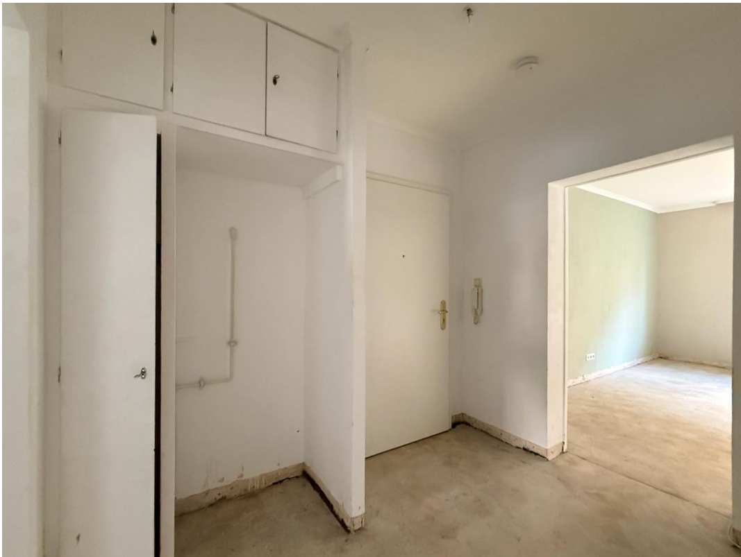
Flur Wohnungstür Wohnzimmer