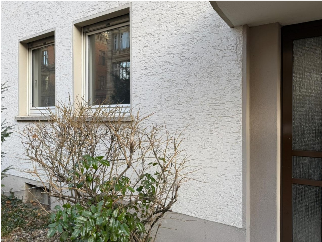
Hausfront Wohnimmer Fenster