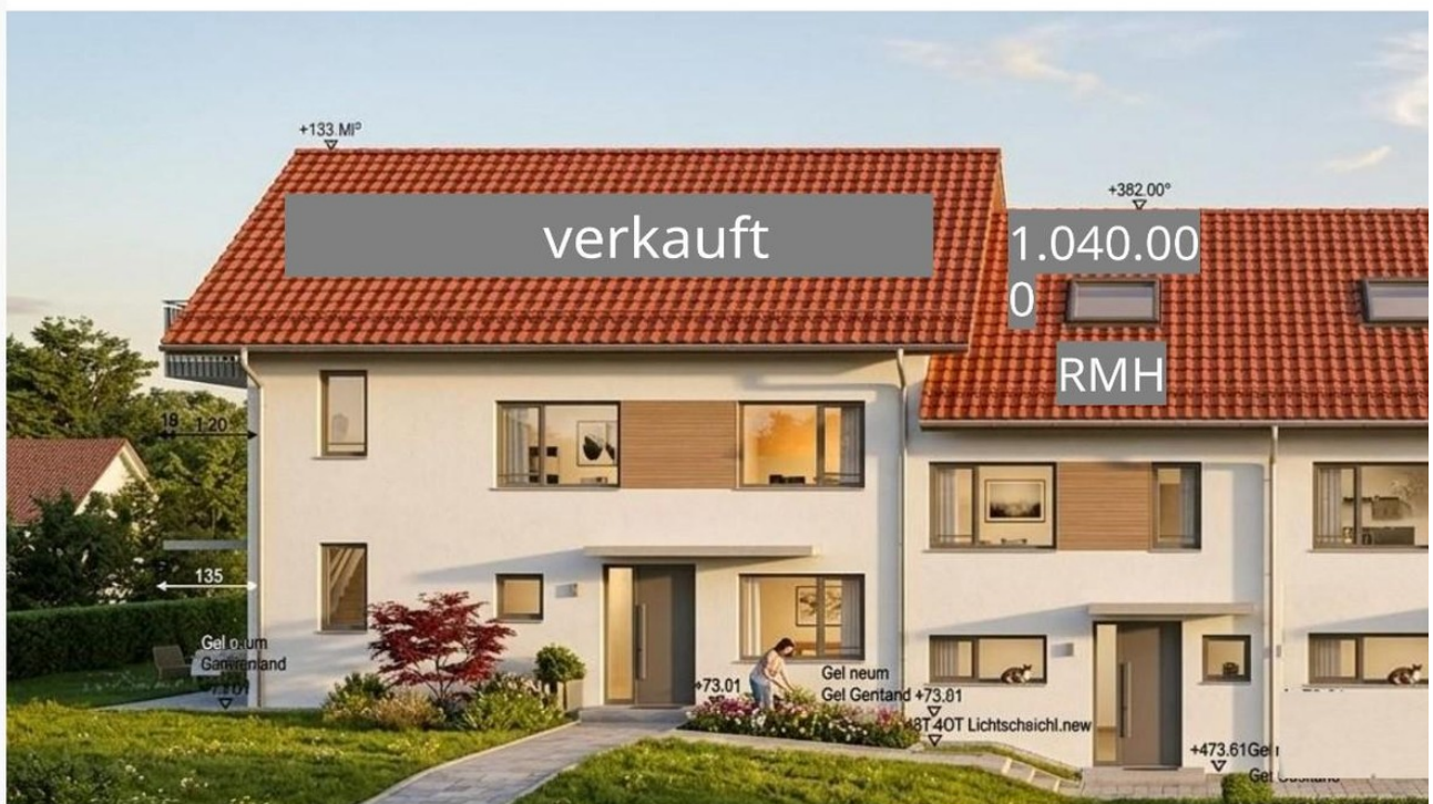
Haus Ansicht Nord