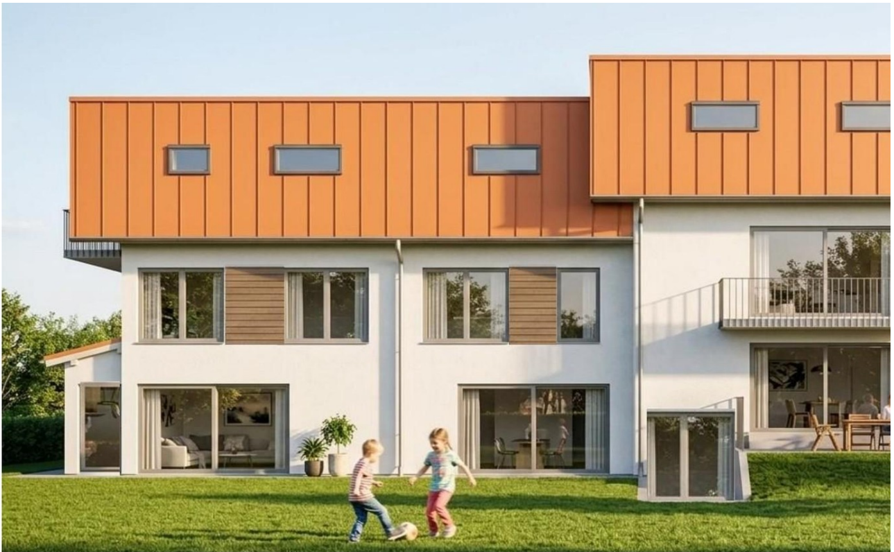
Gesamthaus Ansicht Süd