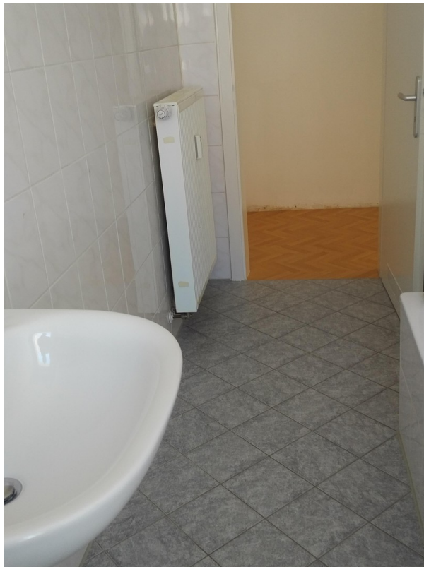
Bad / Fliesenbelag