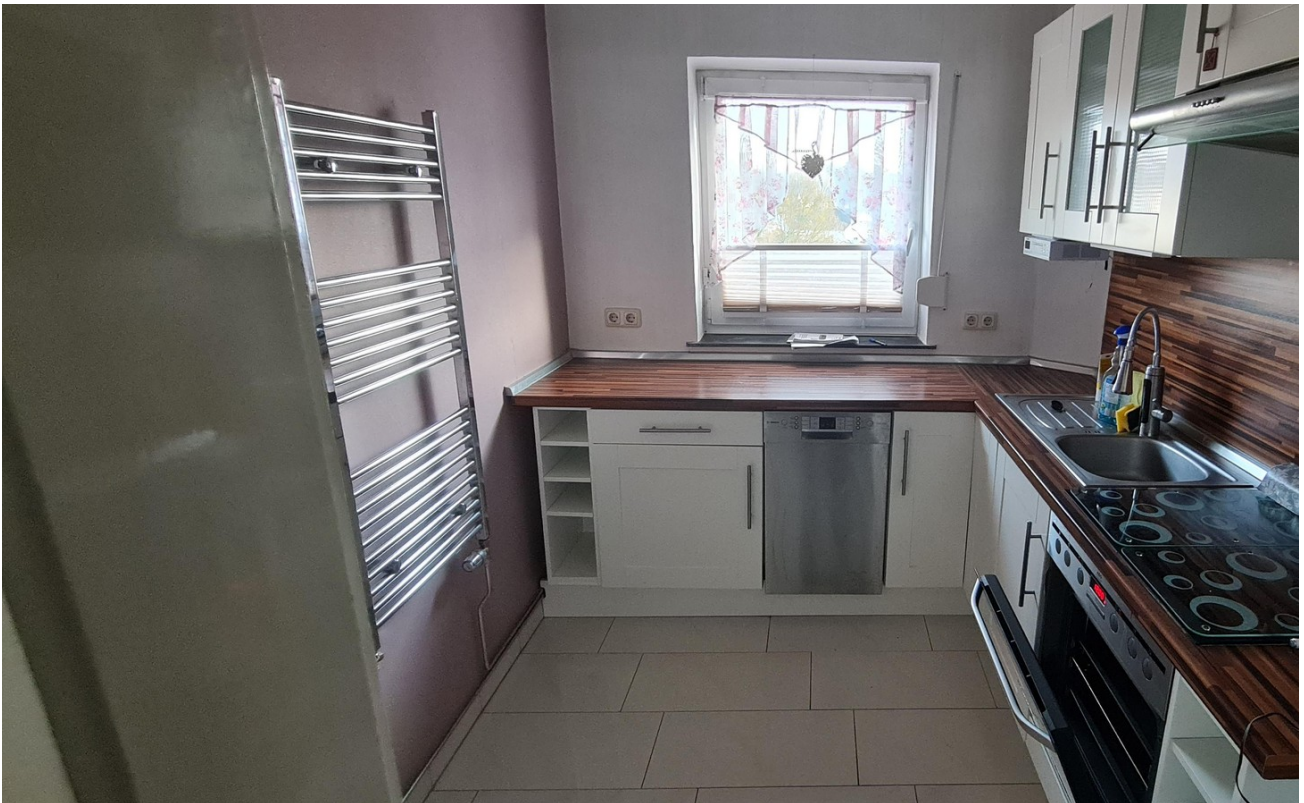
Küche mit Markengeräten