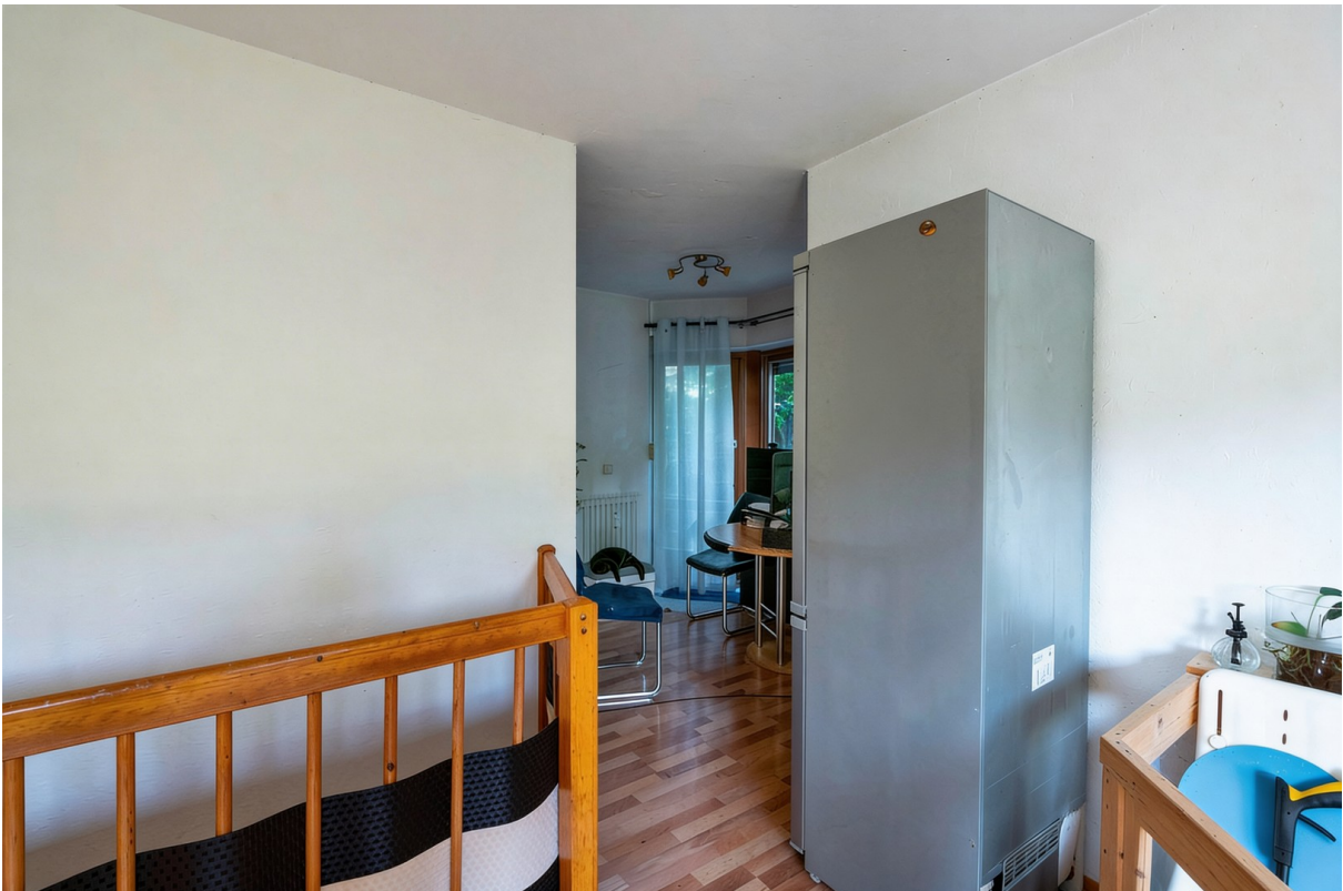
Blick in Küche