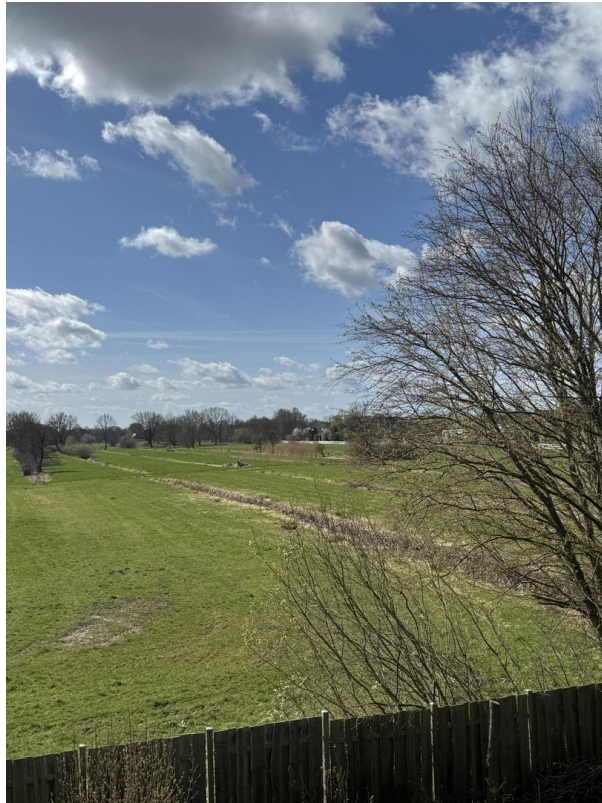
Ausblick Wohnzimmer OG