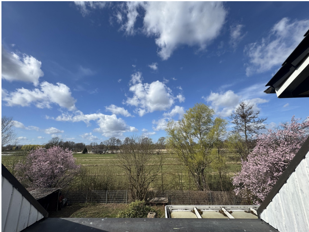
Ausblick Balkon OG