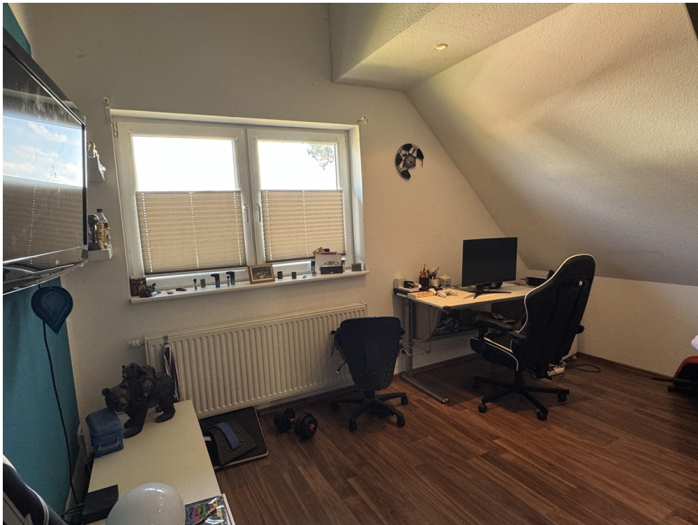
Zimmer 2 OG