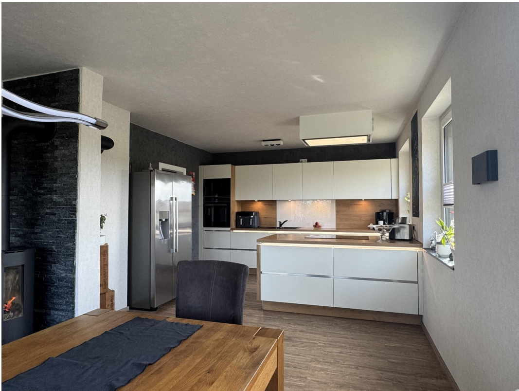
Blick vom Essber. in die Küche