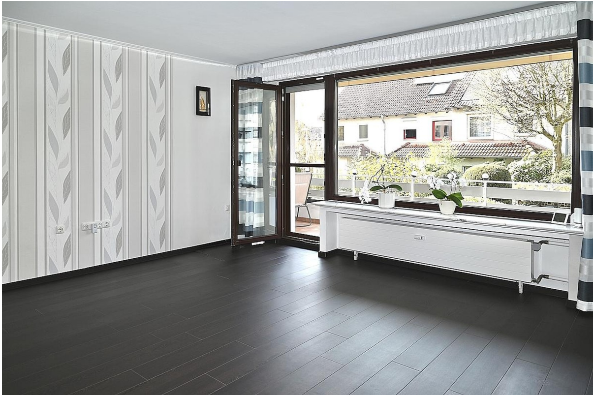
Wohnzimmer mit Balkonzugang