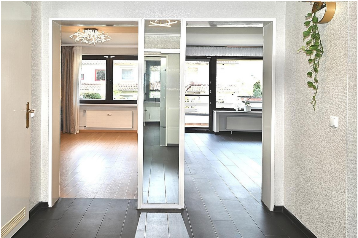
Diele Blick Wohnz. / Kinderz.