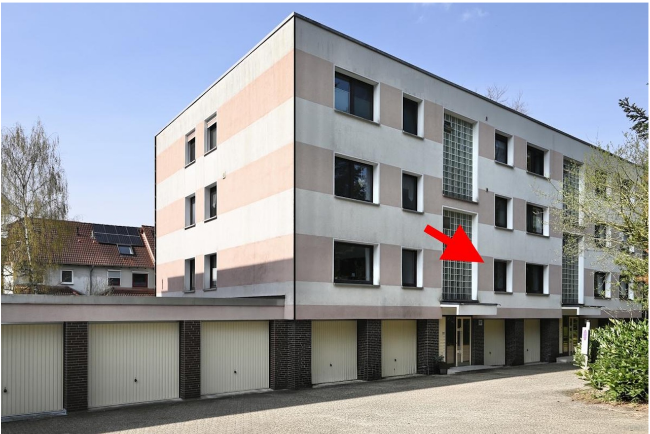
Hausansicht vorne mit Garagen