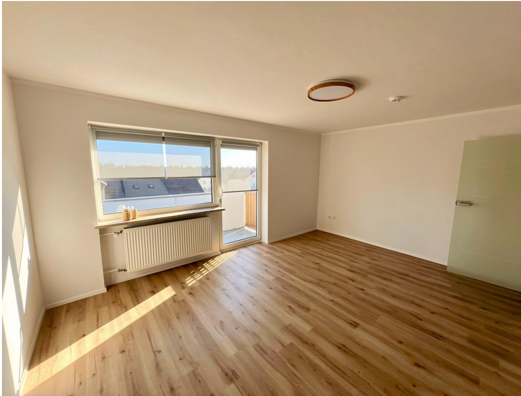
Blick ins Studio - unmöbliert