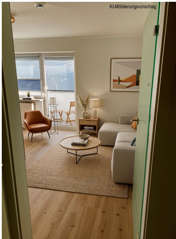
Blick ins Studio KI möbliert