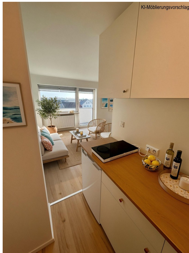
Küche ins Studio-KI möbliert