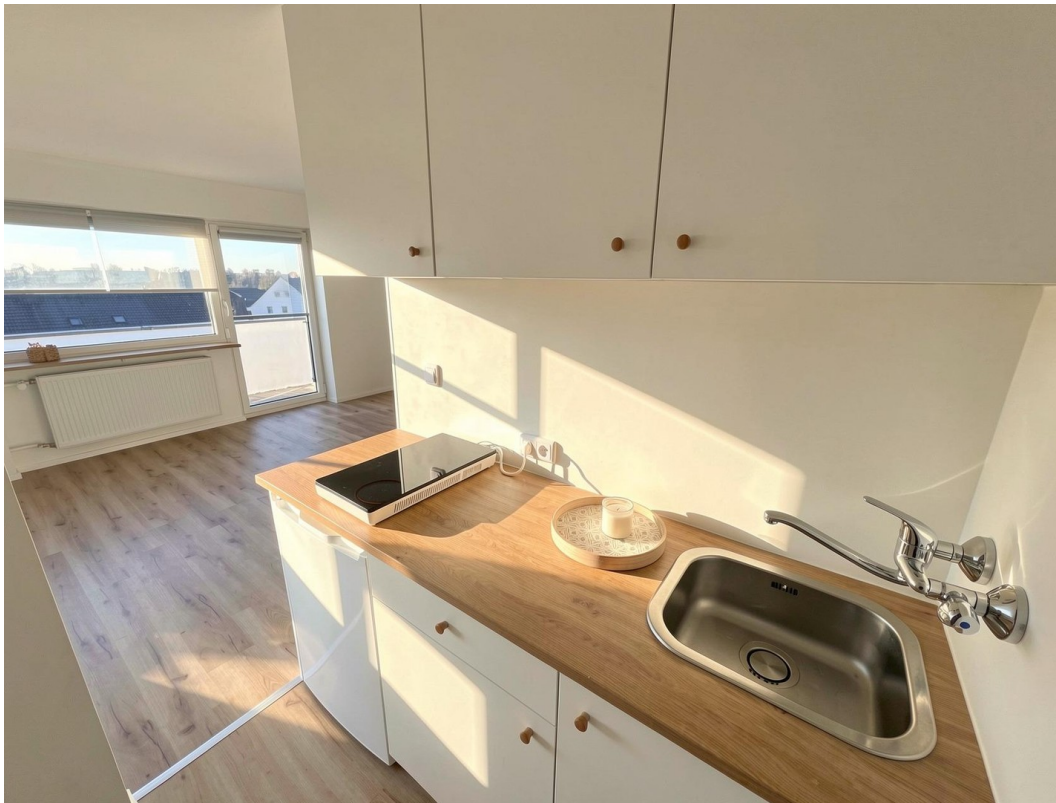
Blick von der Küche ins Studio