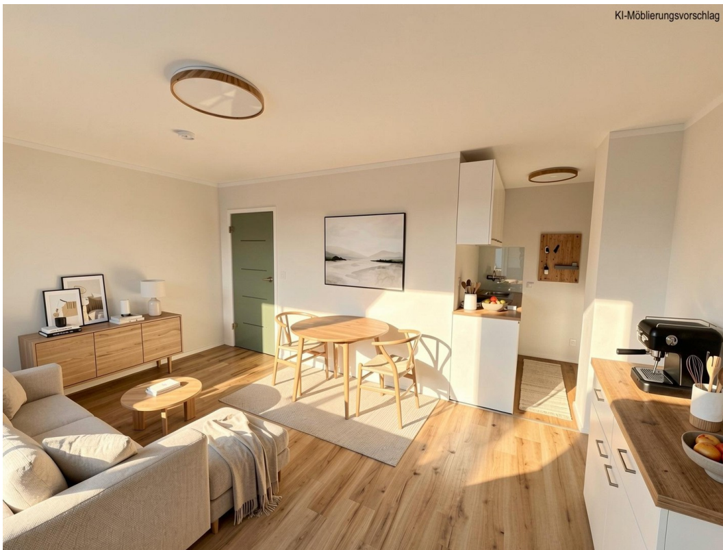
Studio - KI möbliert