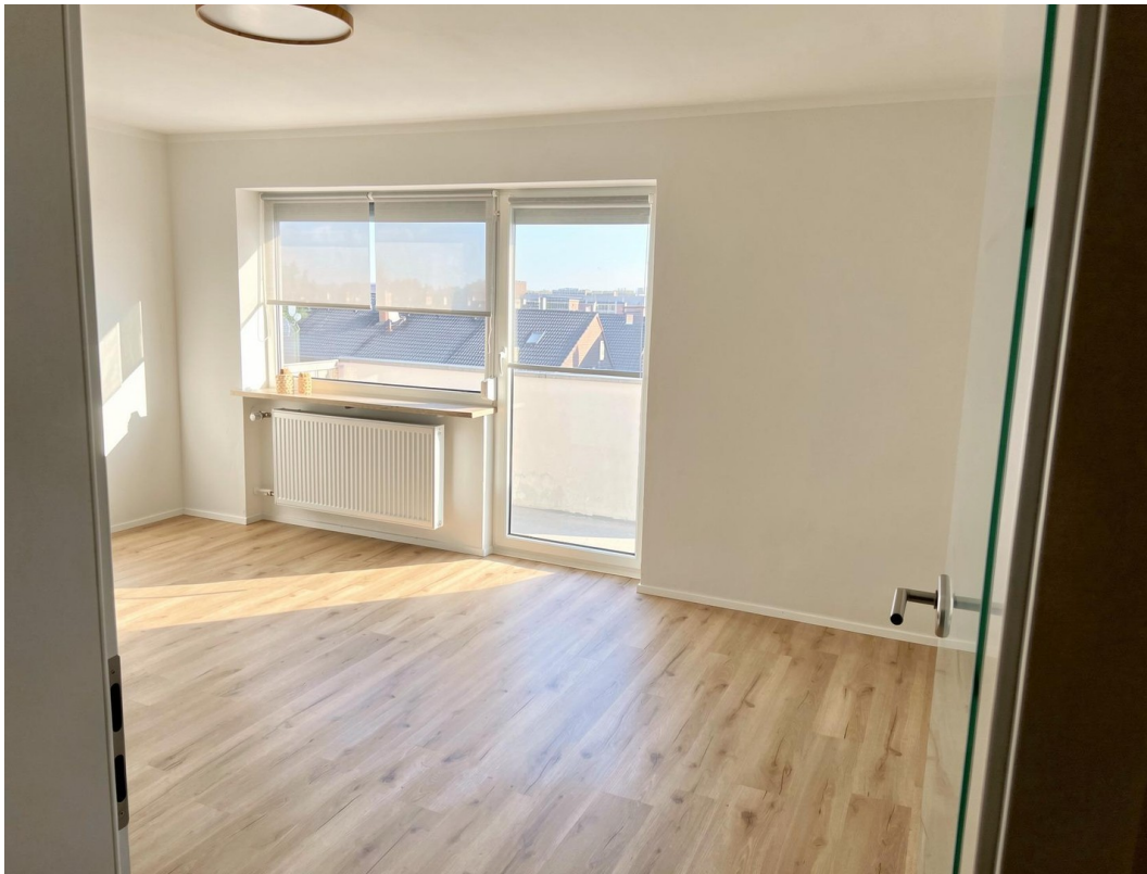
Blick vom Flur ins Studio