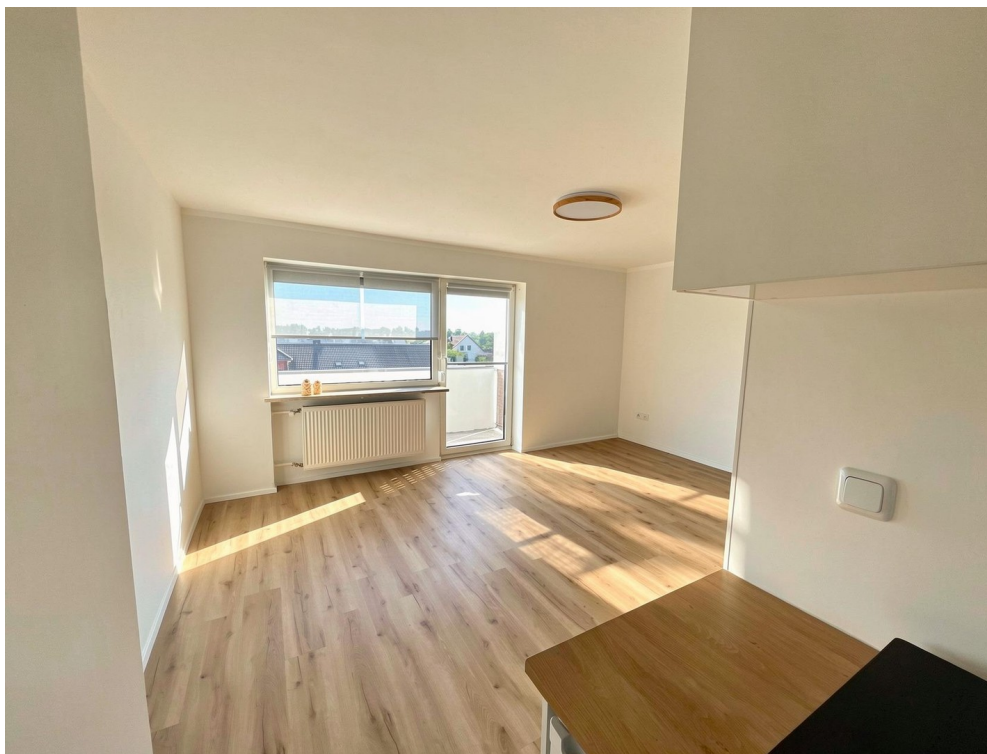
Blick Küche zum Balkon