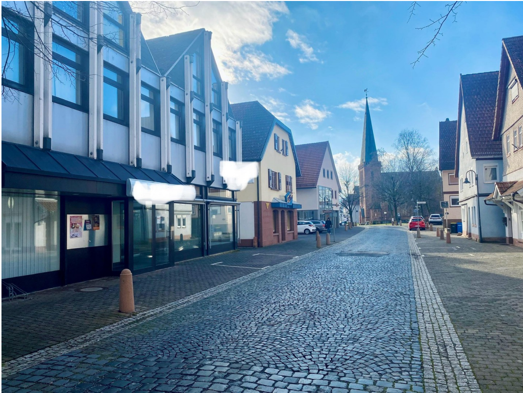
Außenansicht - Zentrale Lage