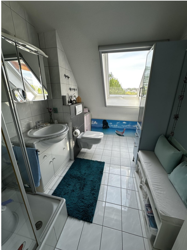
Duschbad im 1. DG