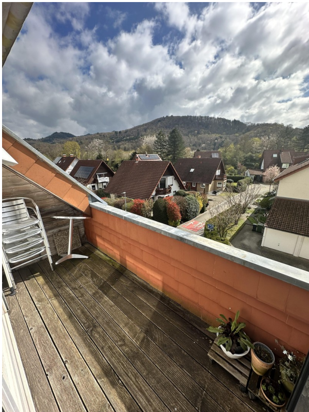
Loggia m. Süd-/Ost-Ausrichtung