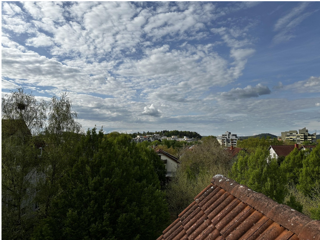
Blick aus Büro