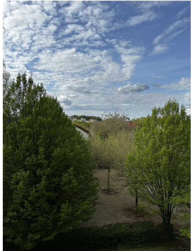
Aussicht vom Duschbad