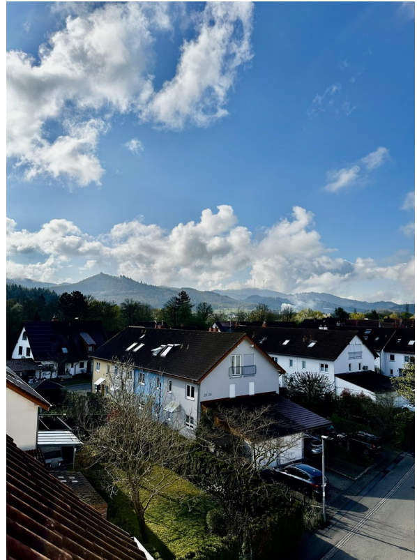
Blick vom Gästezimmer