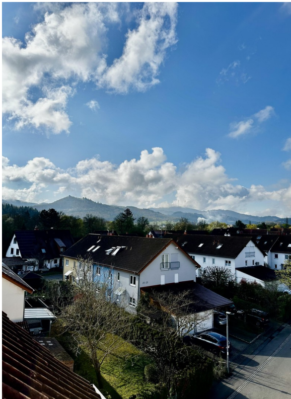
Blick vom Gästezimmer