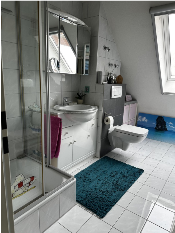
Bad mit Dusche/WC im 1. DG