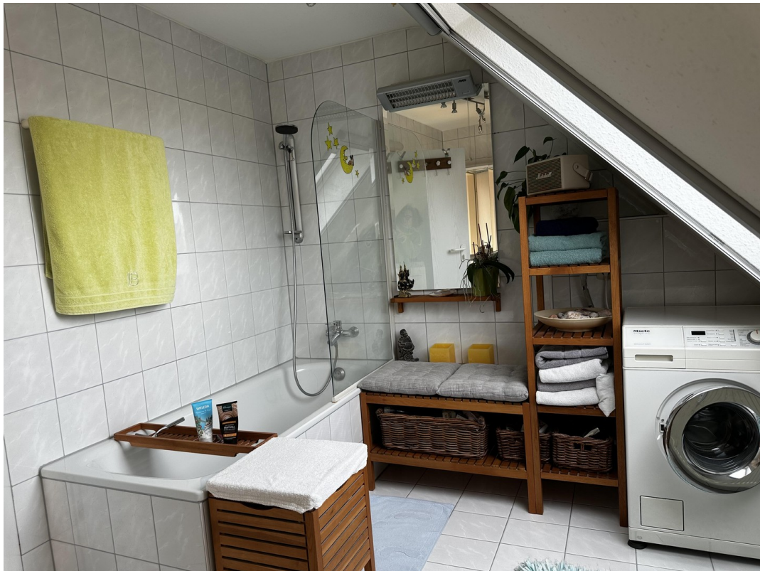
Bad mit Badewanne/WC (Bild 1)