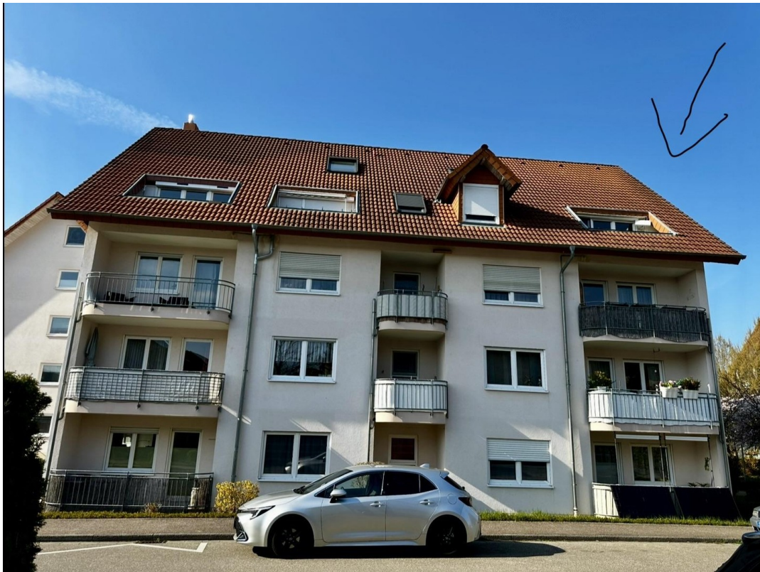
Hausansicht von der Straße