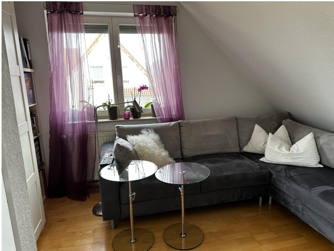
Fernsehzimmer (Bild 1)