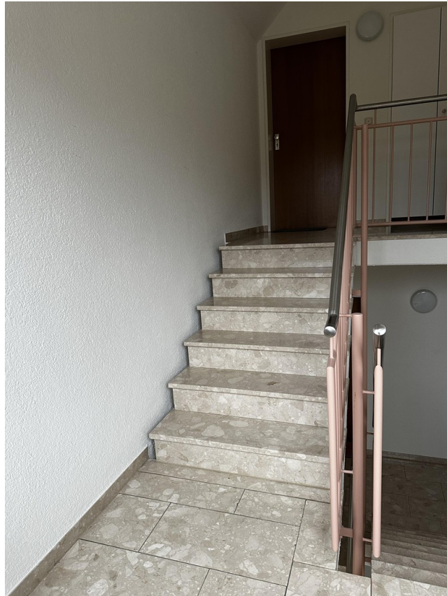
Zugang Treppenhaus ins 2. DG