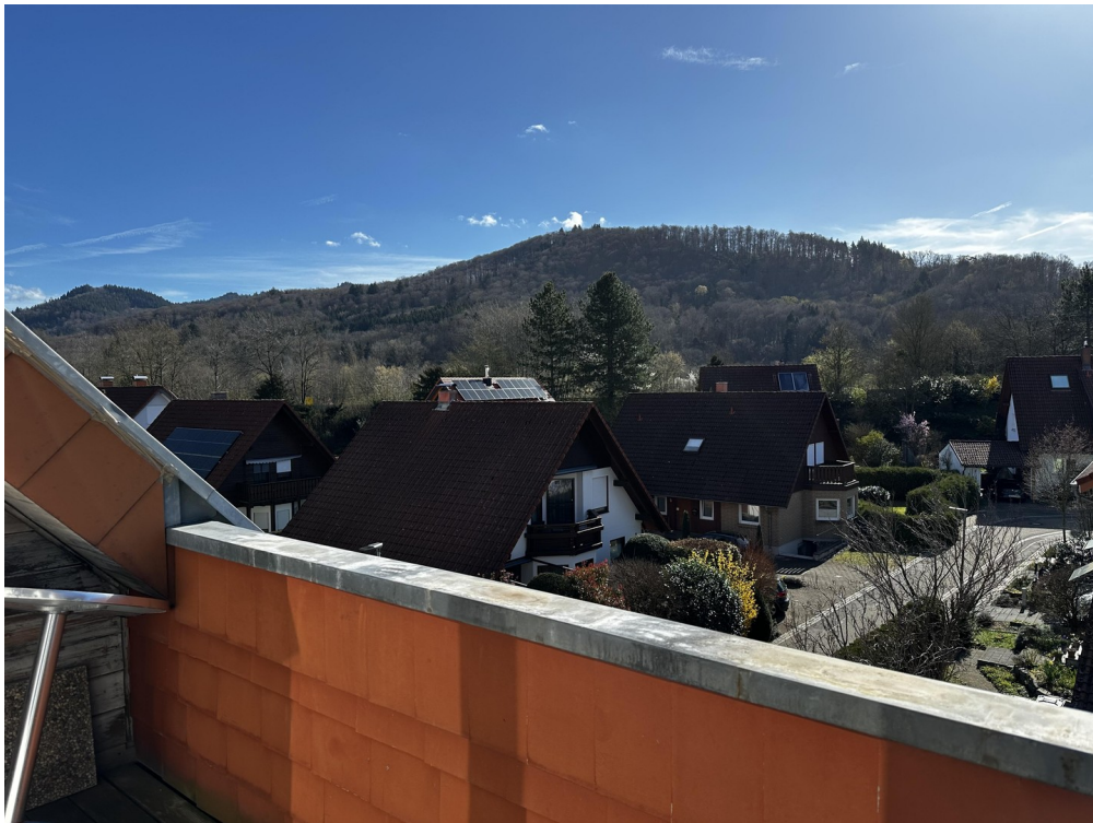
Aussicht von der Loggia