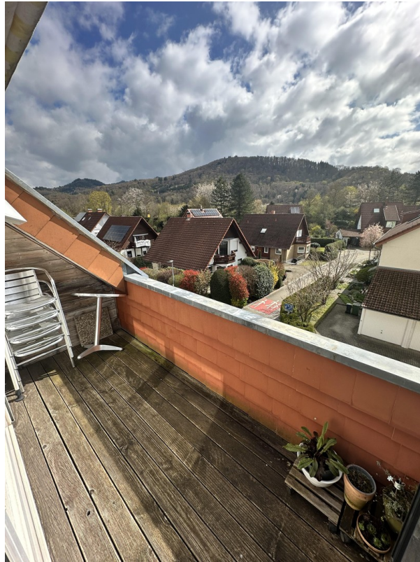
Loggia m. Süd-/Ost-Ausrichtung