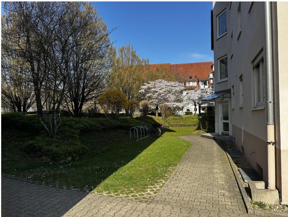
Sicht auf Hauseingang