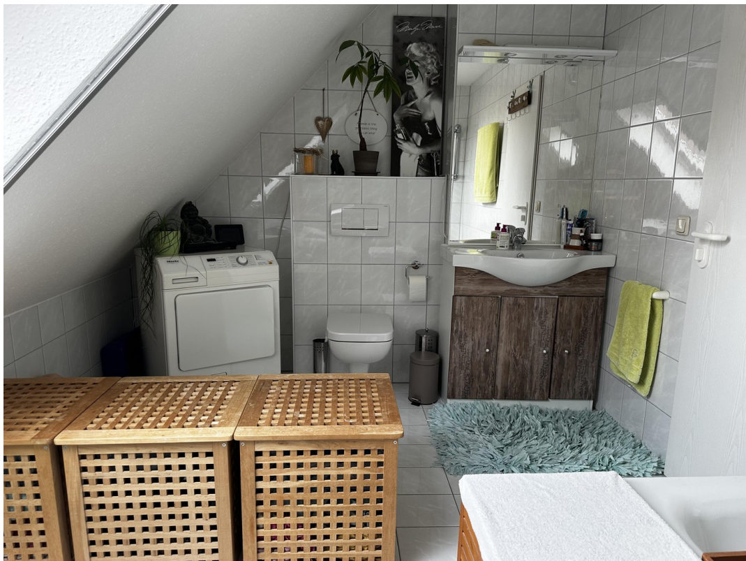
2. DG Badezimmer (Bild 2)