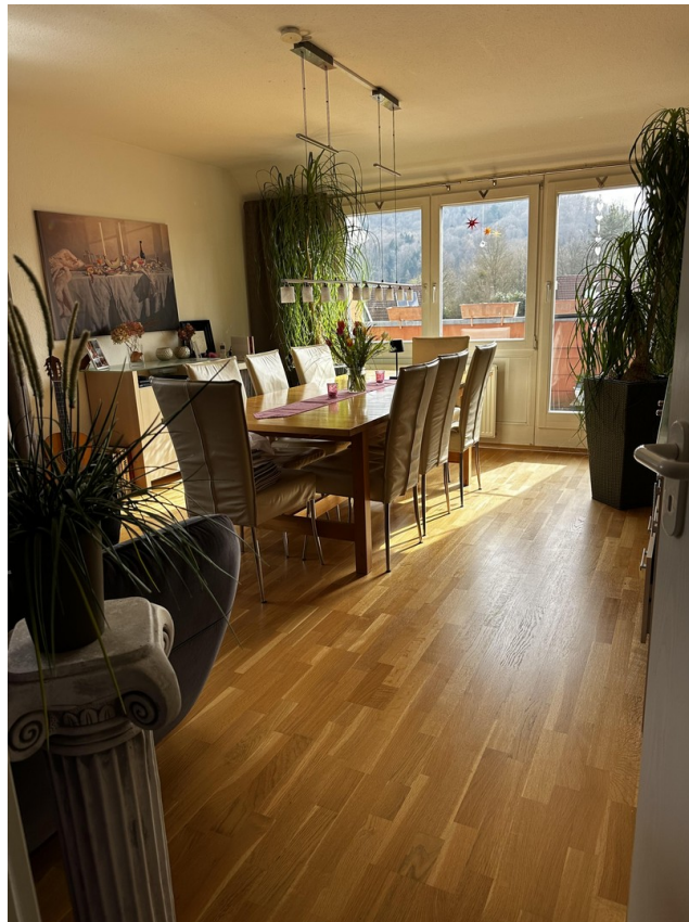
Wohnzimmer mit Zugang Loggia