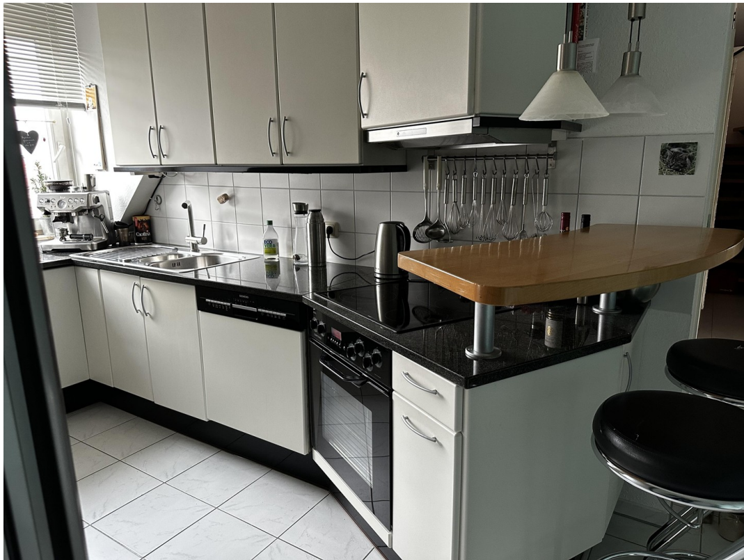
Einbauküche mit Theke