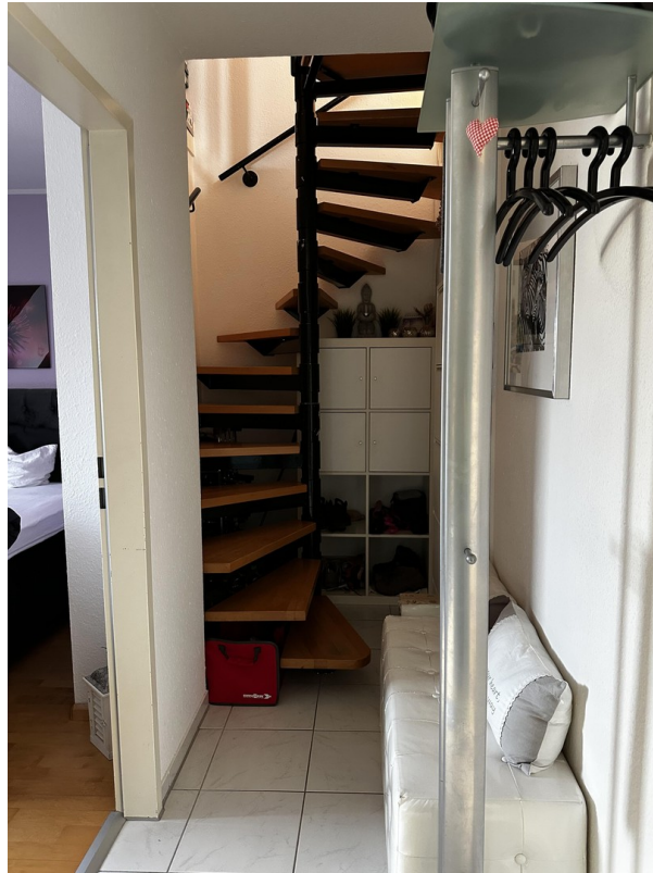
Wendeltreppe in 2. DG