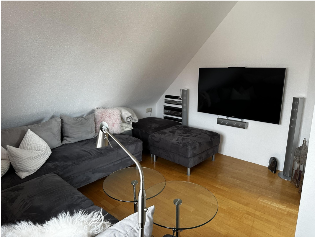
Fernsehzimmer (Bild 2)