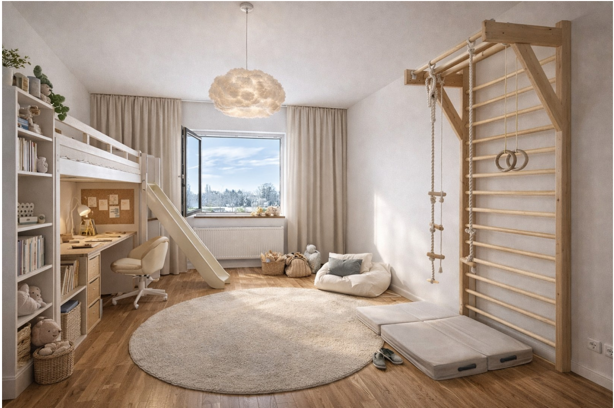
Visualisierung - Kinderzimmer