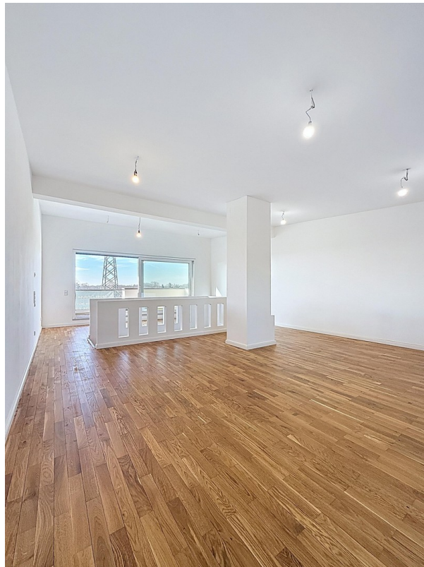
Galeriebereich mit exklusiver