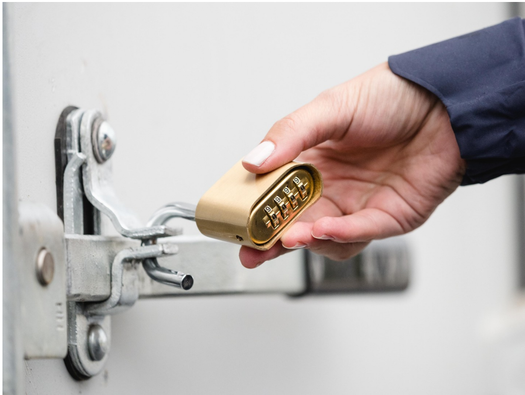
Zugangscod per Email