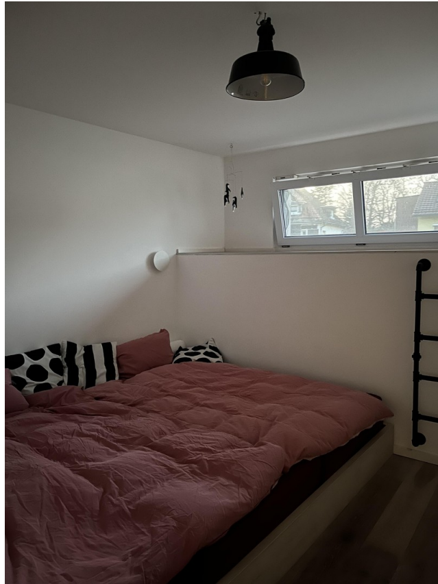
Schlafzimmer 2 OG