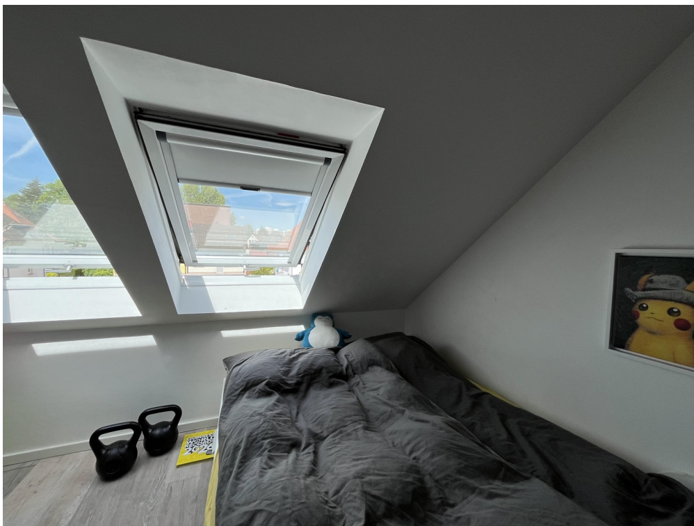
Kinderzimmer 2 DG