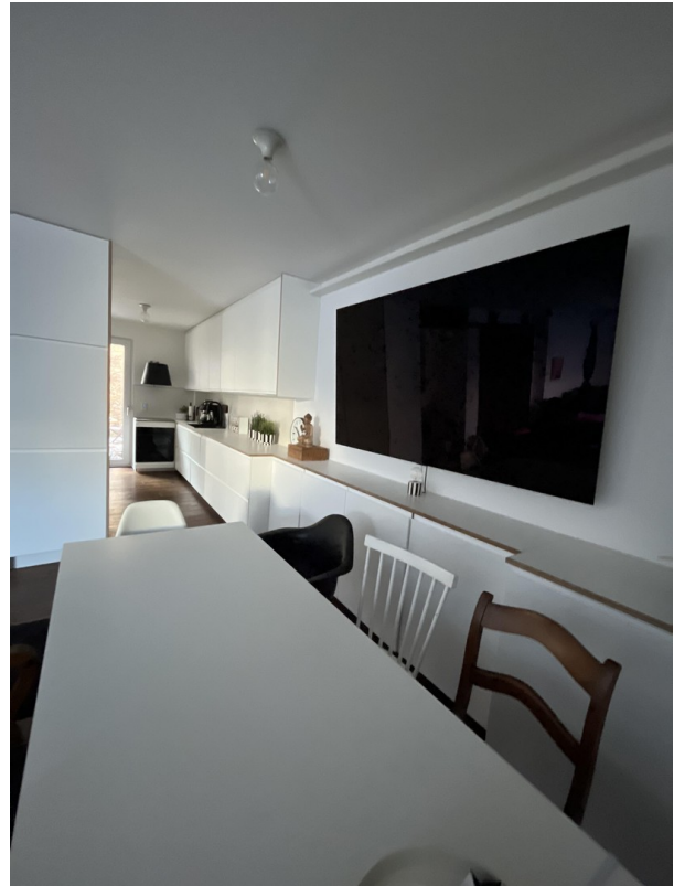
Blick Esszimmer Richtung Küche