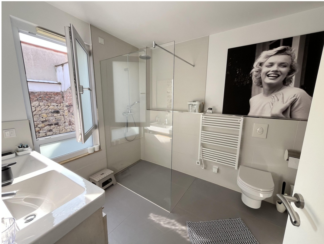
Begehbare Dusche OG