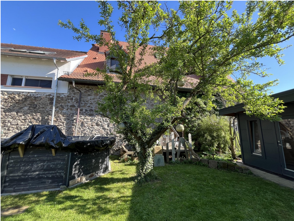
Stadtmauer, Pool, Gartenhaus