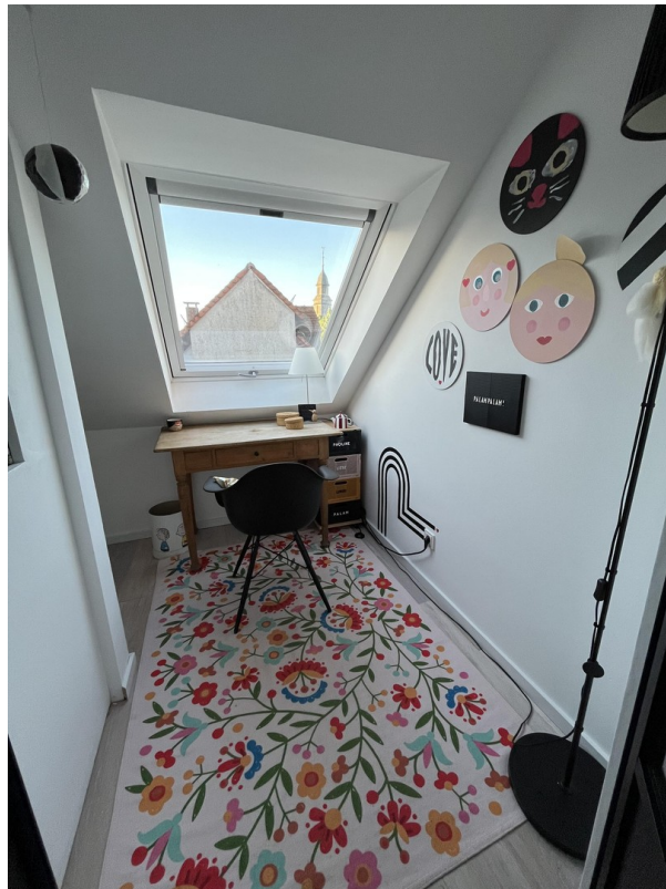
Arbeitszimmer DG Detail