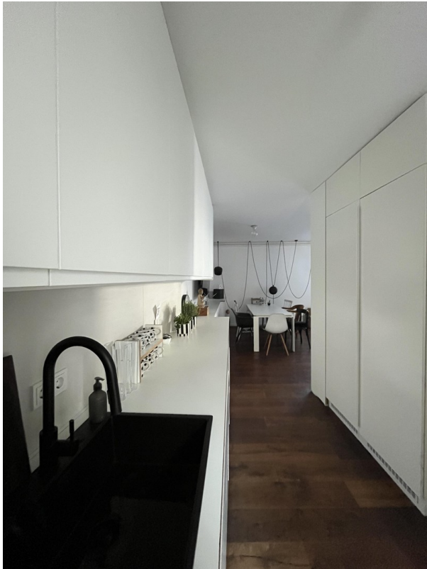
Blick Küche Richtung WZ