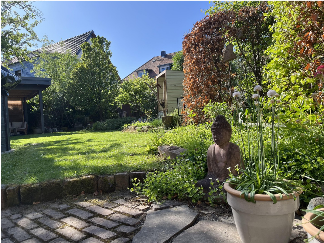
Blick Terrasse Richtung Garten