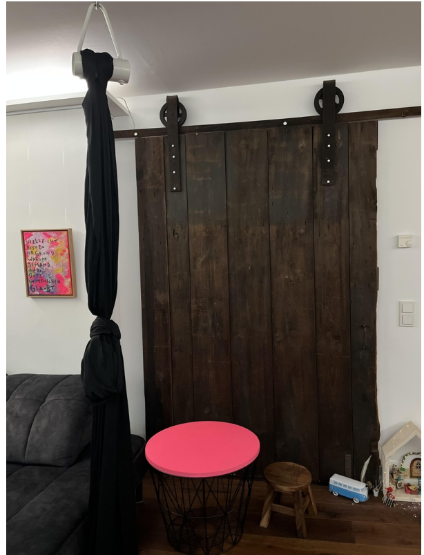
Scheunentor WZ Richtung Flur