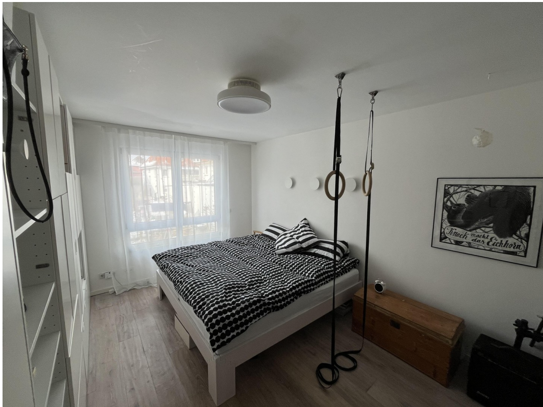
Schlafzimmer 1 OG