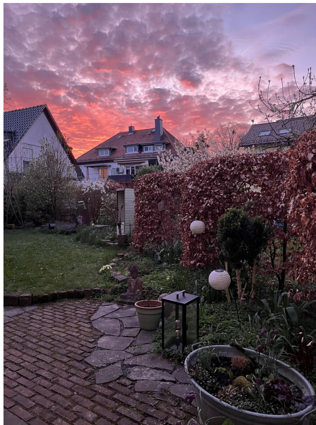
Abendgarten hinter dem Haus