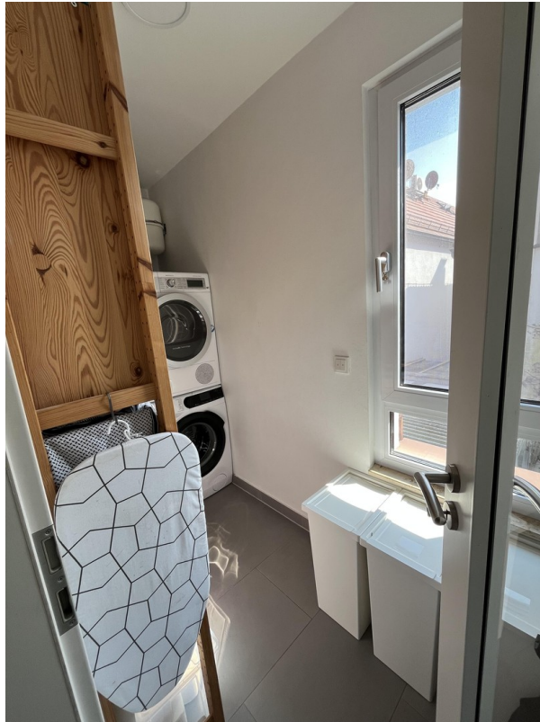
Waschmaschine, Trockner OG