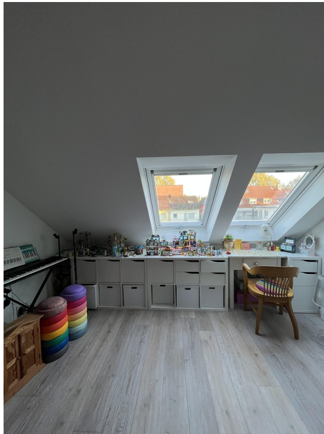
Kinderzimmer 1 DG