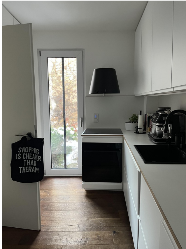
Küche mit Ausgang Vorgarten