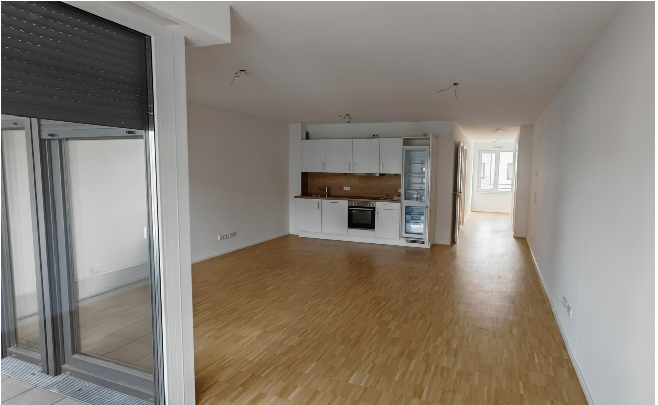
Wohnraum mit Küchenzeile