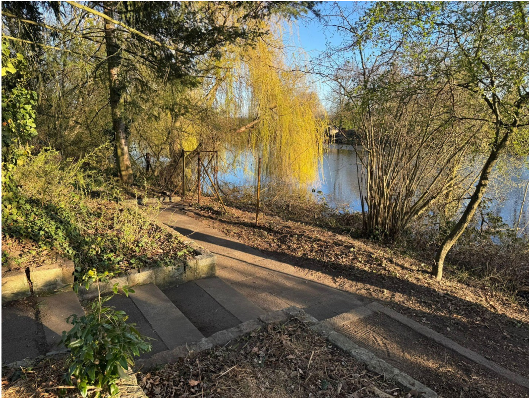
Terrasse + See