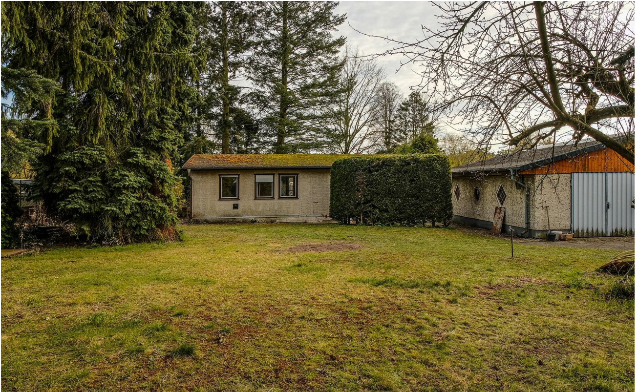
Bungalow + Garage