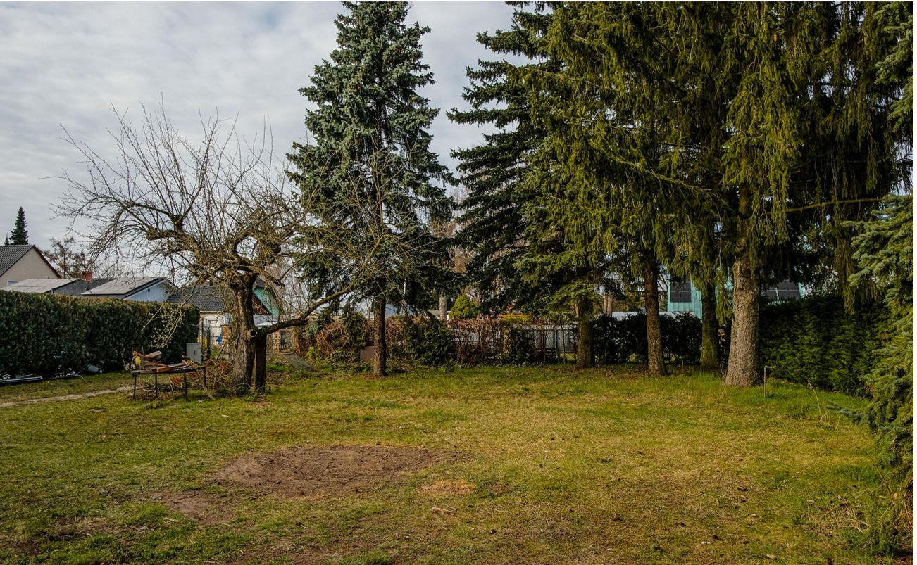
Blick zur Straße