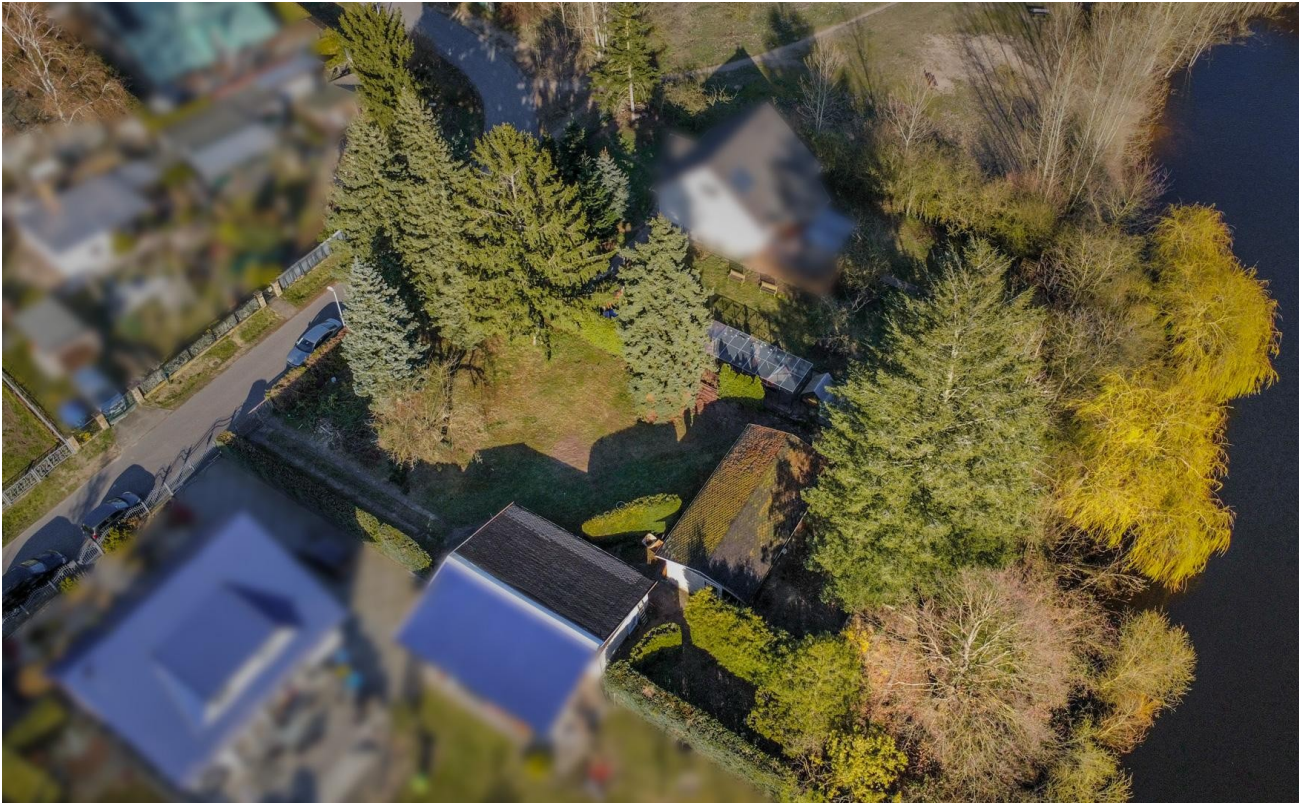
Luftbild Grundstück + See