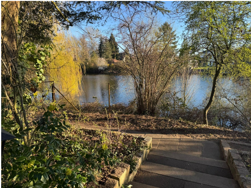
Privater Zugang + See