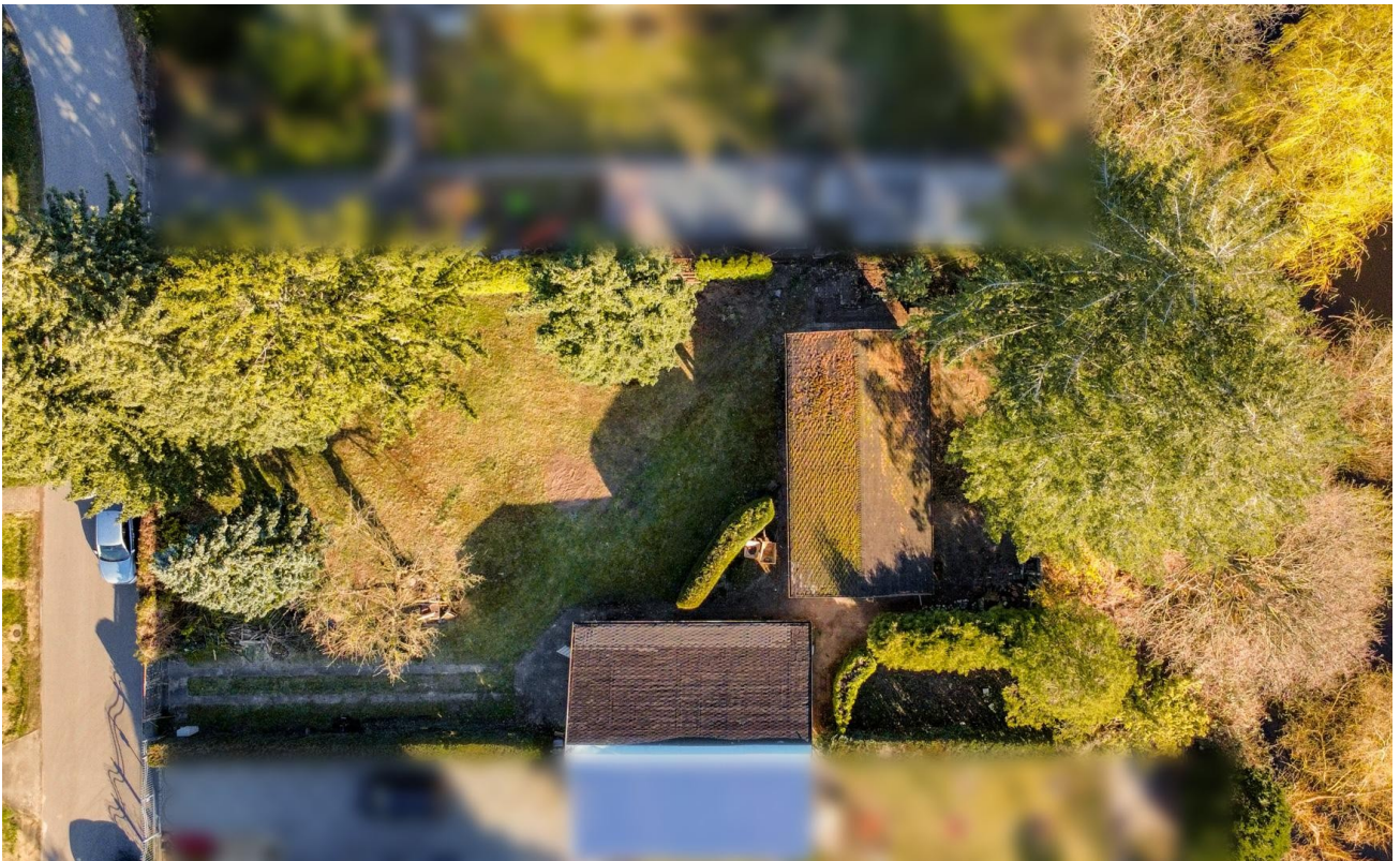
Sonnige Südlage am See