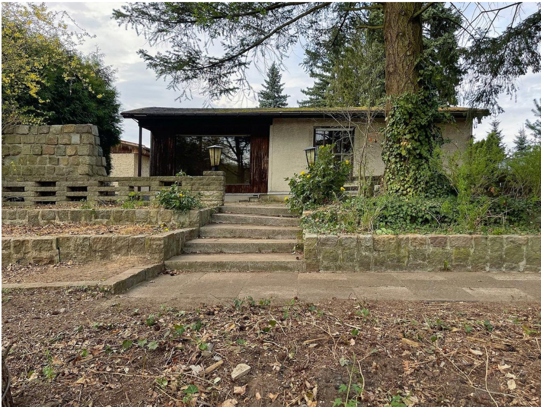
Bungalow + Seesicht