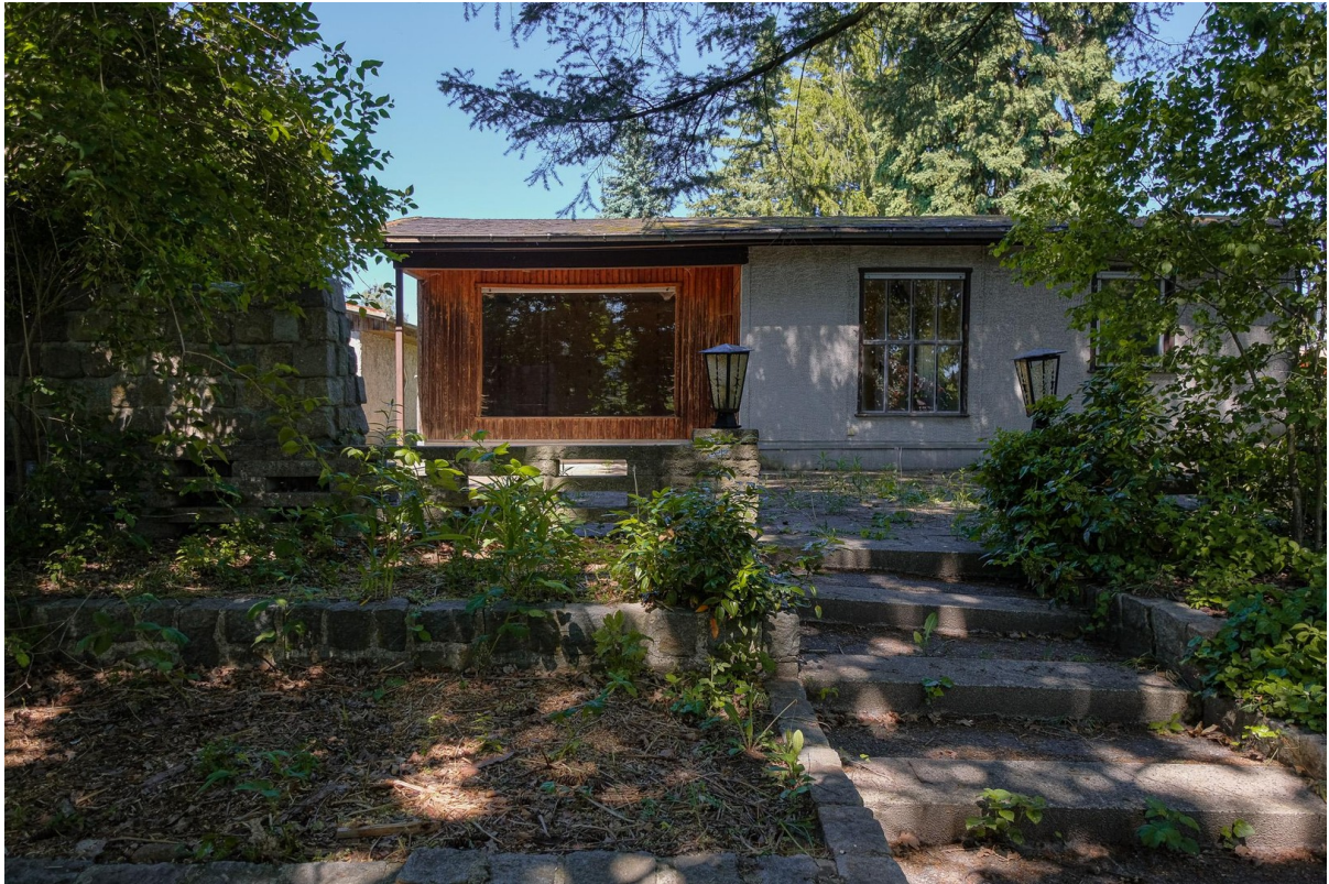
Bungalow + Seeterrasse