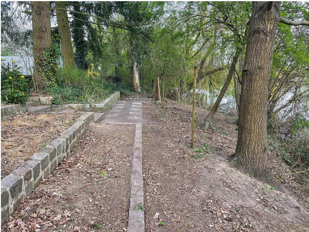
Ufer + Terrasse am See