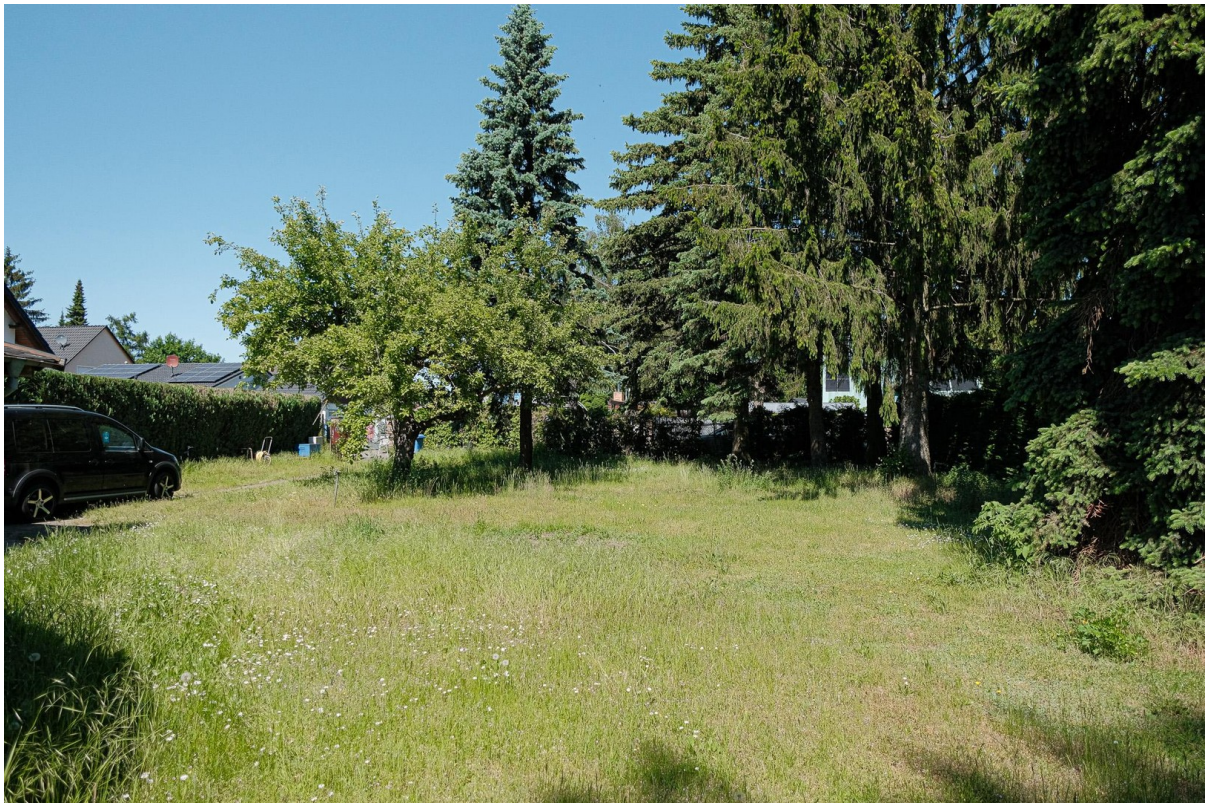
Blick zur Straße + Garten