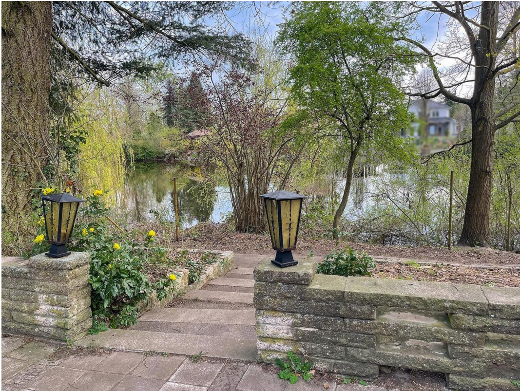
Terrasse + Sezugang