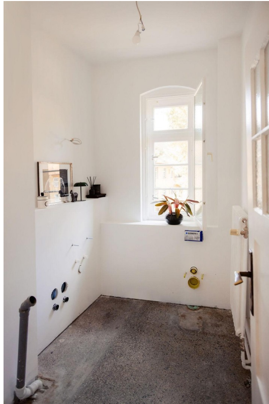
Bad zum selber gestalten