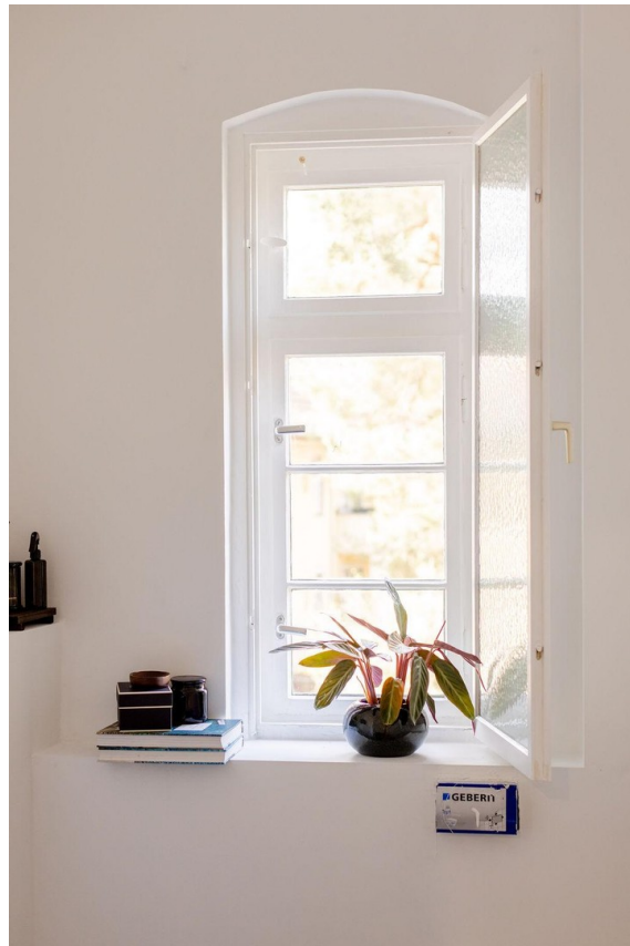
Bad mit Fenster