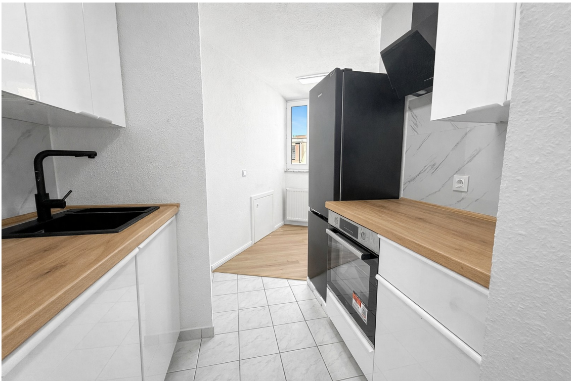
Neue moderne Küche