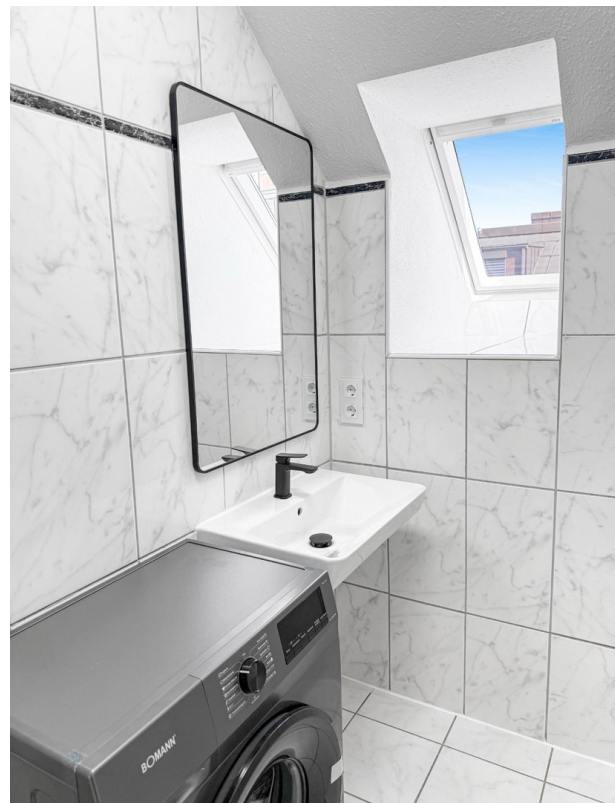
Bad 1 mit Waschmaschine