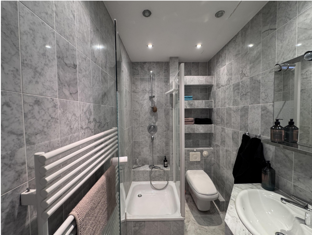
Marble Bath und Shower