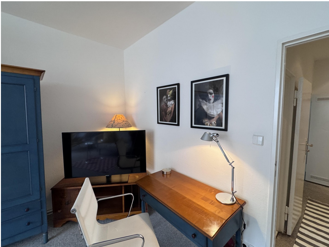
Desk and TV