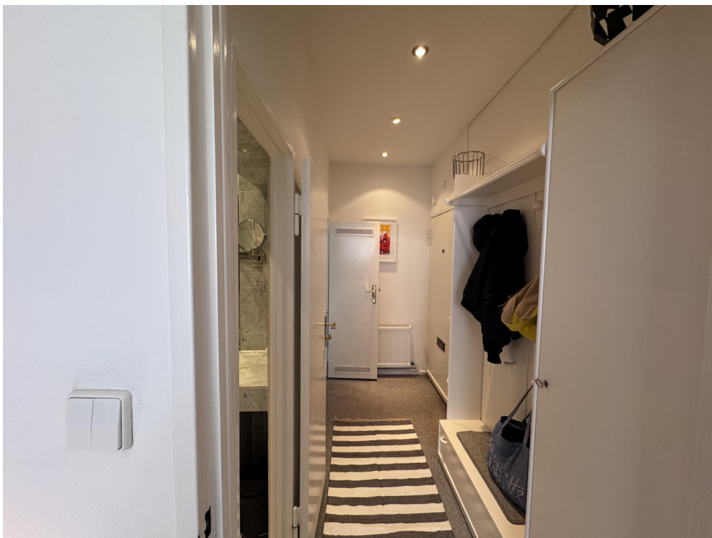
Corridor & wardrobes