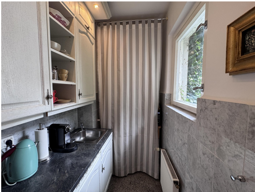
Kitchen Nespresso and Washing