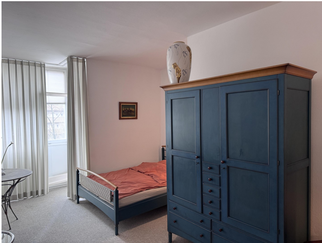
Sleeping and Storage