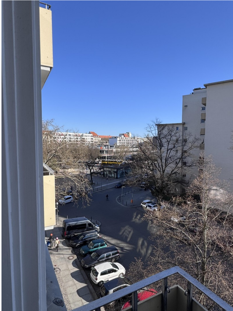
View from Balcony to Ku'Damm