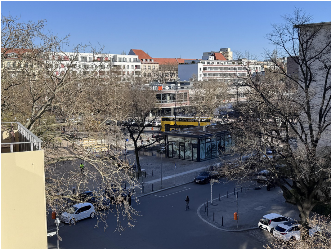
View Balcony > Schaubühne