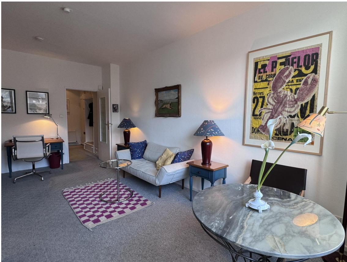
Livingroom and Sofa