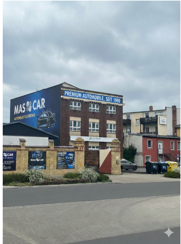
Mögliche Werbung, in Prüfung