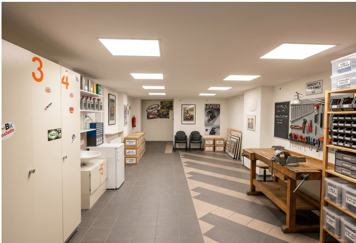
Garage unter der Einheit