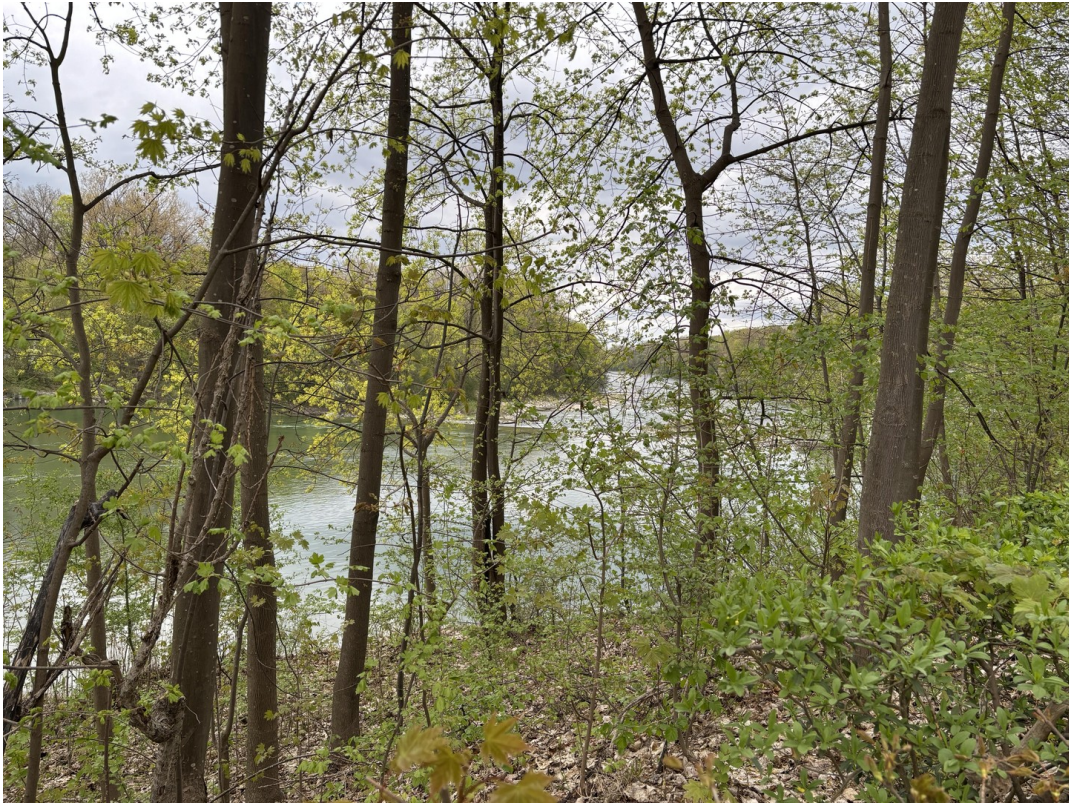
30 m zum Lech....