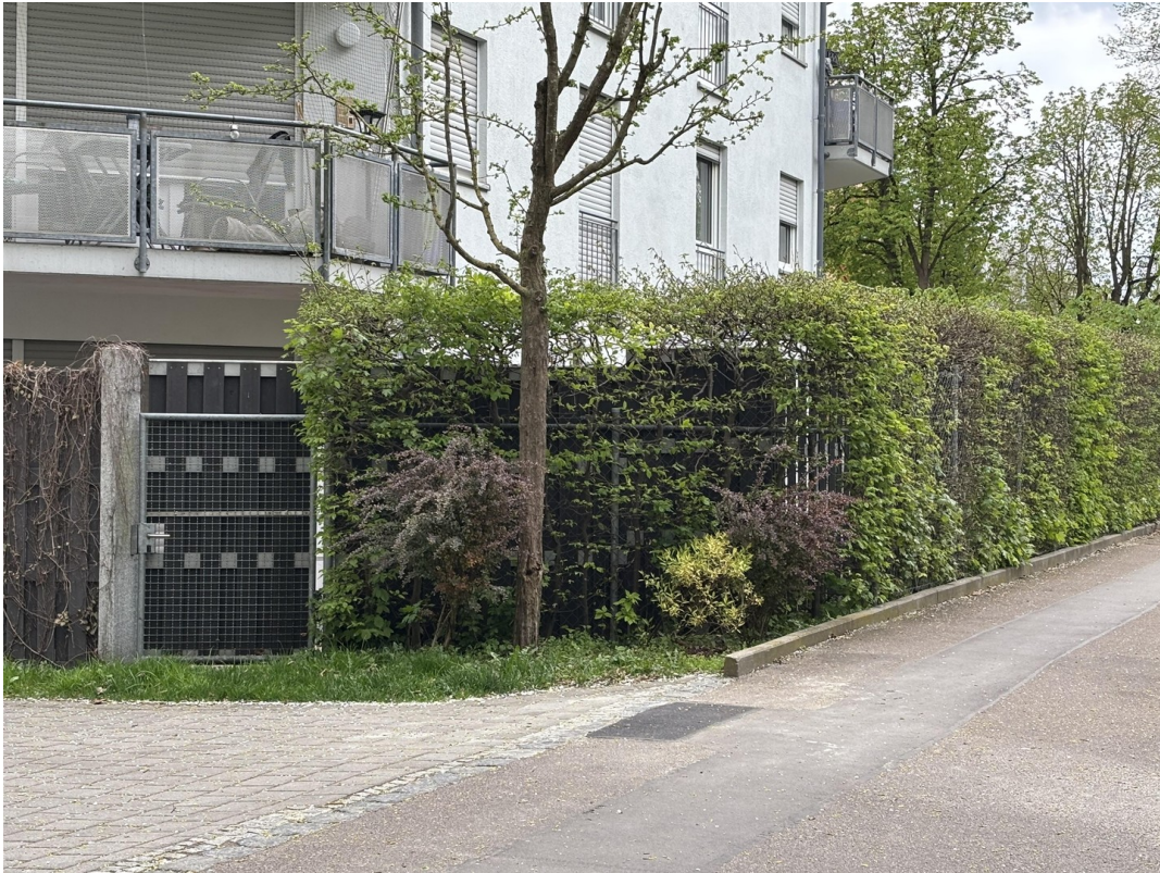
Außenansicht mit Gartentor