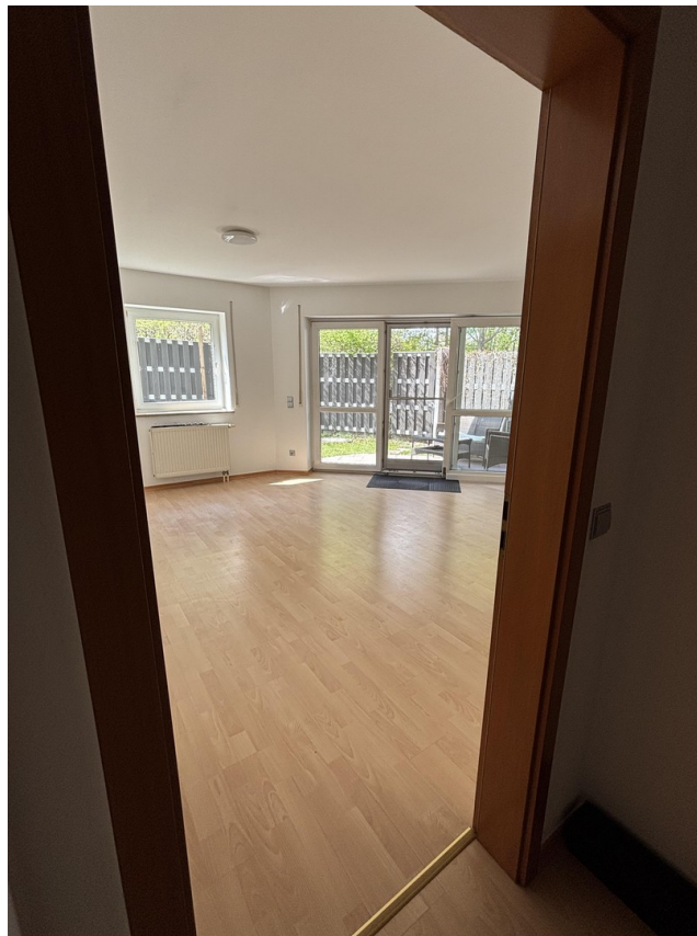
Blick Flur in Wohnbereich