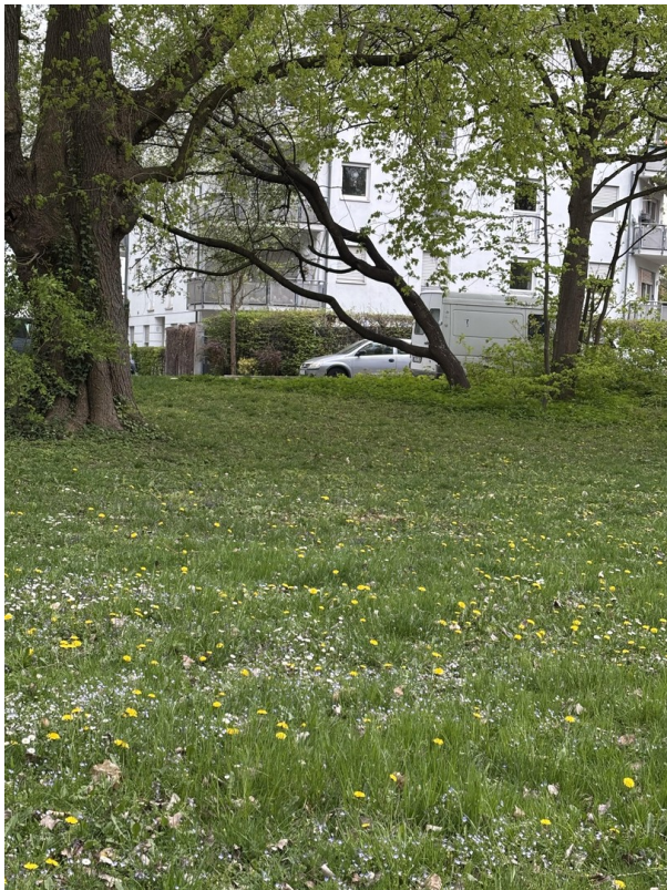
Blick vom Lech zur Wohnung