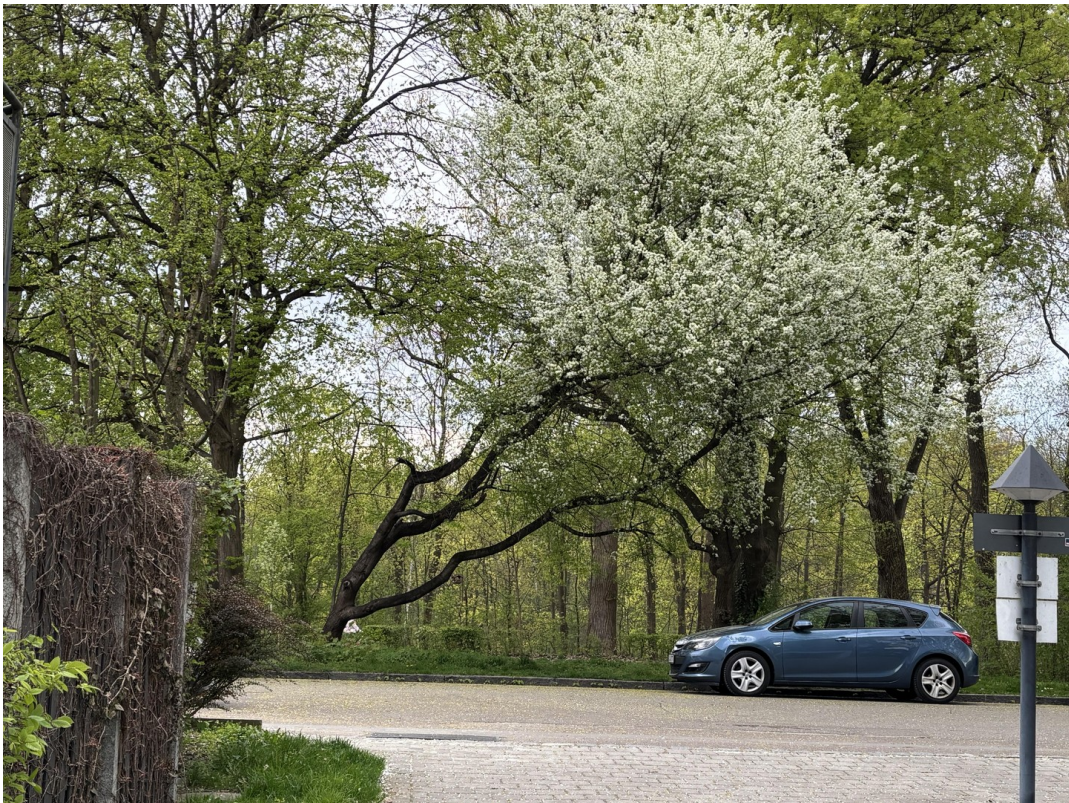
Blick zum Lech