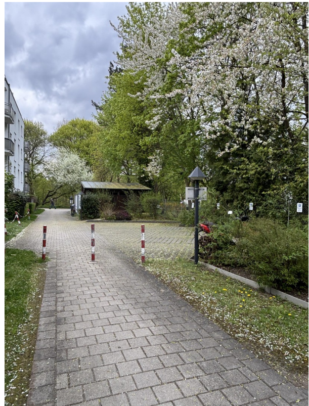
Innenhof mit Fahrradhäuschen