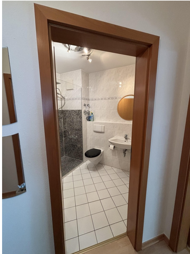
Blick vom Flur ins Bad