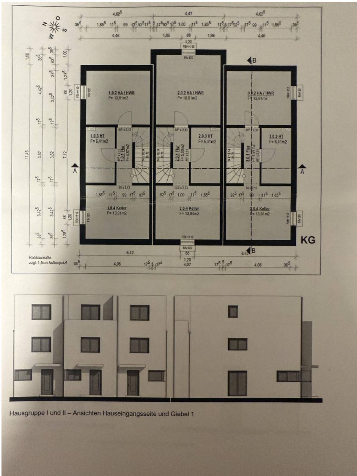
Hausgruppe I und II – Ansichten Hauseingangsseite und Giebel 1