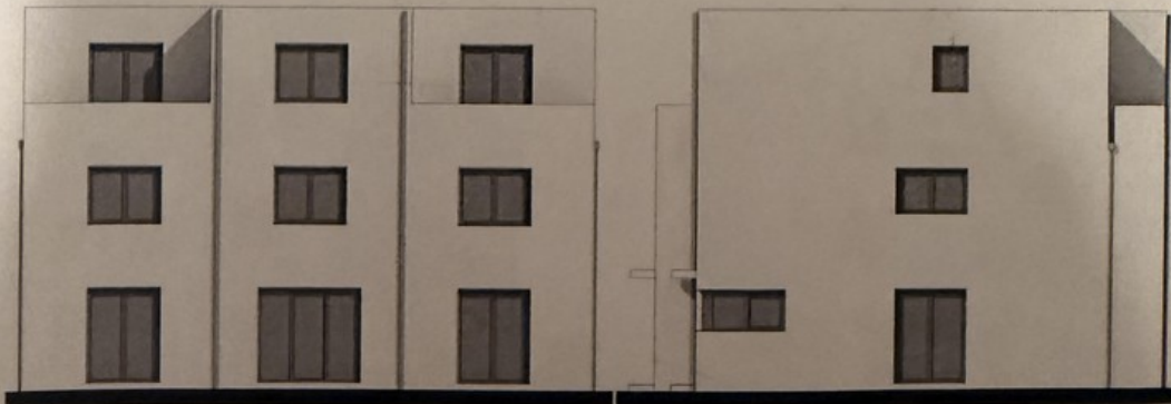
Hausgruppe I und II – Ansichten Gartenseite und Giebel 2