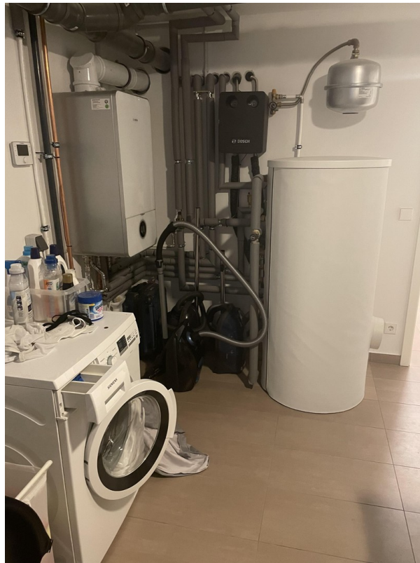
Heizungs- und Waschkeller