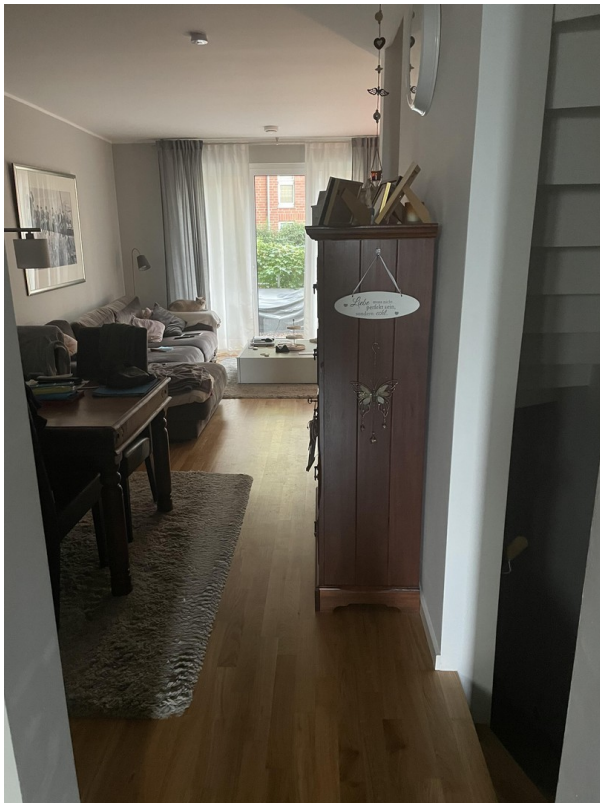
Blick Ess- und Wohnbereich