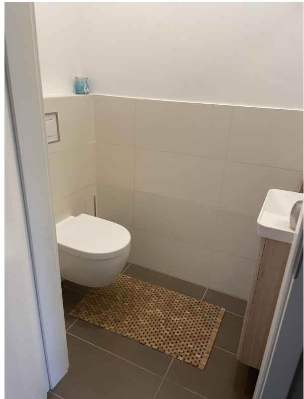
Gäste WC im EG