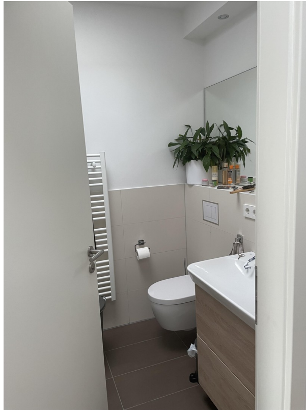
WC Duschbad 2.OG