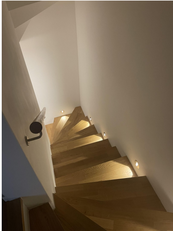
Treppenaufgang mit Beleuchtung