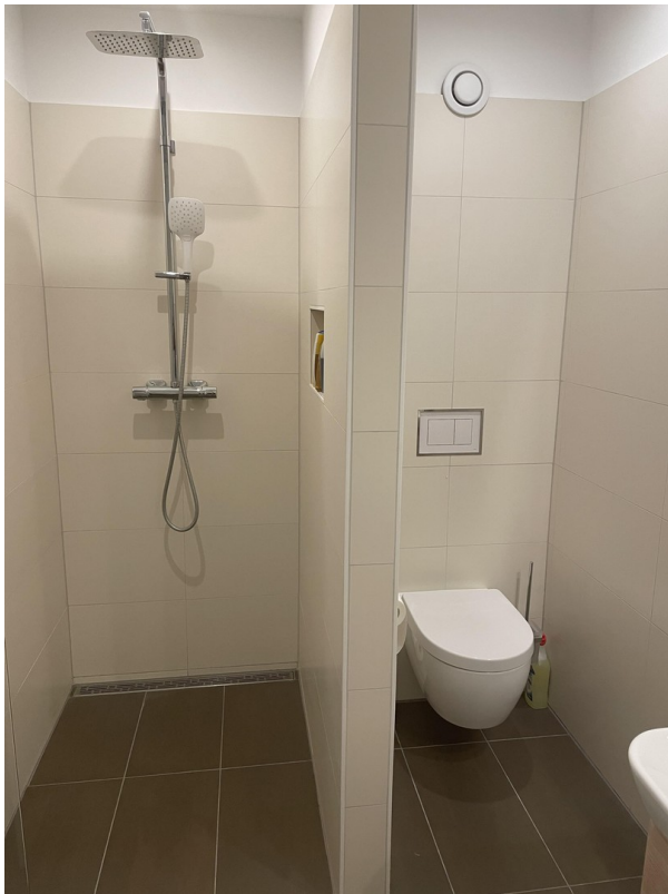
WC + 2. Dusche im Wannenbad