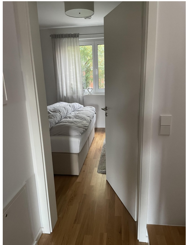
Blick Schlafzimmer 1.OG