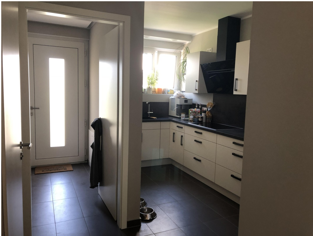
Offener Küchenbereich mit Flur