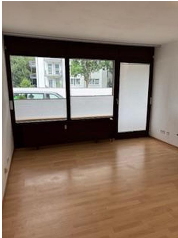
Büroraum Blick zum Balkon