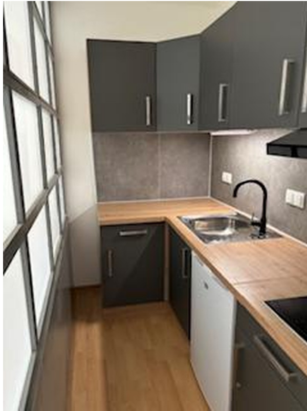
voll ausgestattete Küche