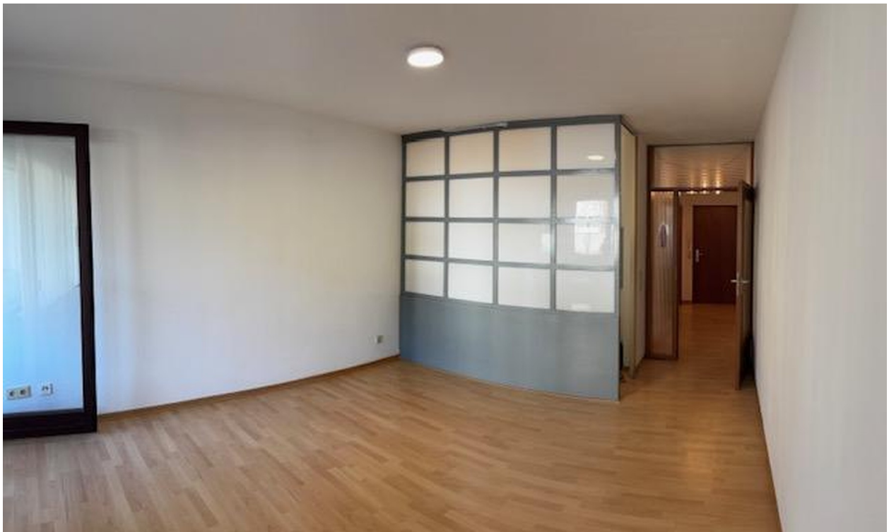
Büroraum Blick zum Eingang