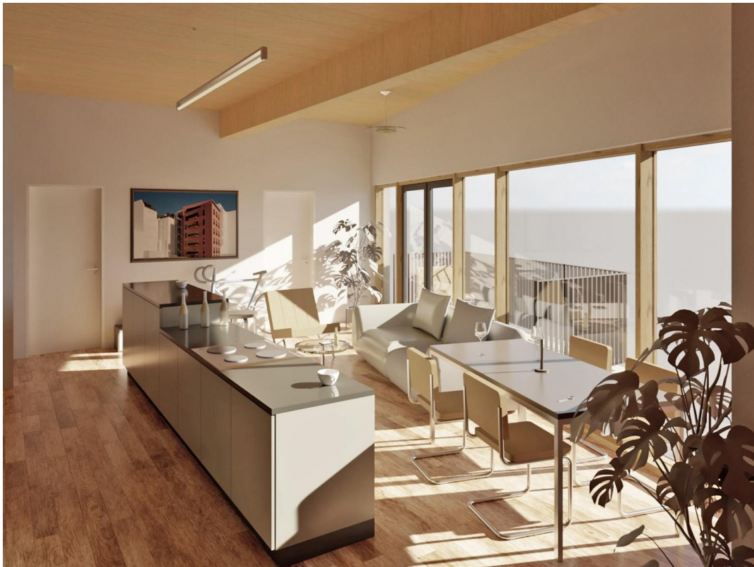
Große Wohnküche nach außen