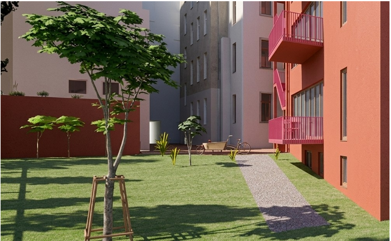
Hochparterre und Keller