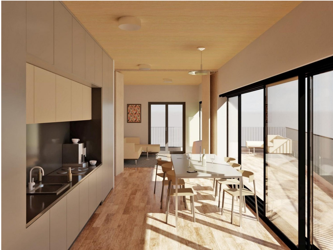
Gemeinschaftsbereich im DG