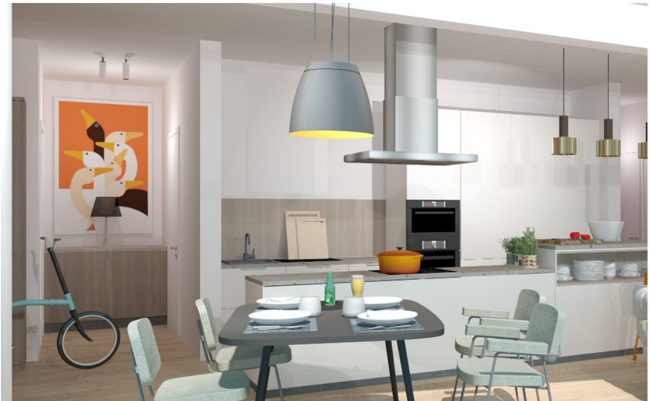
Große Wohnküche nach innen