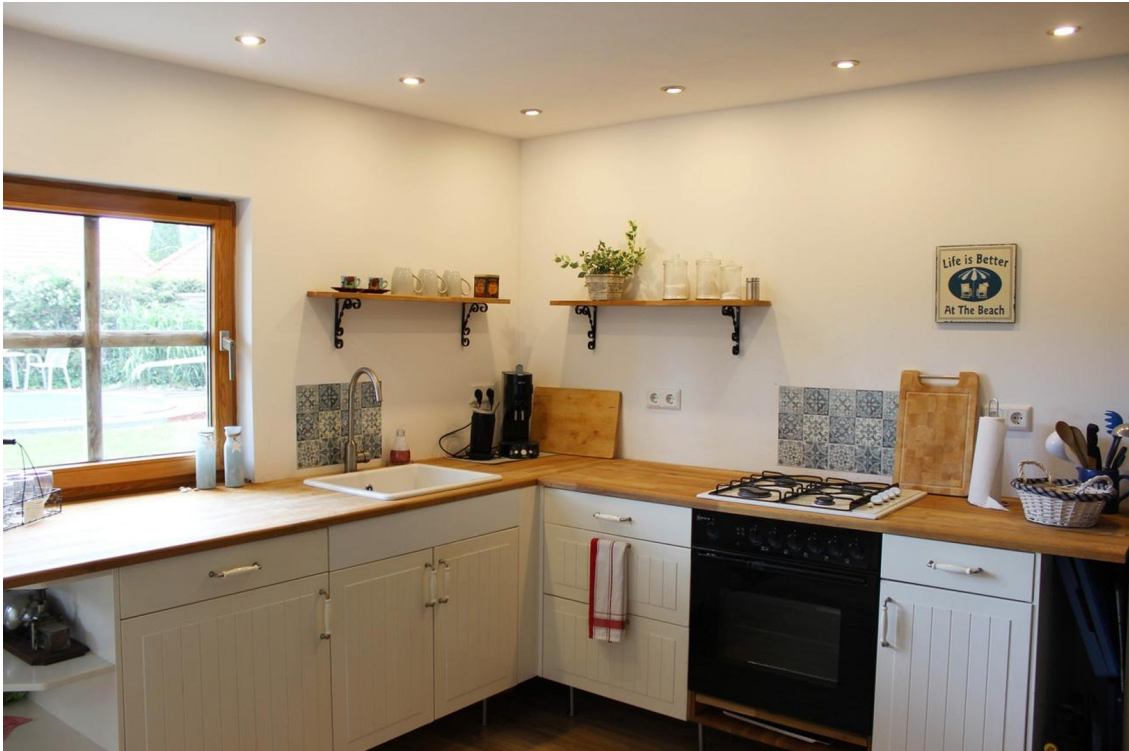
Küche Erdgeschoss rechts