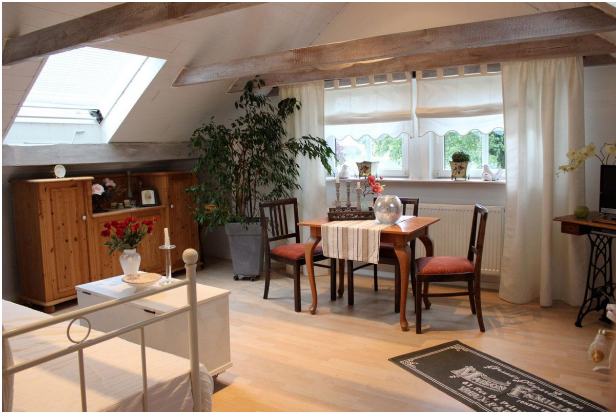
Wohnzimmer Obergeschoss links