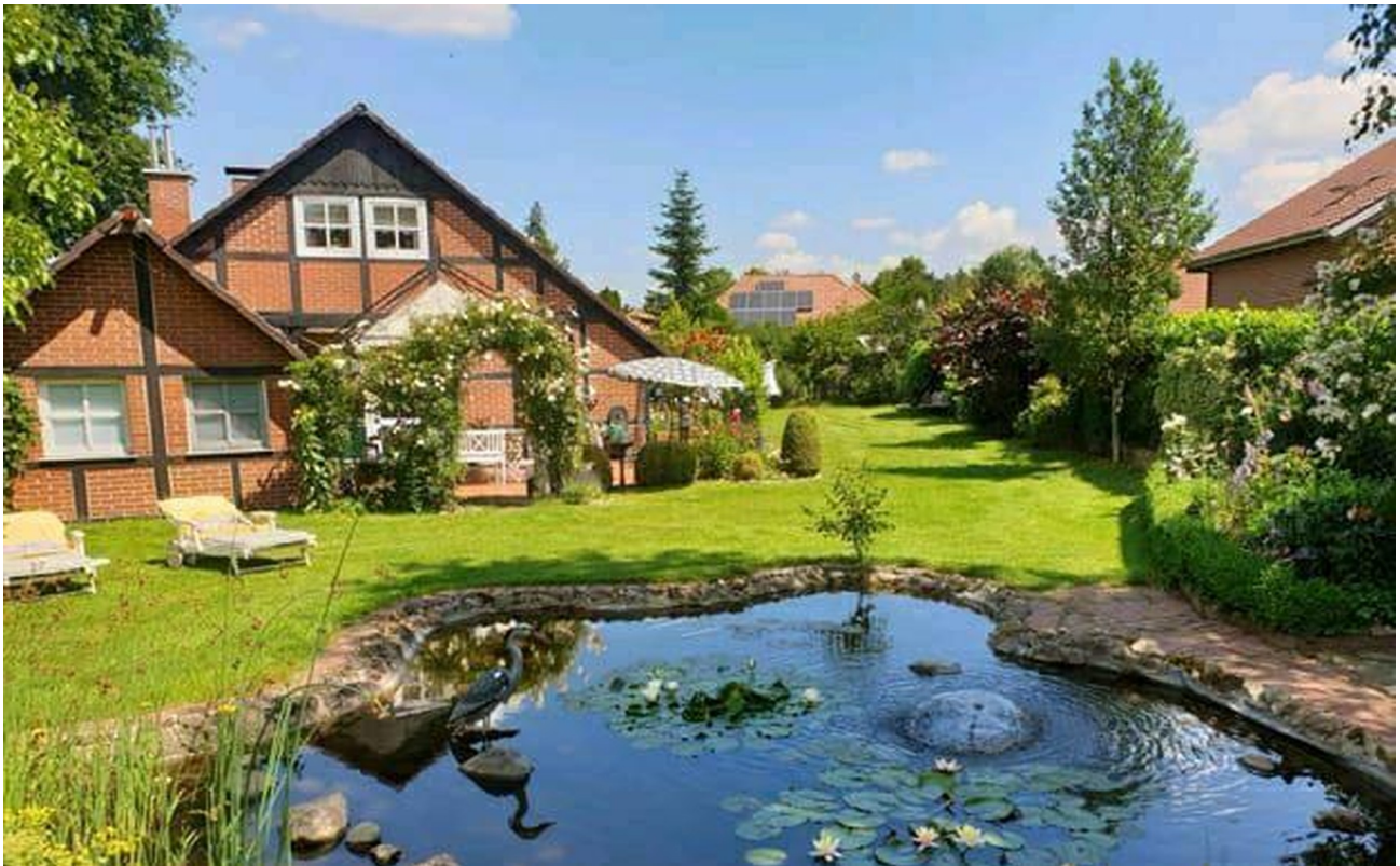
Haus von Straßenseite