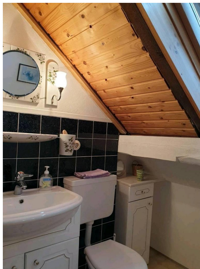
Toilette Obergeschoss links