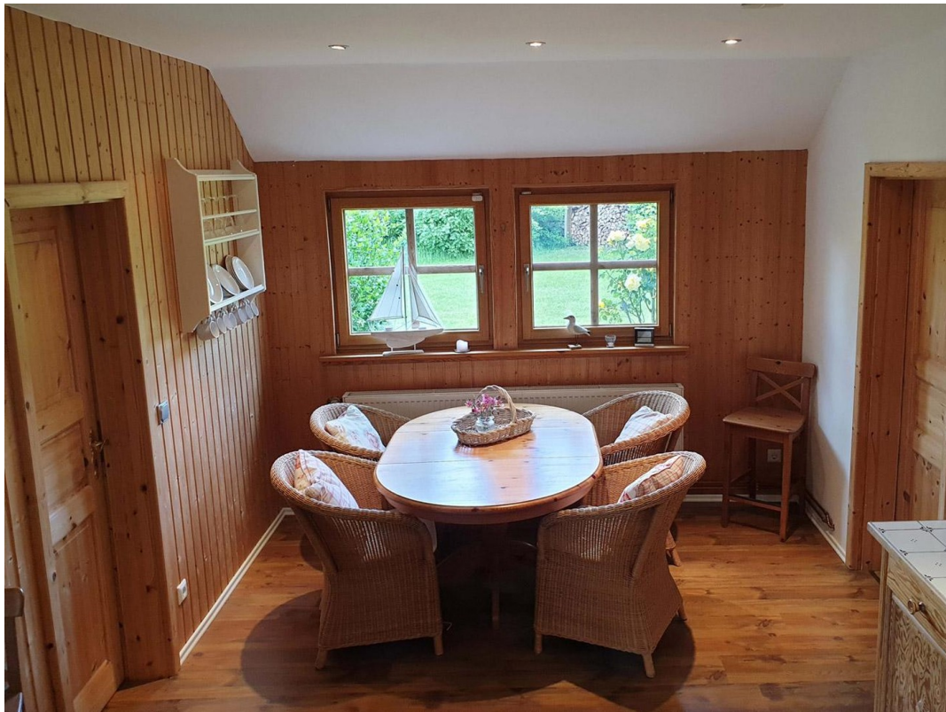
Esszimmer Erdgeschoss rechts