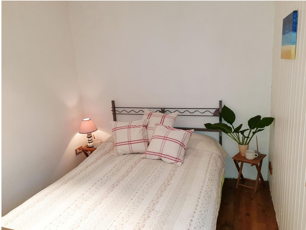
Schlagzimmer Erdgeschoss recht