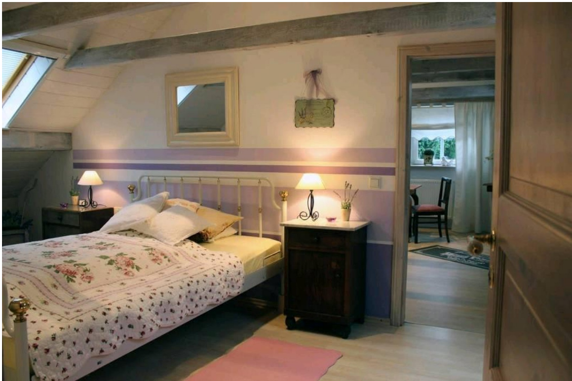
Schlazimmer Obergeschoss links