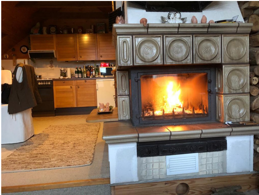
Wohn/küche Obergeschoss rechts