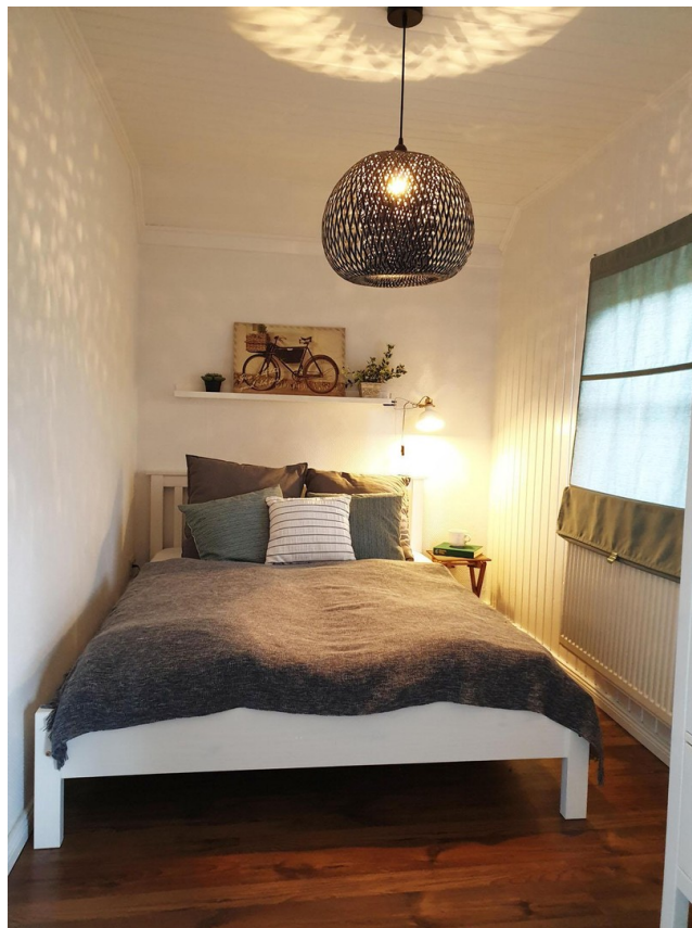
Schlafzimmer Erdgeschoss recht