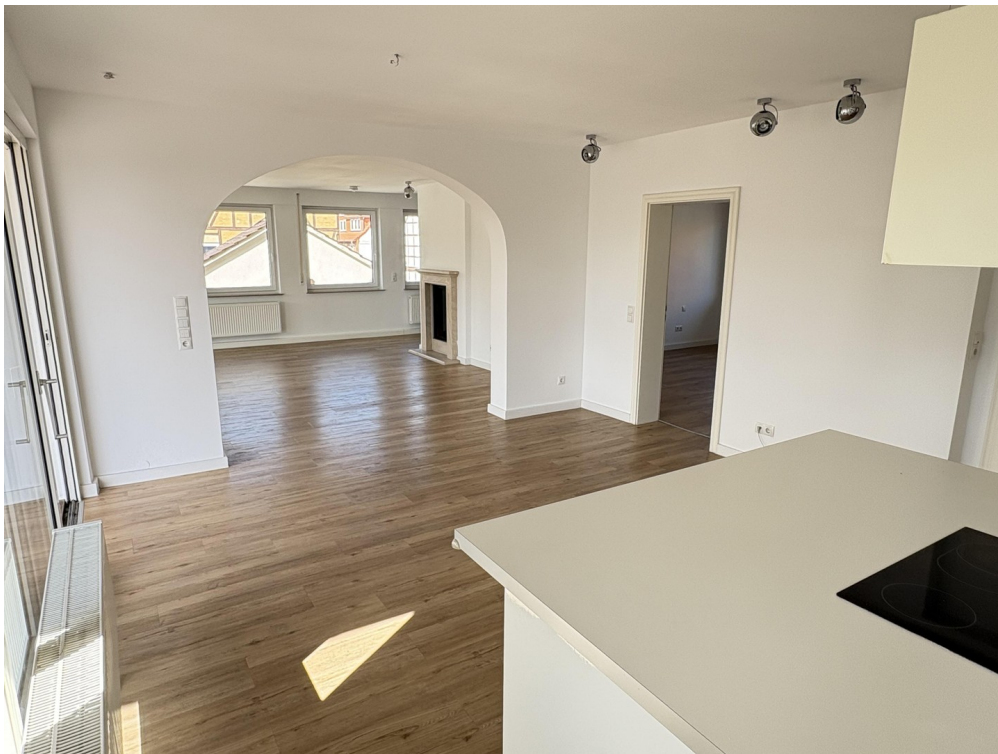
Wohn- / Essbereich