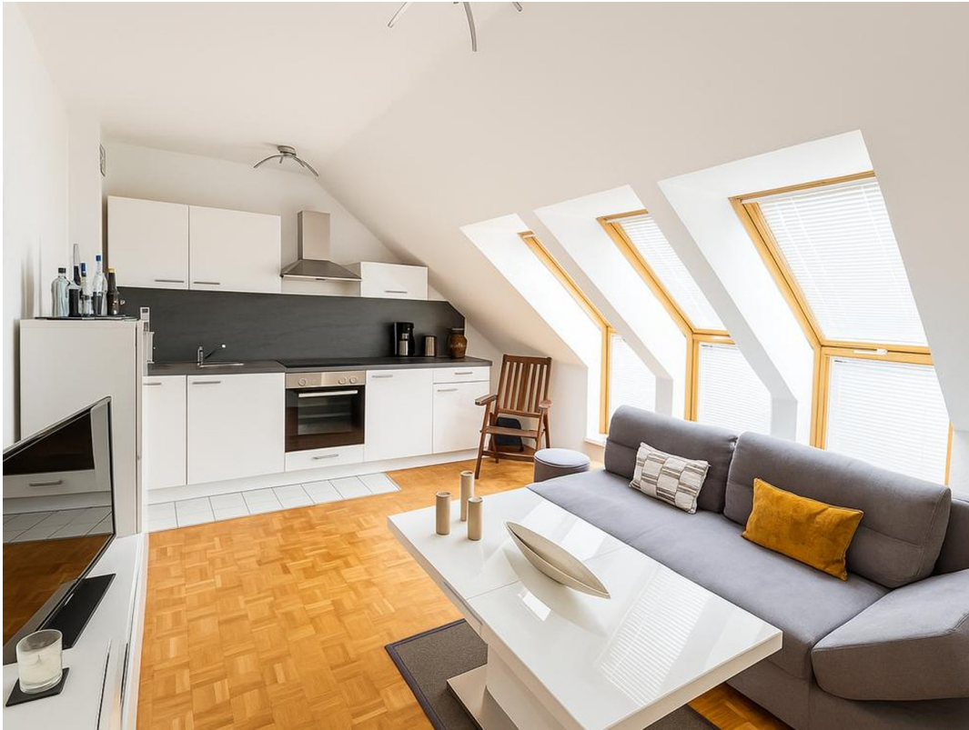
Küche + Wohnbereich