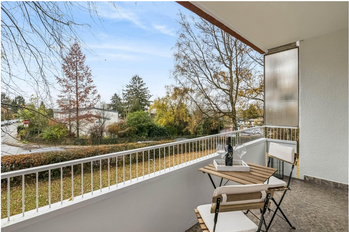
Loggia zum Entspannen