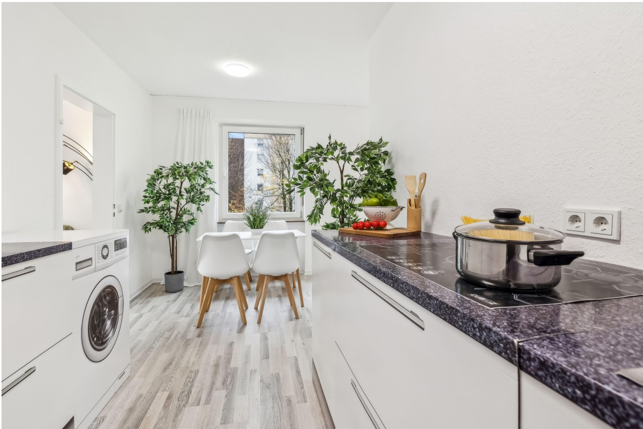
Küche + Essbereich