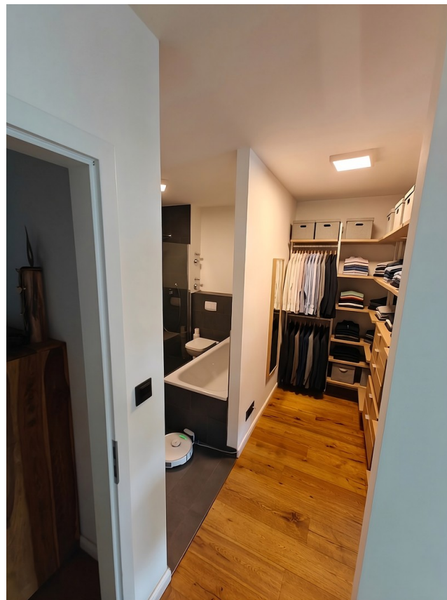
Ankleide & En-Suite Bad