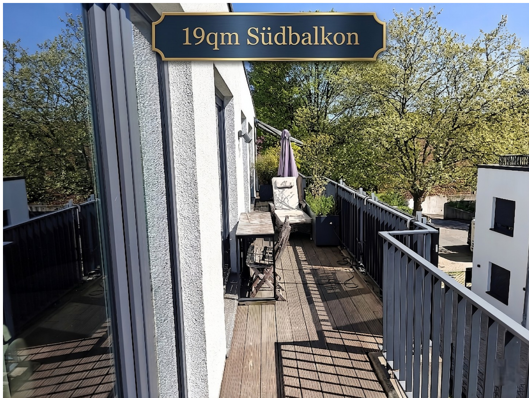
Südbalkon 19 qm