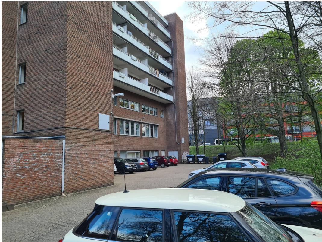
Stellplatz hinter dem Gebäude