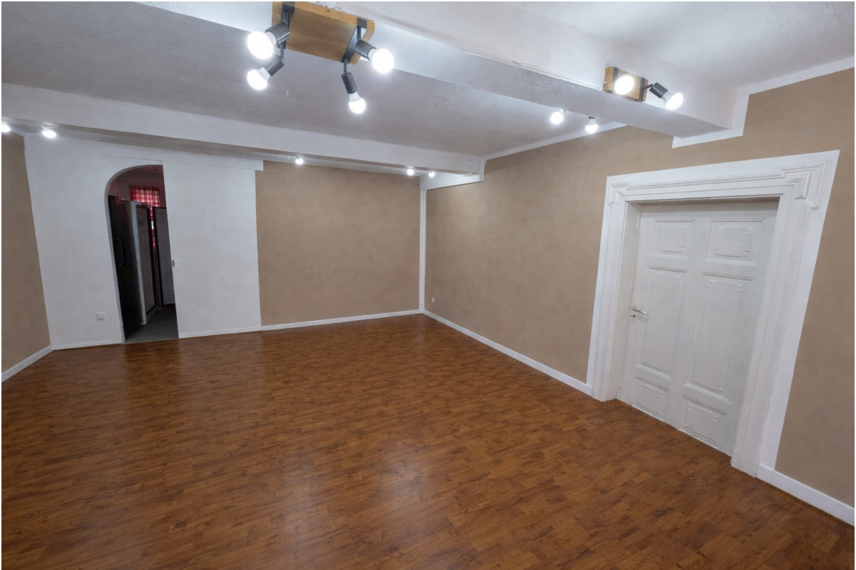
Laden - Blick vom Eingang