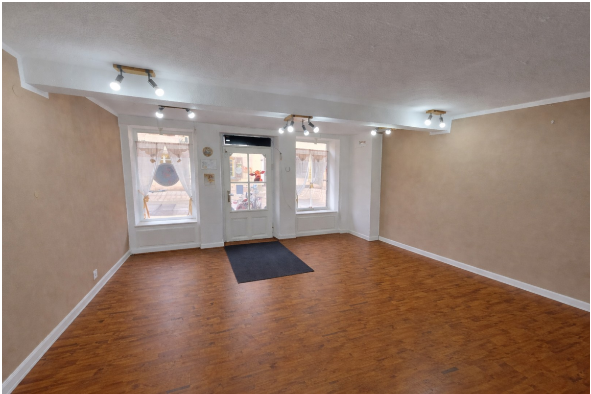
Laden - Blick zum Eingang