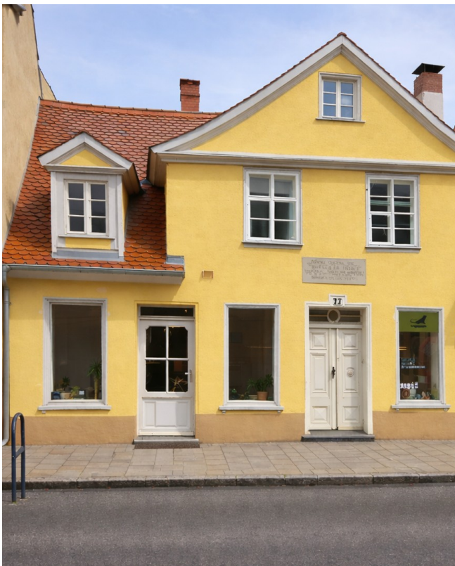
Wohn- und Geschäftshaus