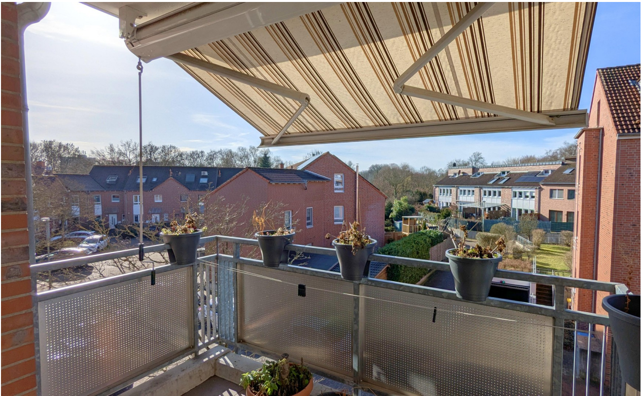
Balkonblick / view balcony