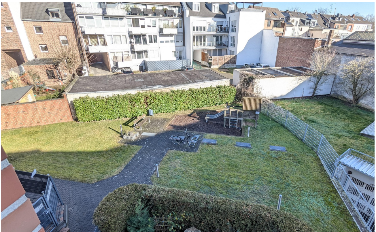
Garten / Hof