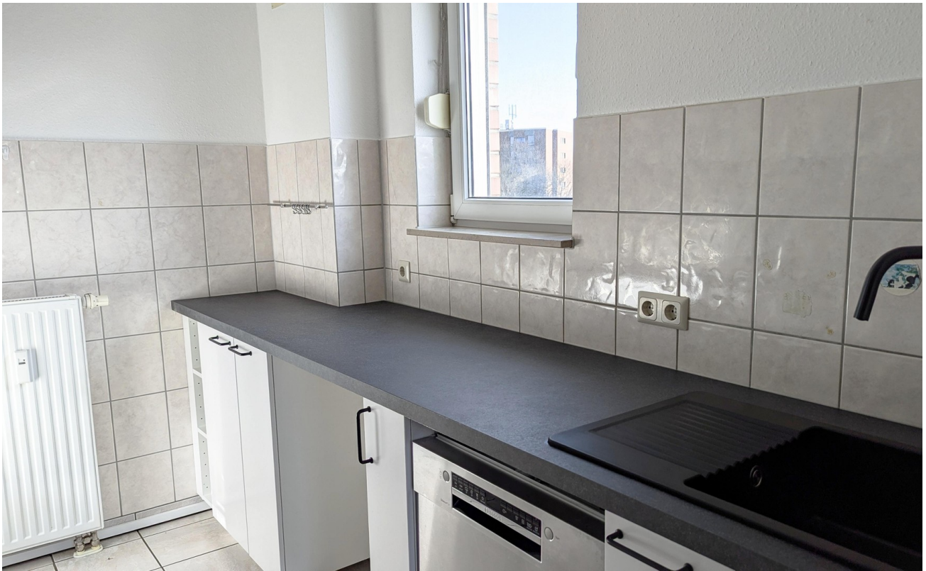
Küche / Kitchen