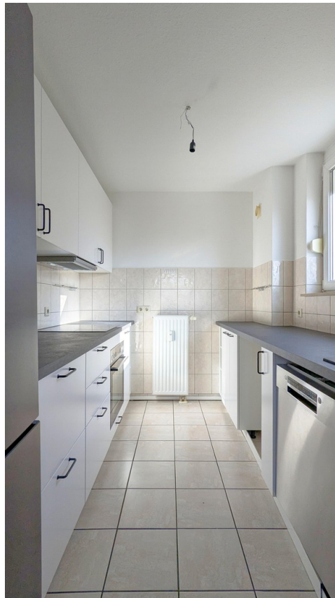
Küche / Kitchen