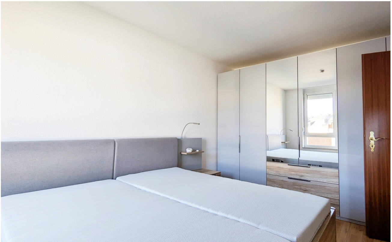
Schlafzimmer / bed room