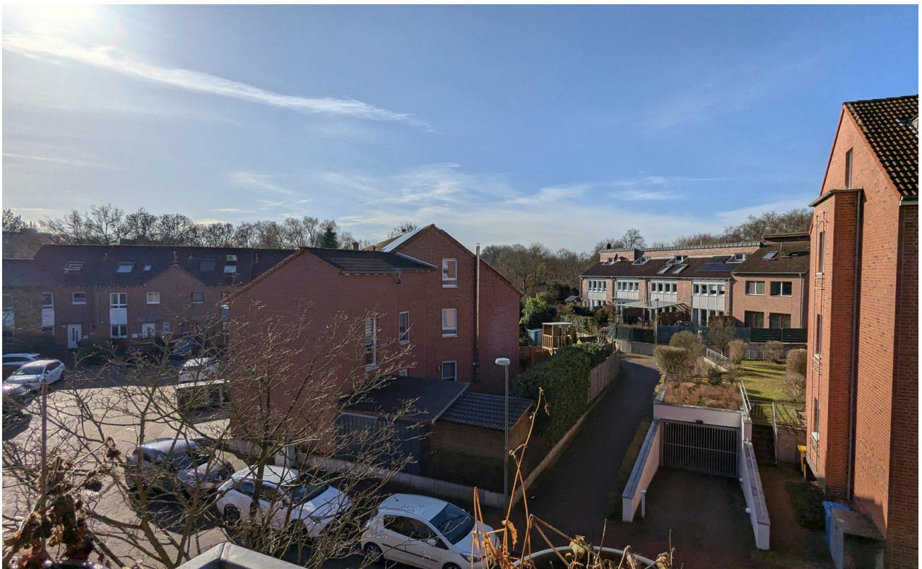
Balkonblick / view balcony