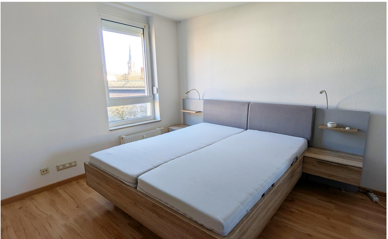
Schlafzimmer / bed room