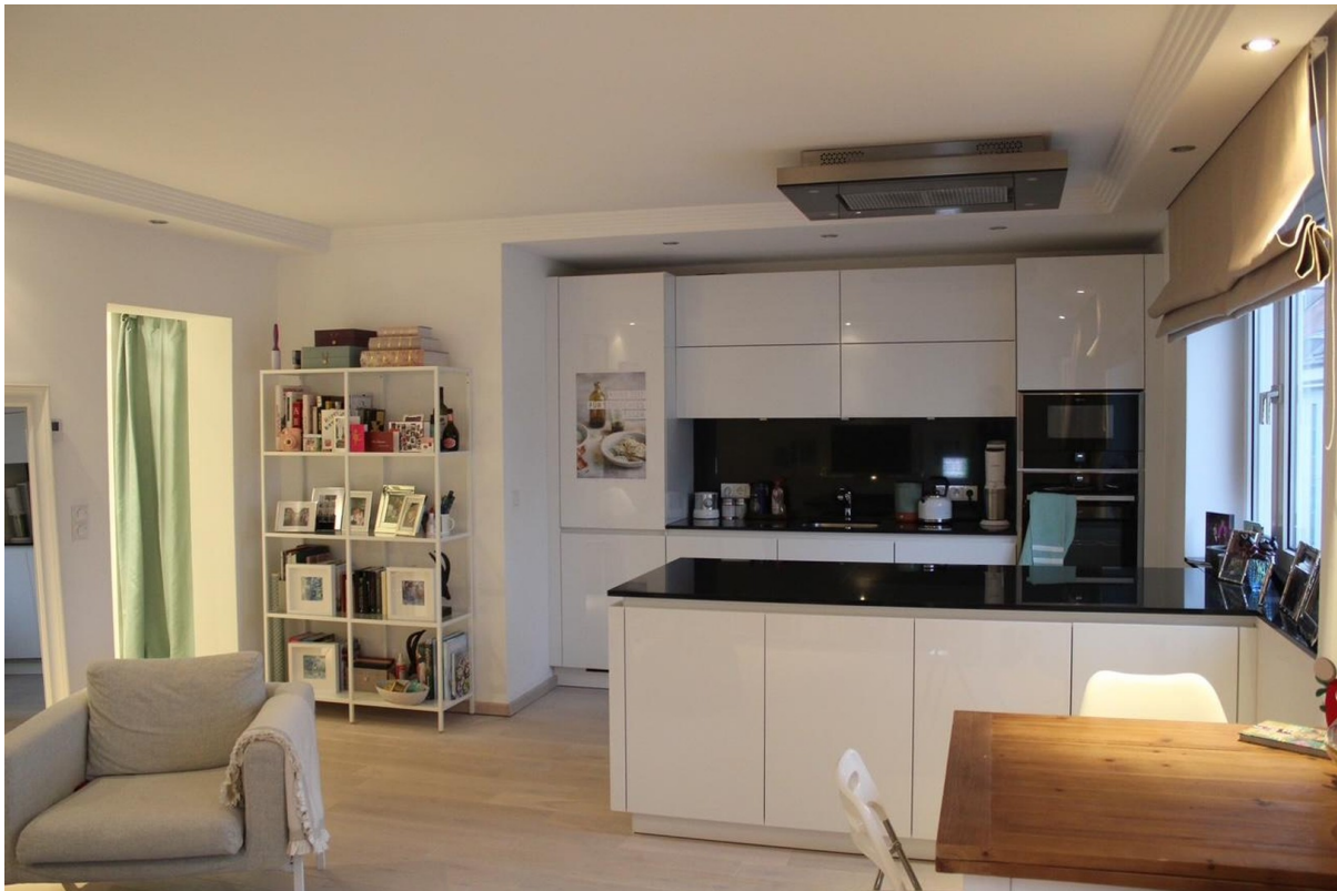
Einbauküche 4. OG