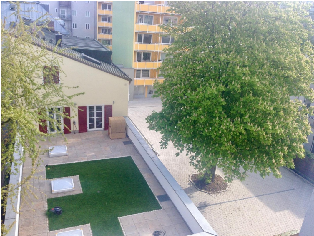
Blick in den Innenhof