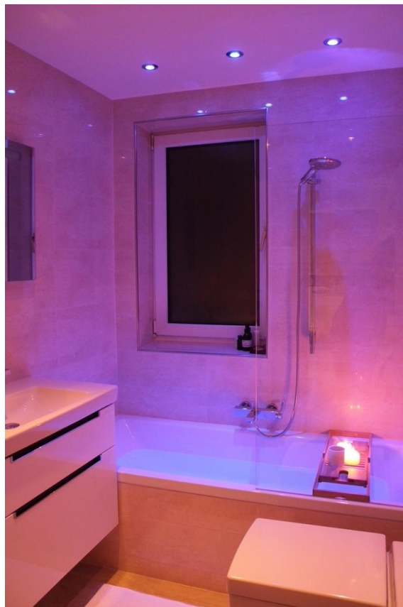
Badezimmer 4. OG