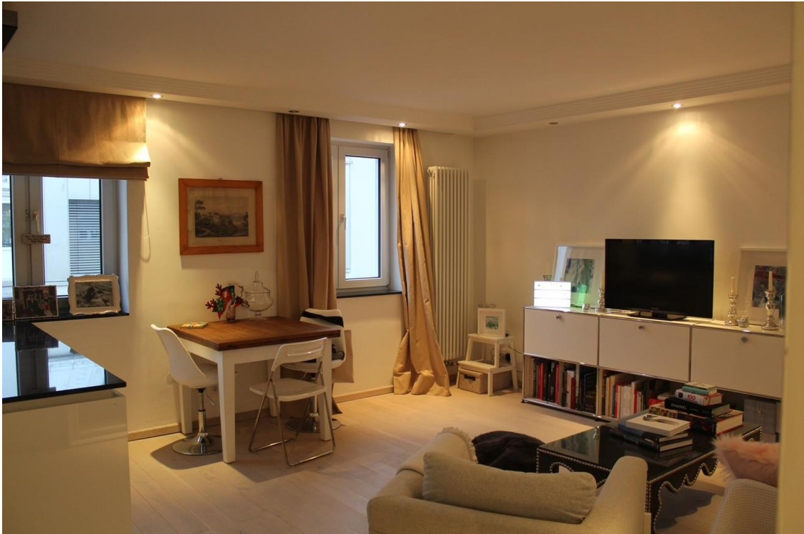
Wohnzimmer 4. OG