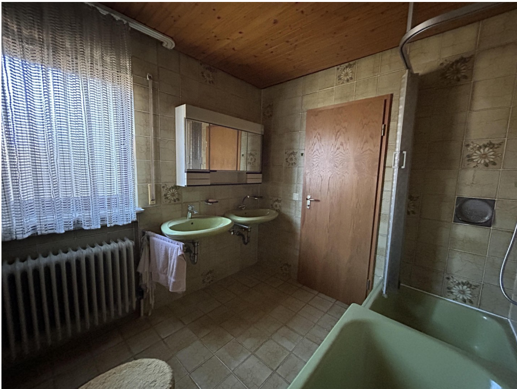
EG - Bad