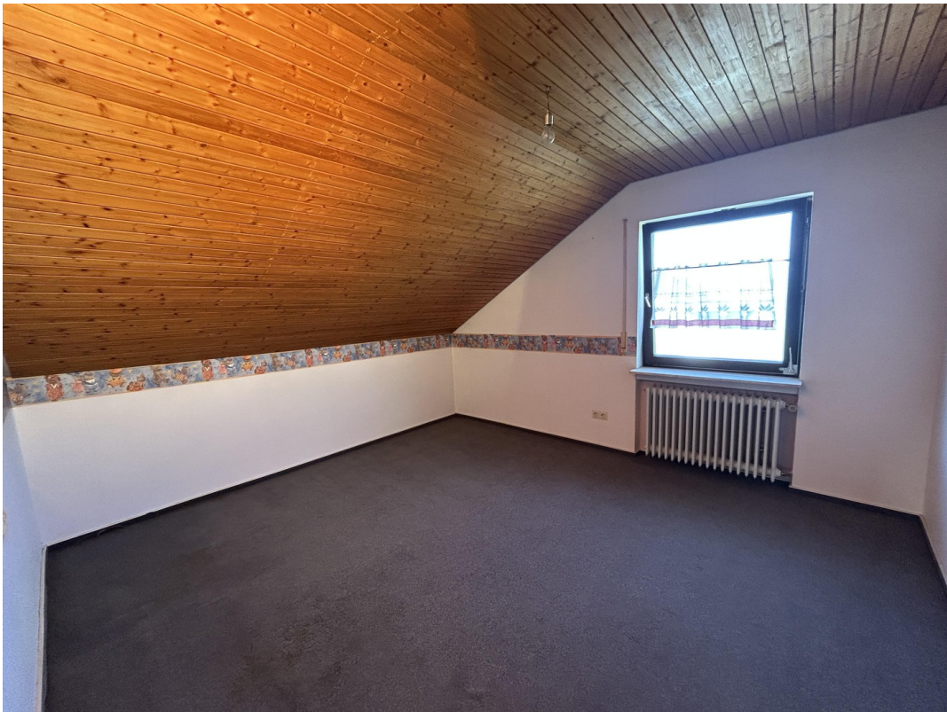
DG - Kinderzimmer