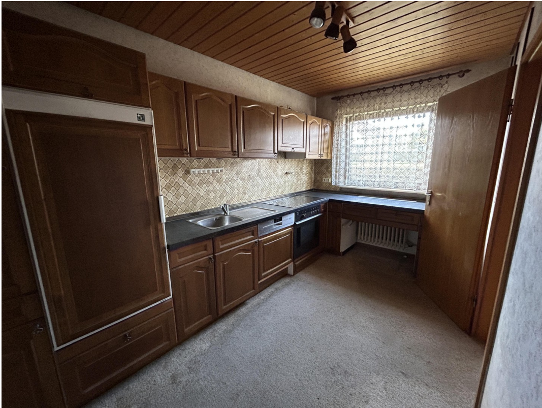
EG - Küche