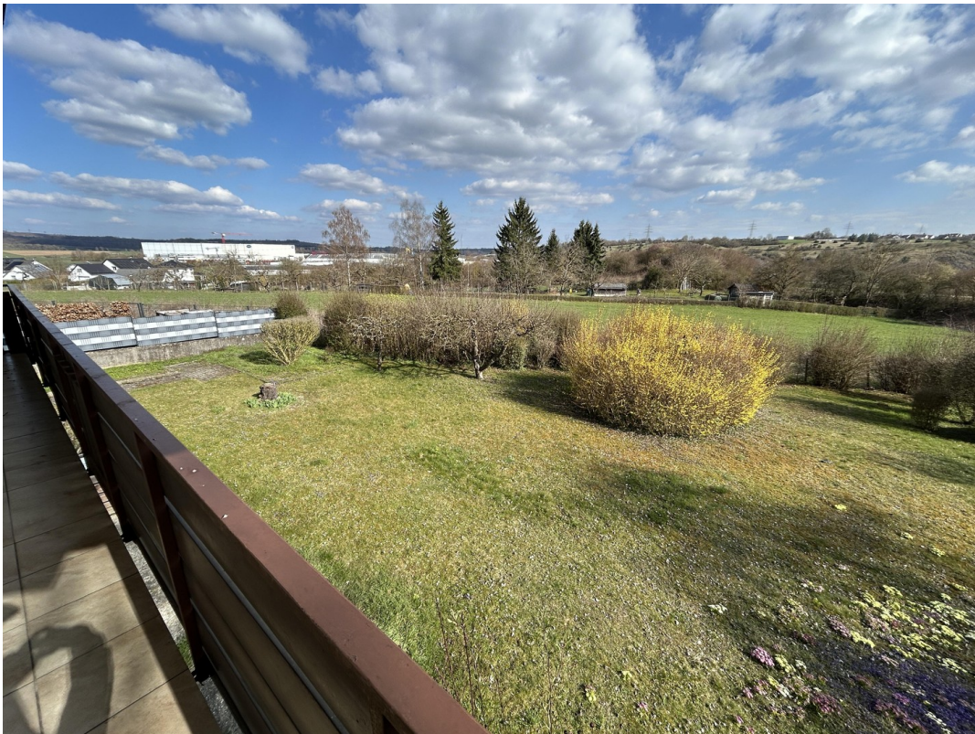
Garten - Vom Südbalkon