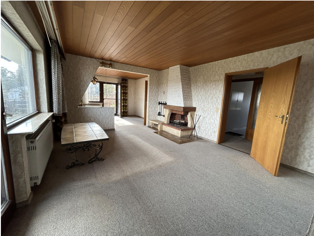
EG - Wohnzimmer