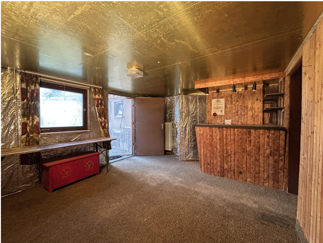
UG - Partykeller