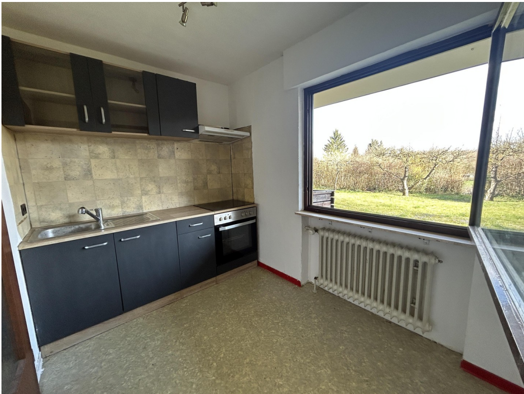
UG - Küche