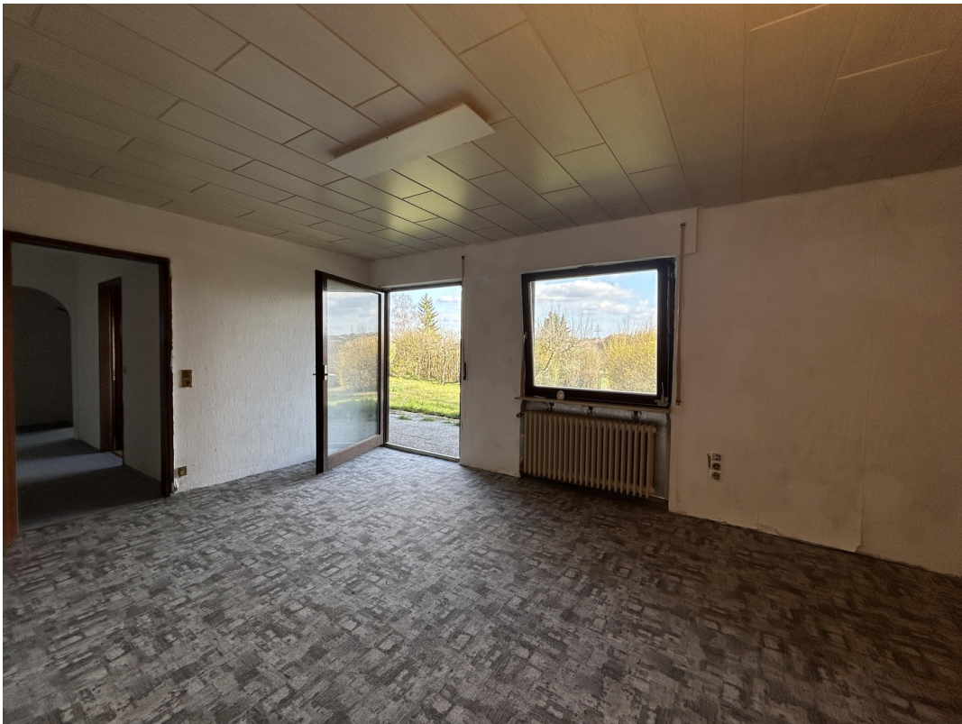
UG - Wohnzimmer