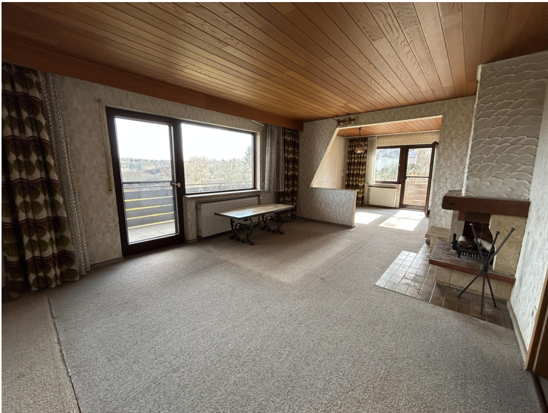
EG - Wohnzimmer