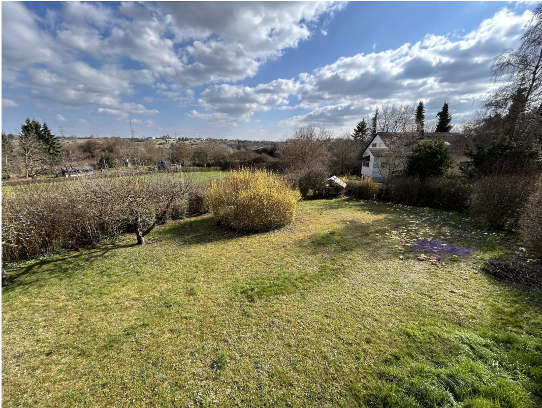
Garten - Vom Südbalkon