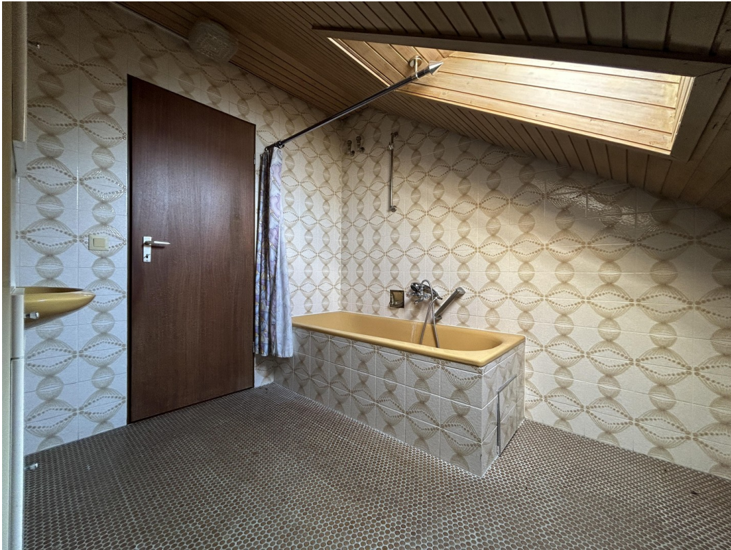
DG - Bad