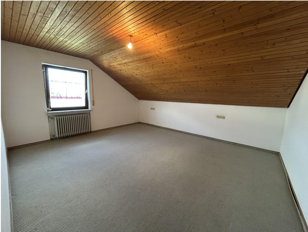
DG - Schlafzimmer