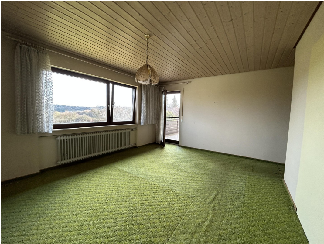
EG - Schlafzimmer