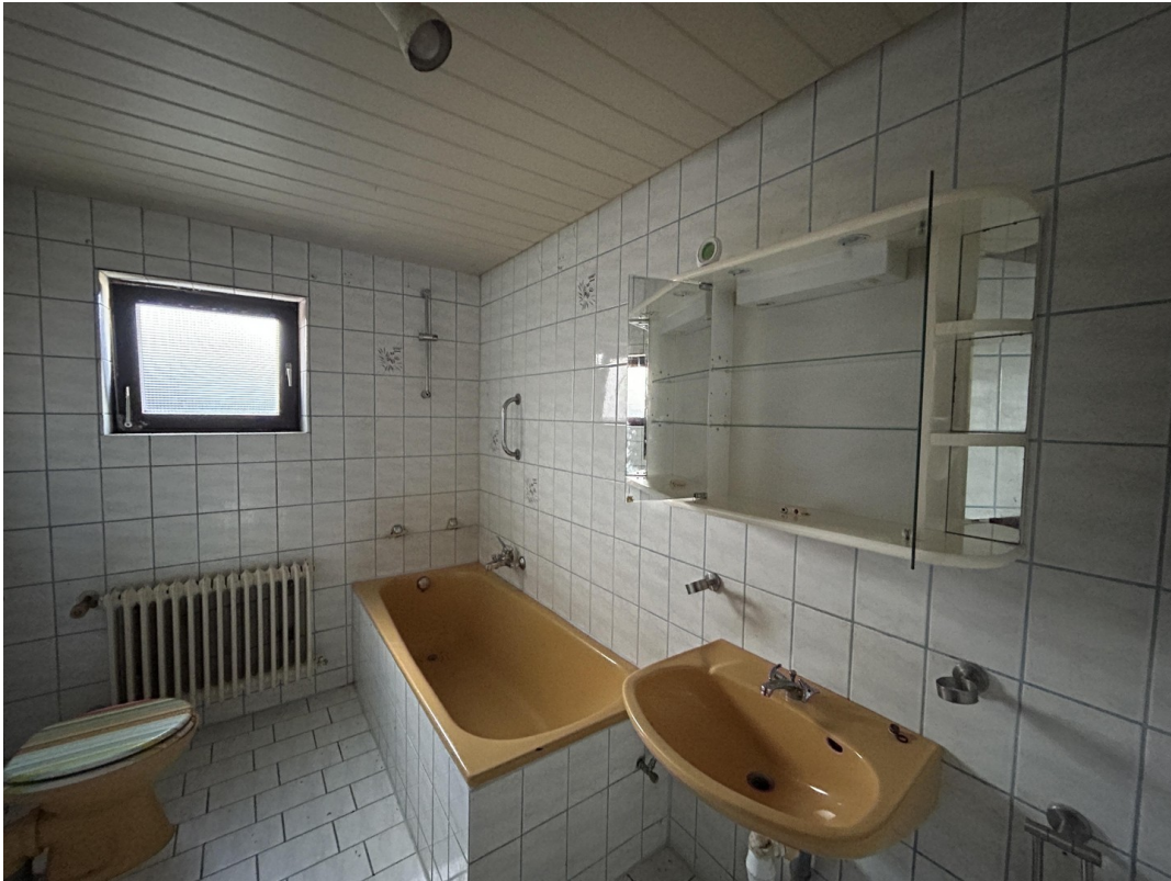
UG - Bad