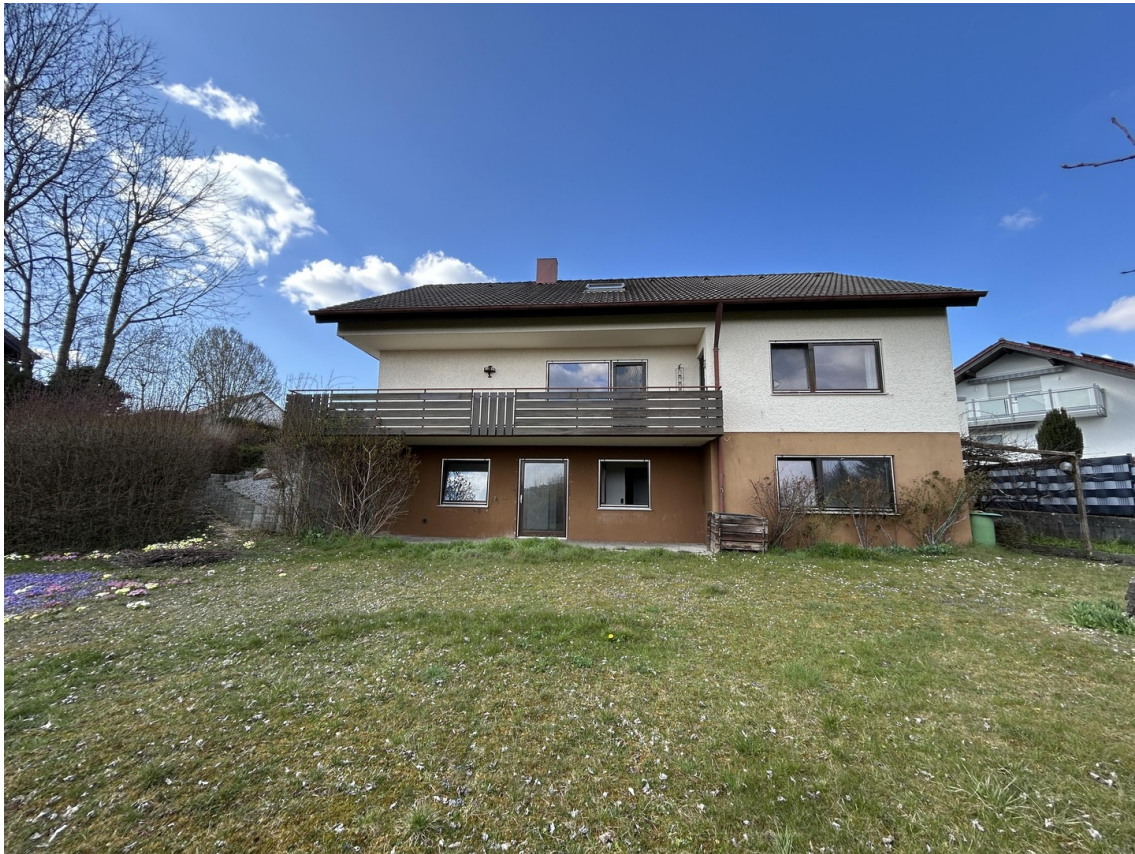
Garten - Hausansicht