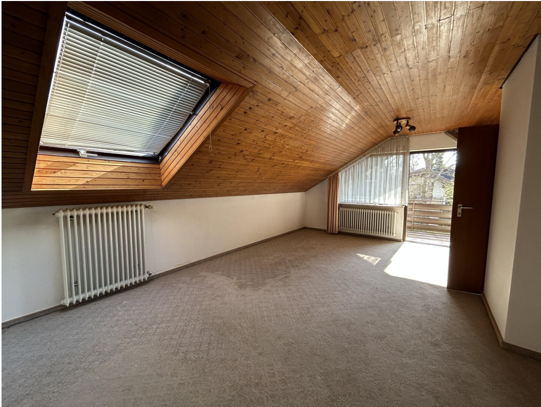
DG - Wohn-/Esszimmer