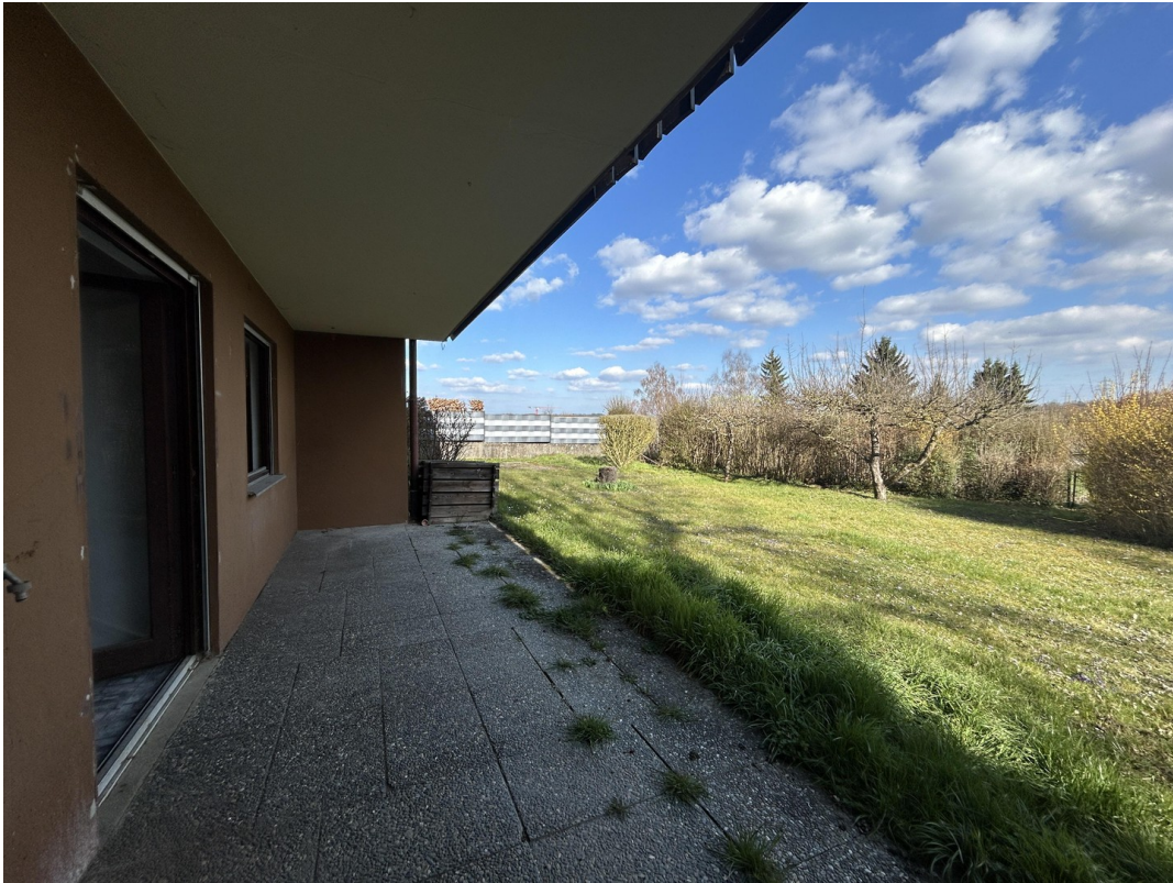
UG - Terrasse