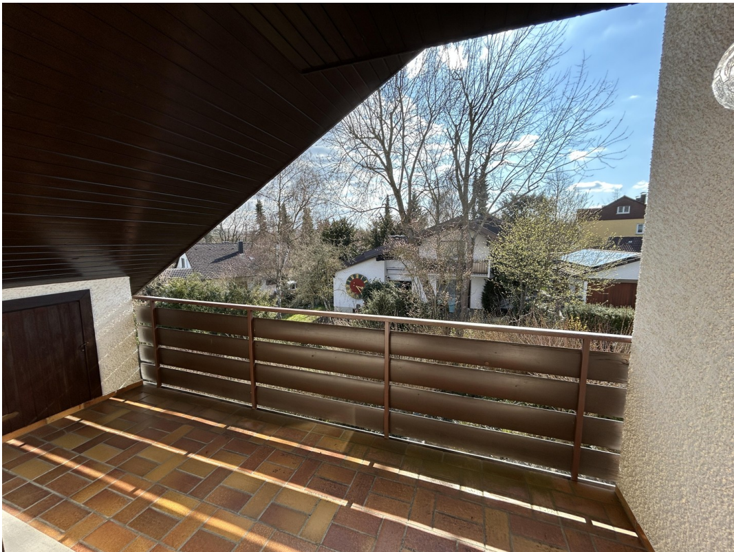
DG - Loggia