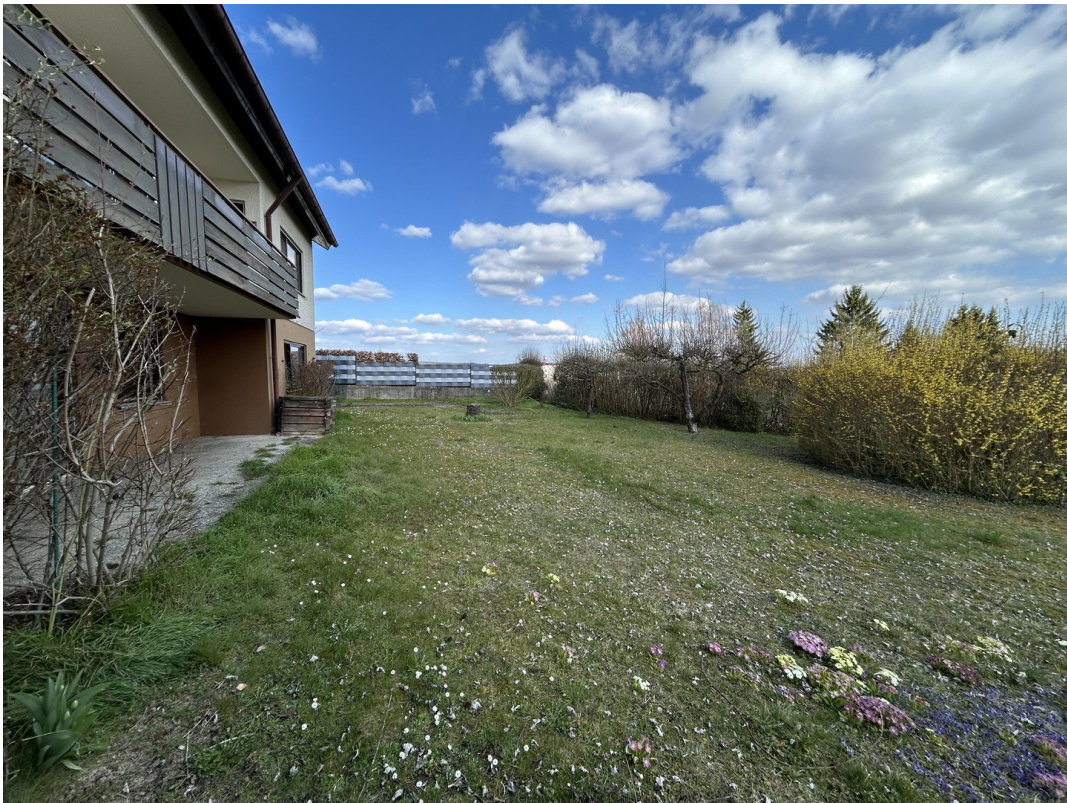
Garten - Von unten