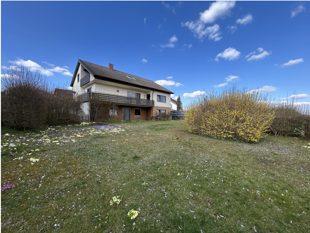
Garten - Hausansicht