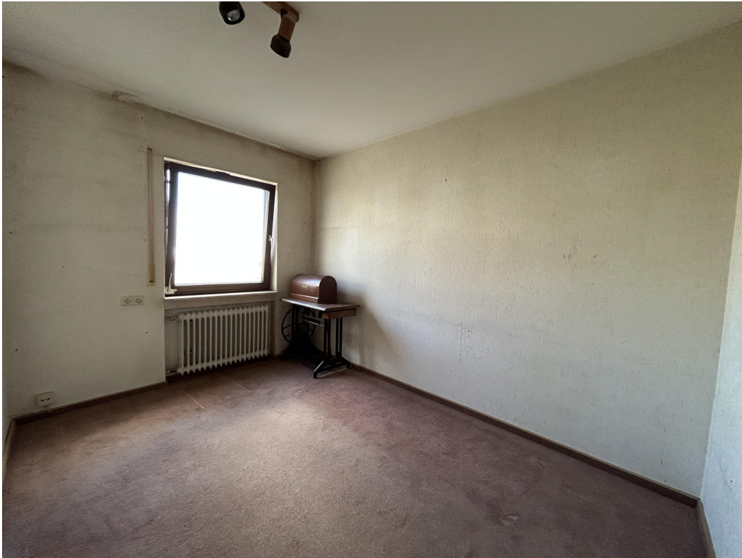
EG - Kinderzimmer 1