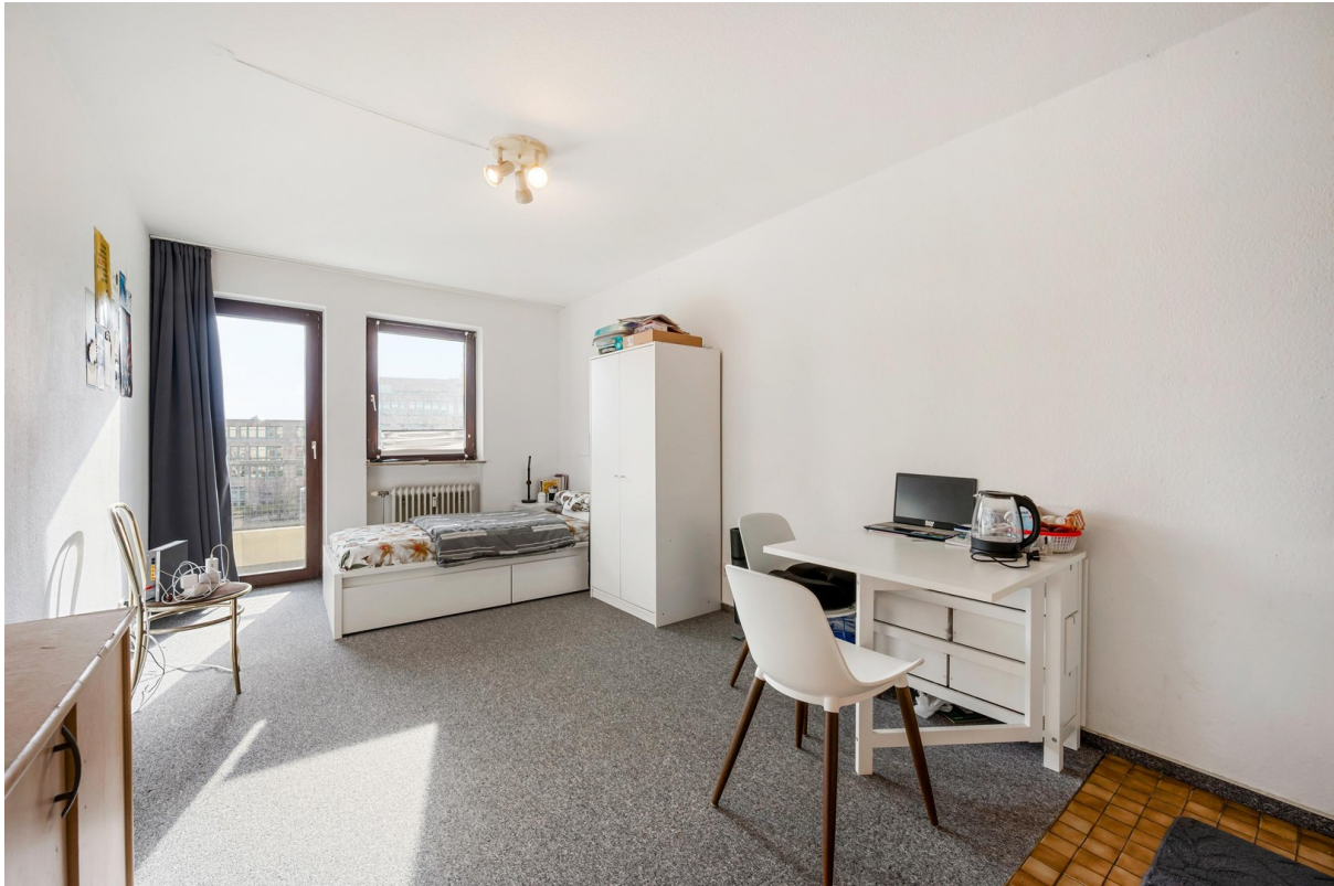
Ausreichend Platz für 1 Person