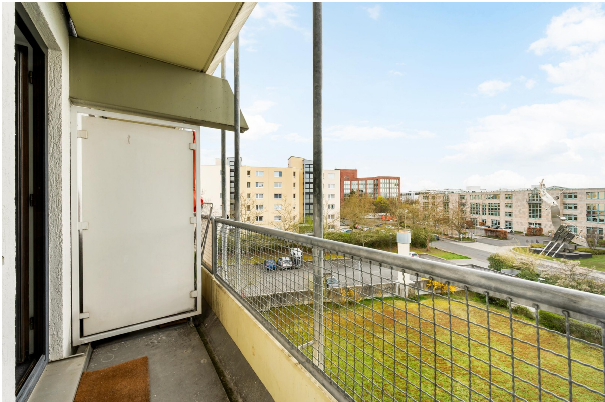
Blick nach Draußen