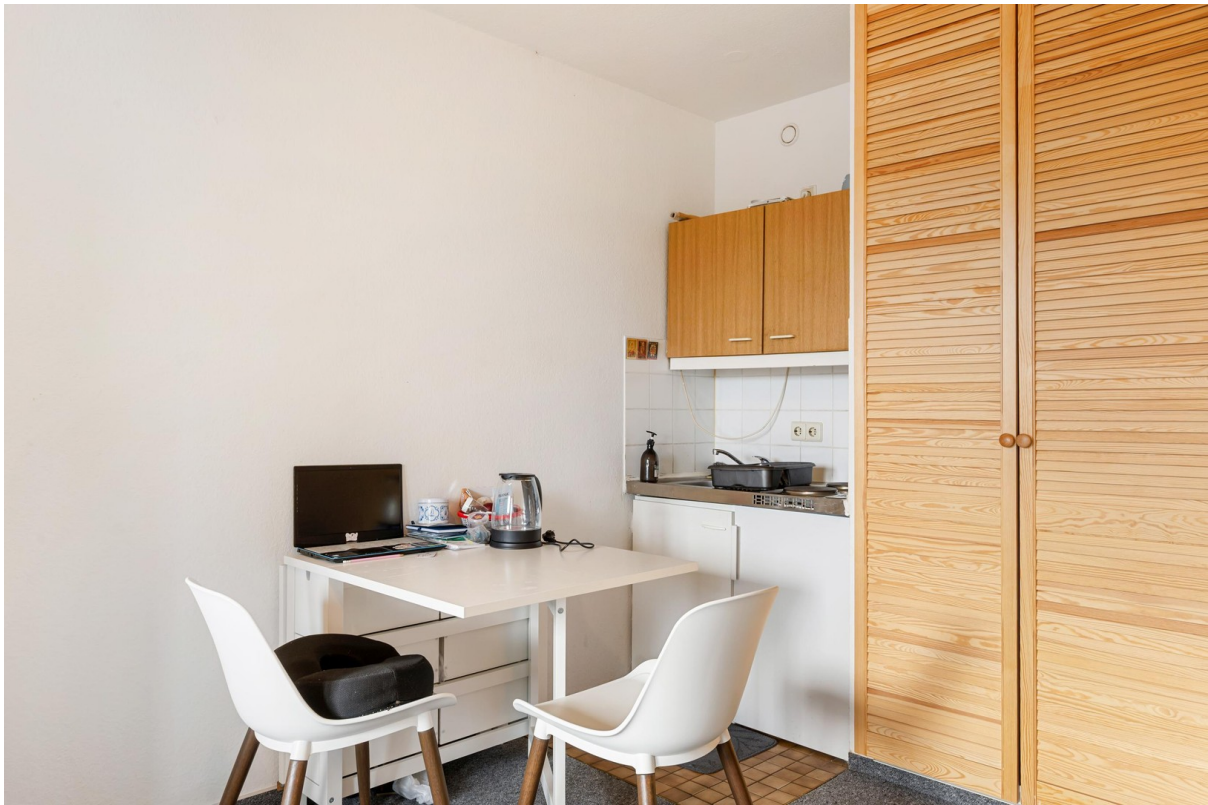
kleine Küche und Schrank