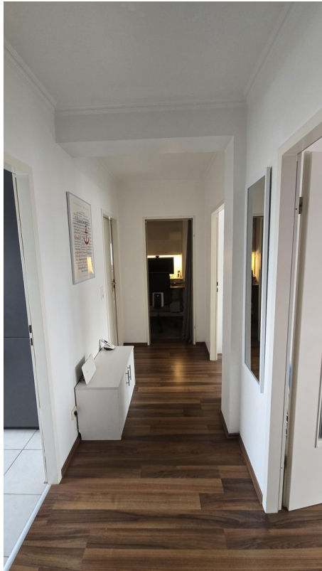
Flur vom Eingang