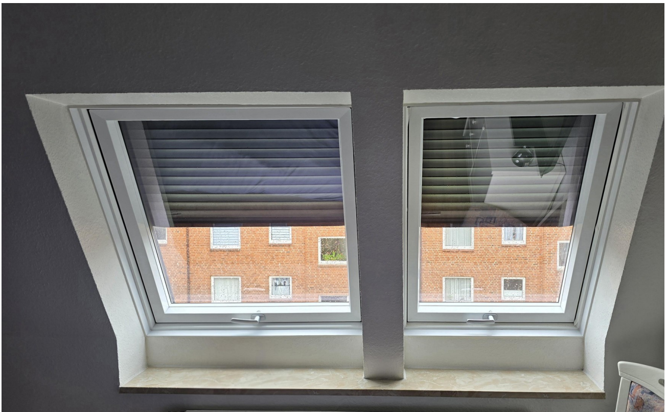
Fenster mit Außenrolläden