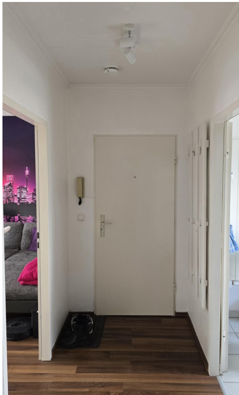
Flur mit Sicht zum Ausgang