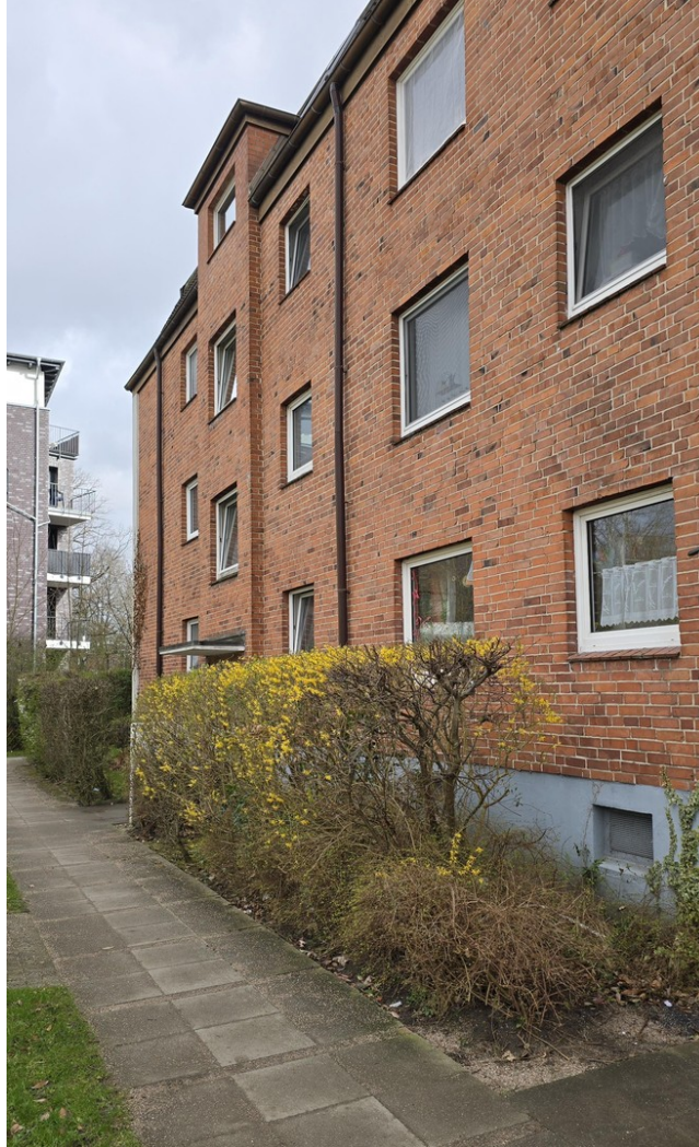
Hausansicht Weg zur Wohnung