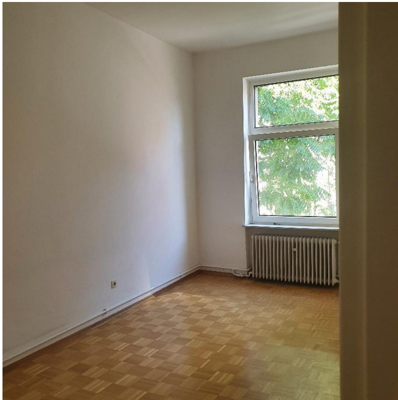
Schlafzimmer - leer