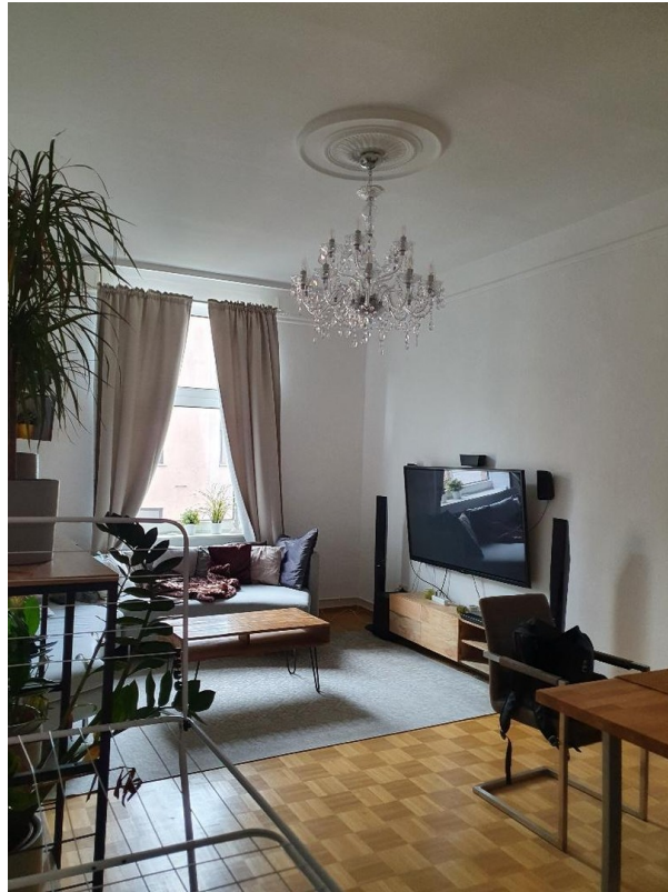
Wohnzimmer - möbliert