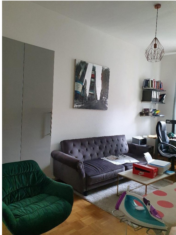
Büro/Schlafzimmer - möbliert