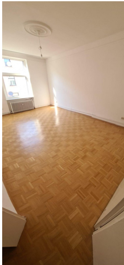
Wohnzimmer - leer