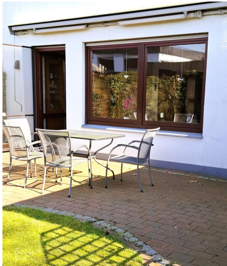
02) Große Terrasse