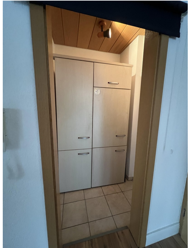
Abstellkammer mit Schrank