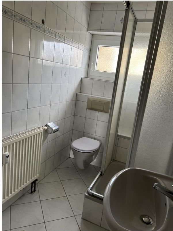
Tageslichtbad mit WC