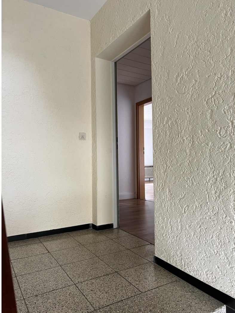
Eingang zur Wohnung