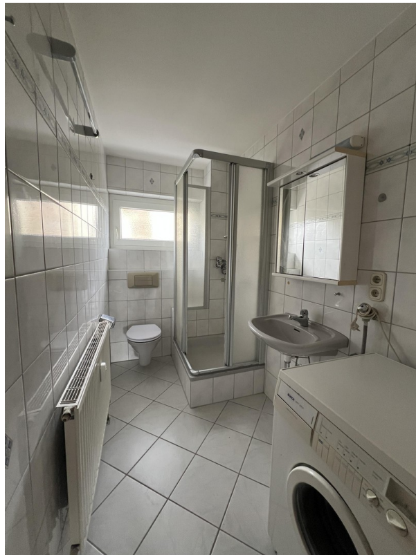
Tageslichtbad mit WC