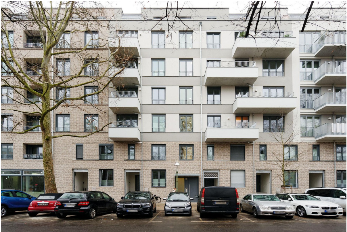
Neubau 2016 Fassade