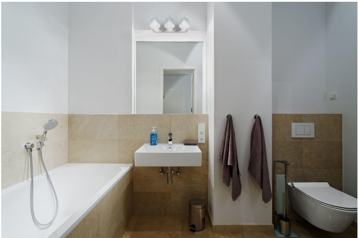
Hauptbad mit Badewanne