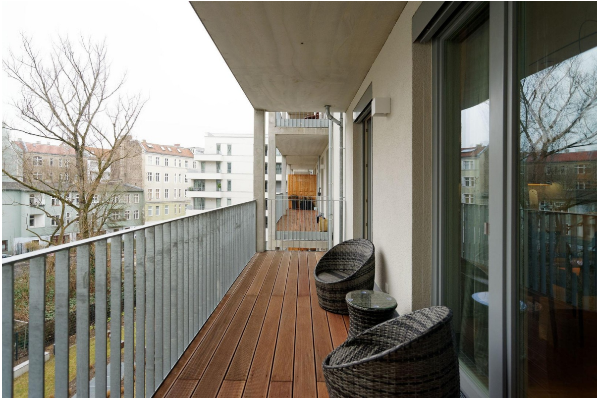
Südterrasse Fenster raumhoch