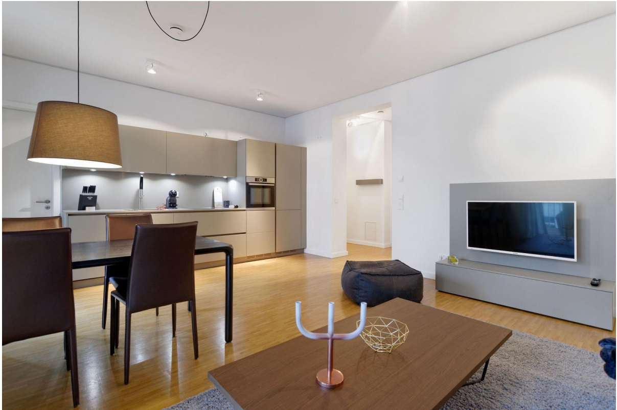
Offene Wohnküche vom Eingang