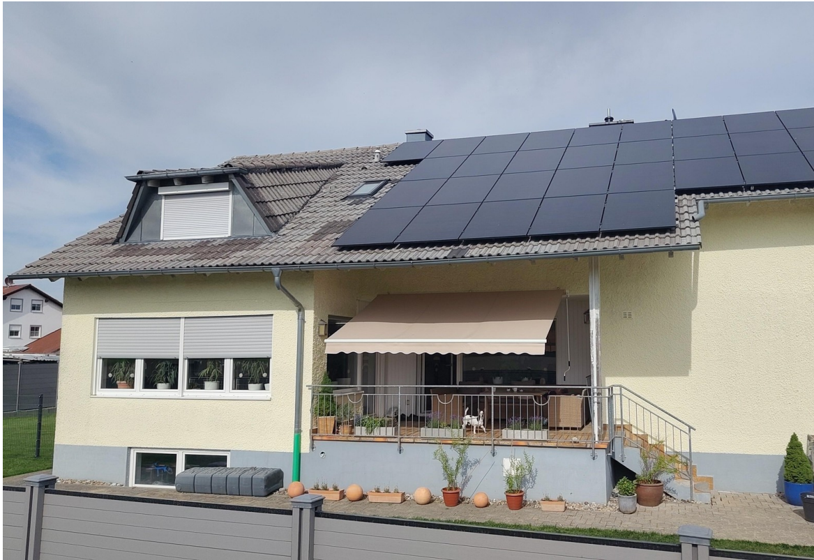
Seitenansicht PV Anlage