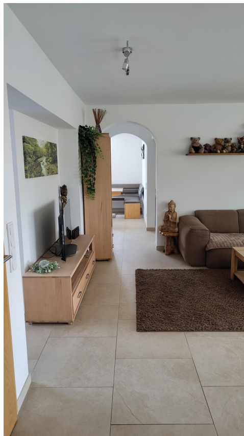
Durchgang z. Küche