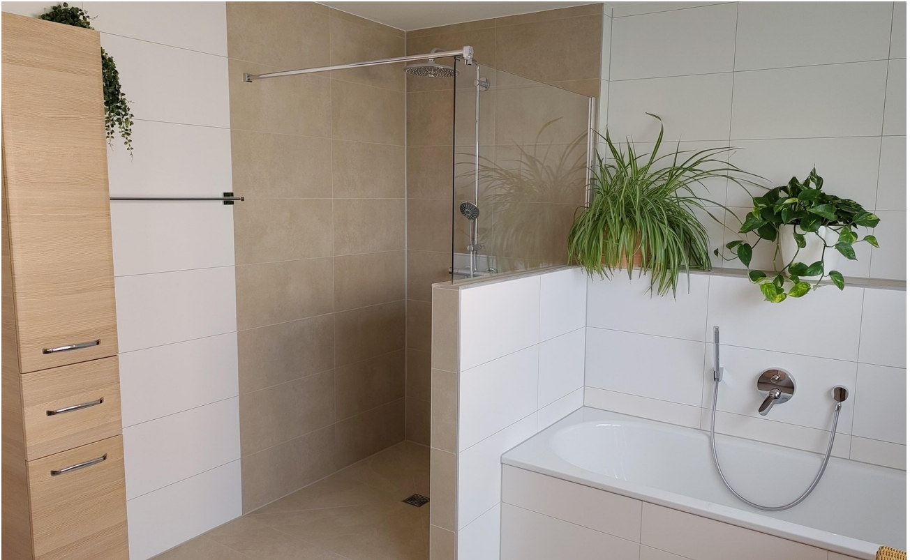
Bad Erdgeschoss , große Dusche