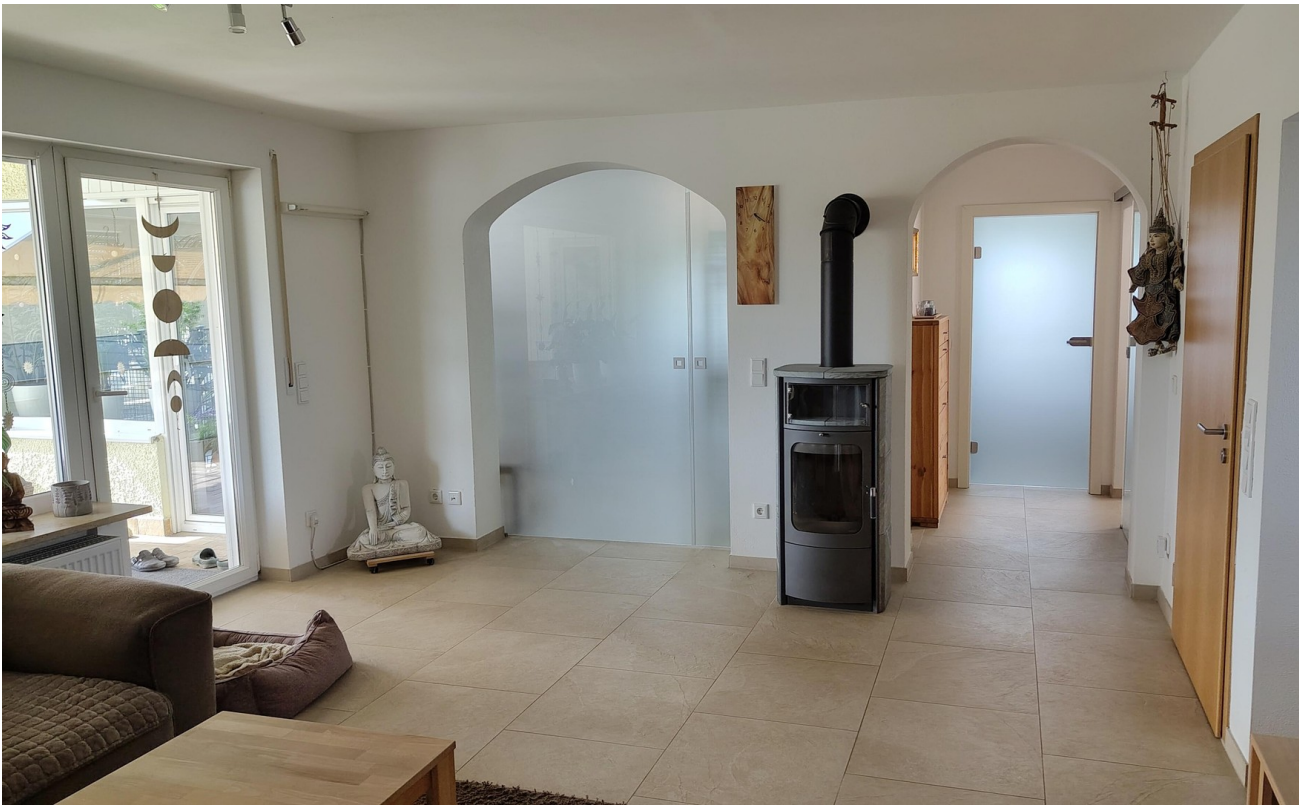
Wohnzimmer Durchgang Wohnz2.2