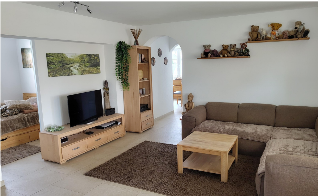
Wohnzimmer Durchgang Küche