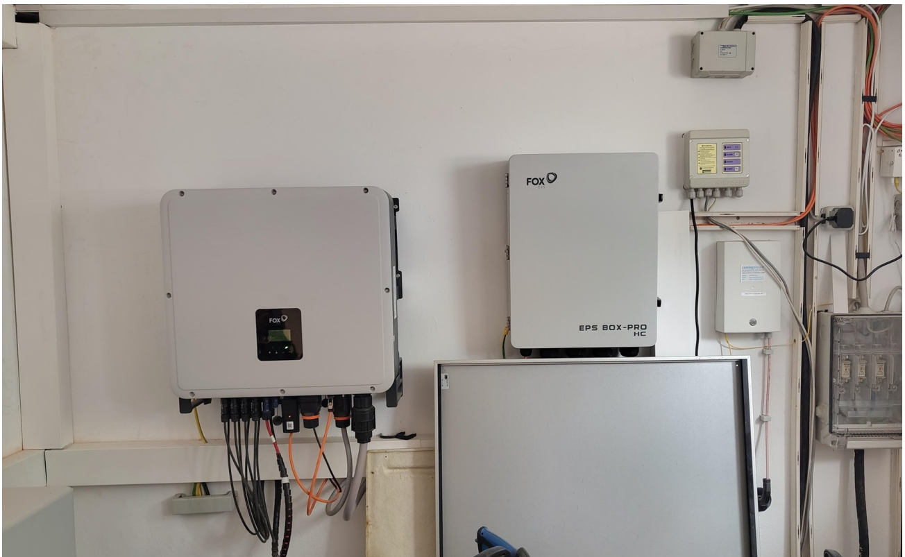
Keller Anschluss PV Anlage