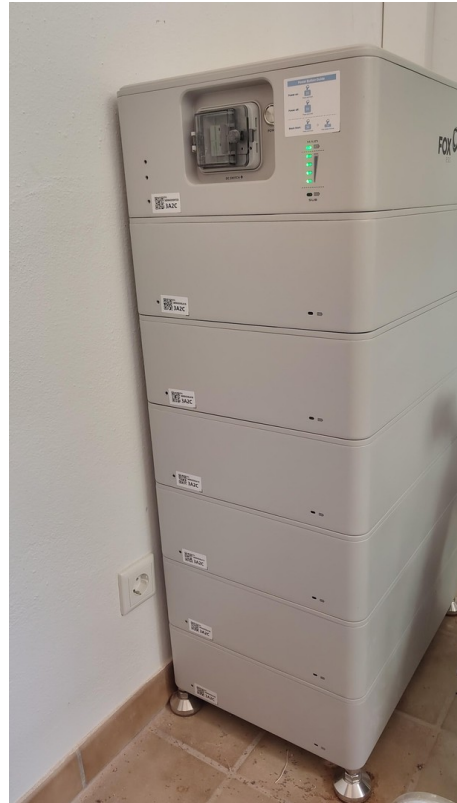
Speicher PV Anlage