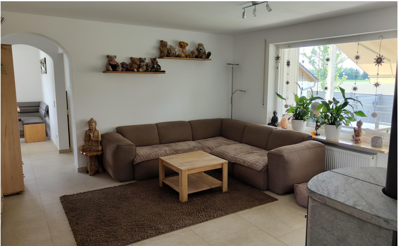
Wohnzimmer Erdg. mit Fernsicht