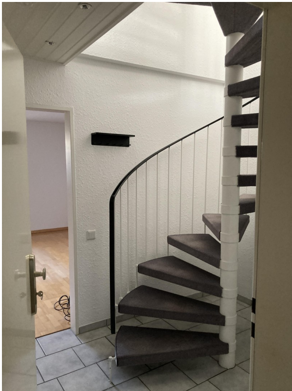
Treppe in der Wohnung