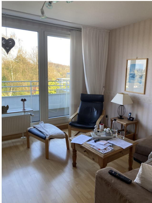
Raum mit Ausblick 2. OG