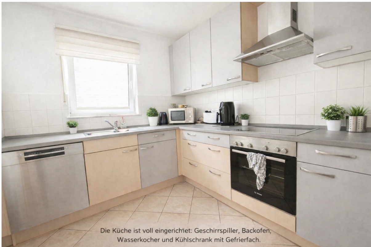
Die Küche ist voll eingerichtet: Geschirrspiller, Backofen, Wasserkocher und Kühlschrank mit Gefrierfach.