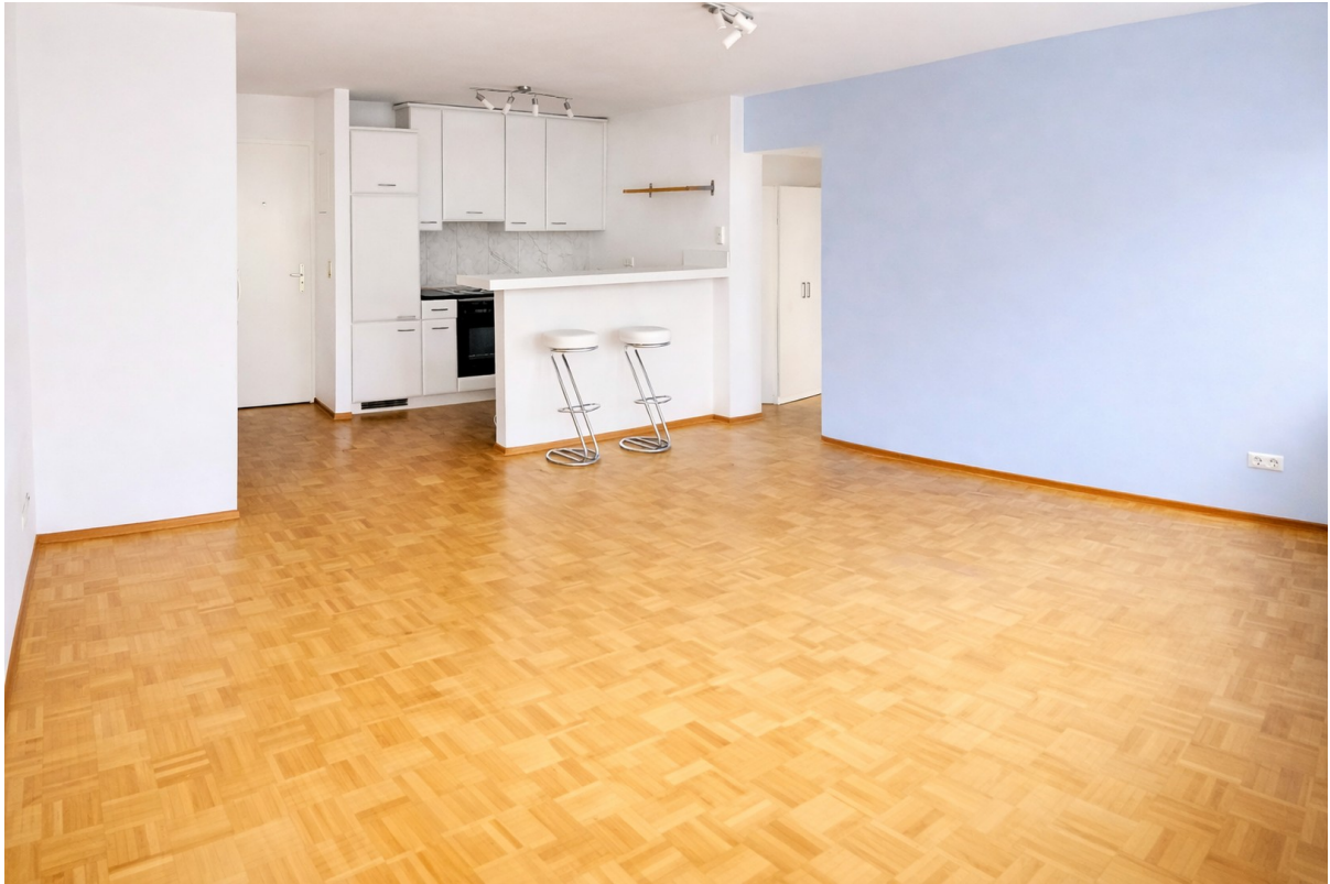
Wohnzimmer Beispiel KücheWeiß