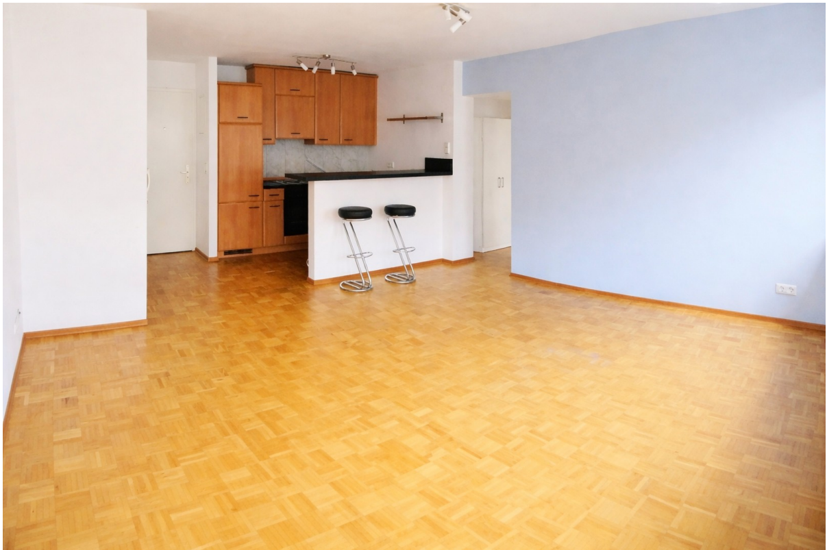
Wohnzimmer mit offener Küche