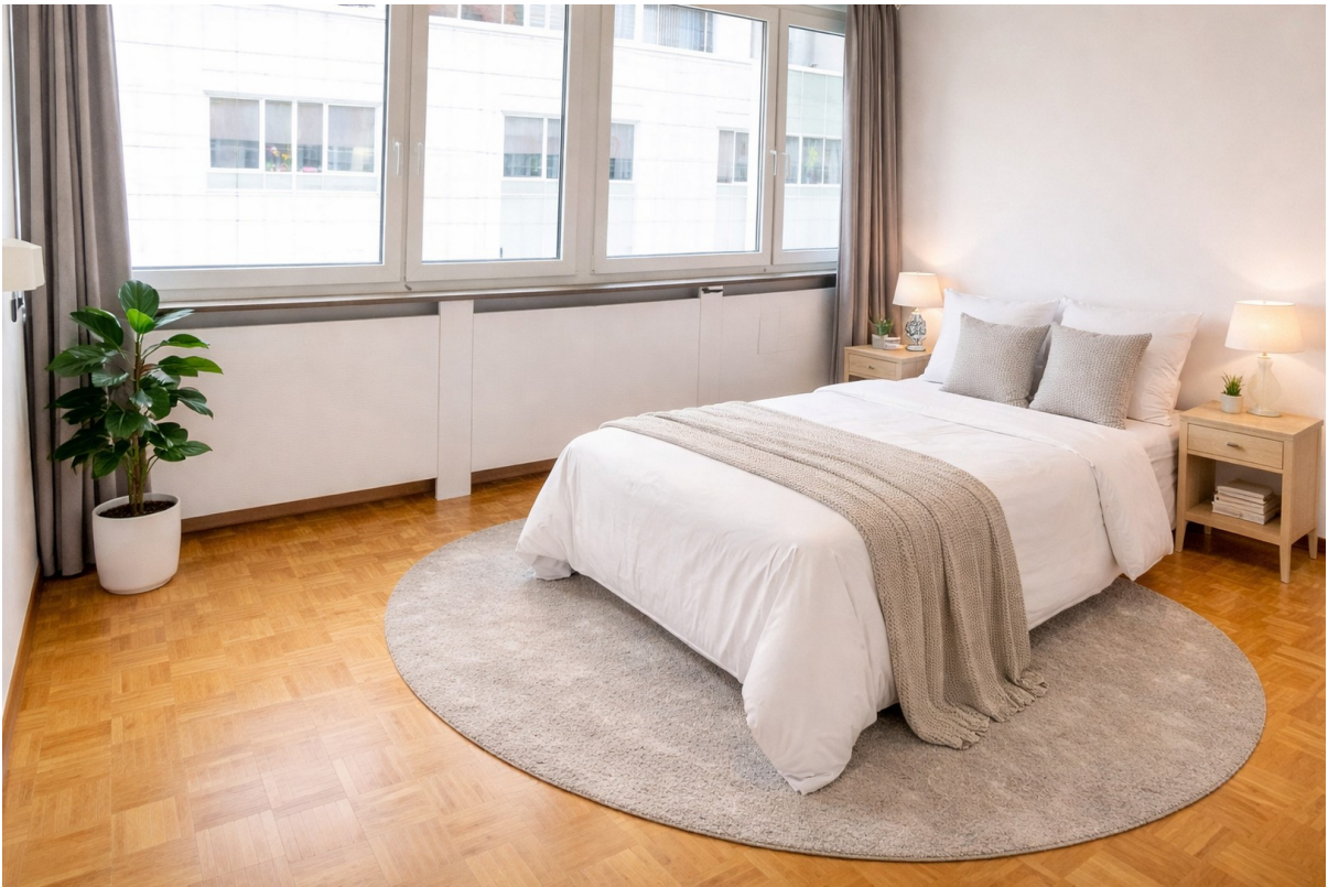
Schlafrum Einrichtung Beispiel