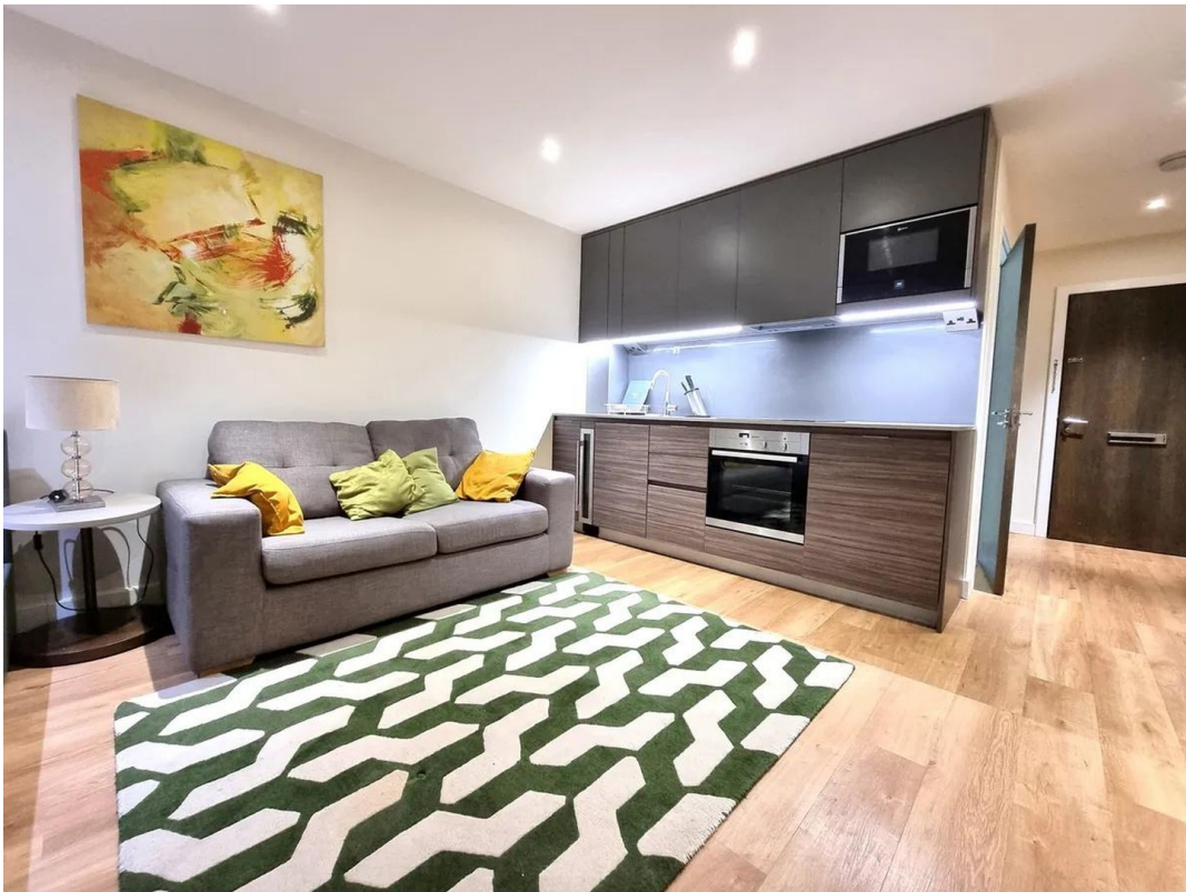
Wohn- und Küchenbereich