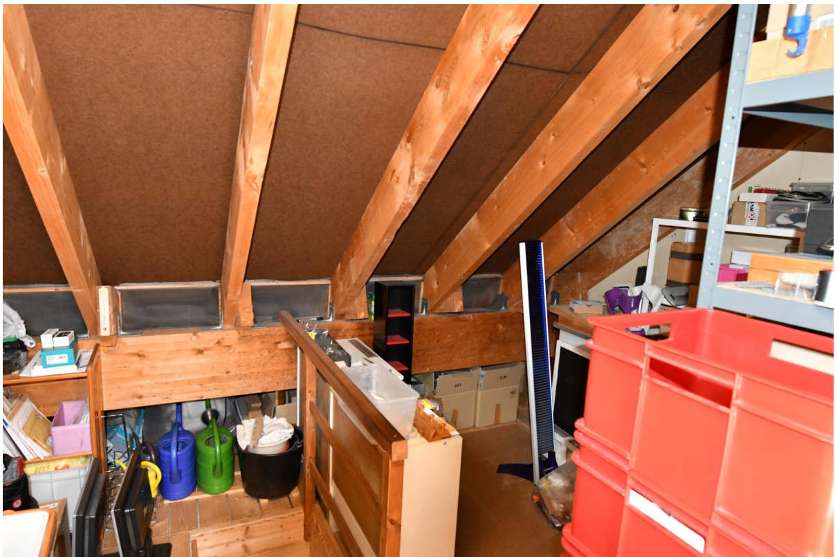
Dachboden Bild 3