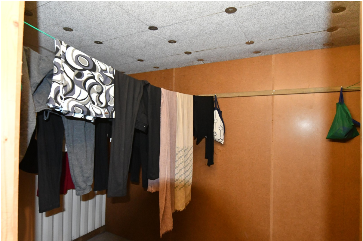
Wäschetrockenraum Bild 2