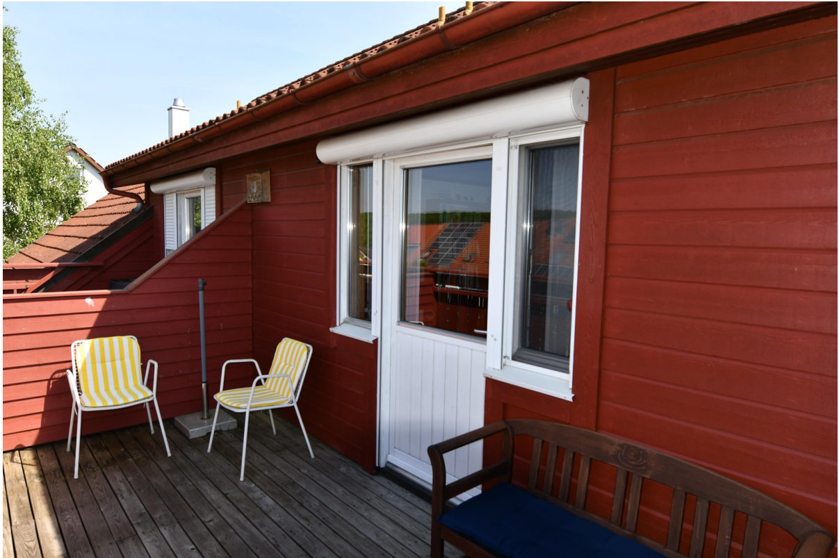
Terrasse oben Bild 2