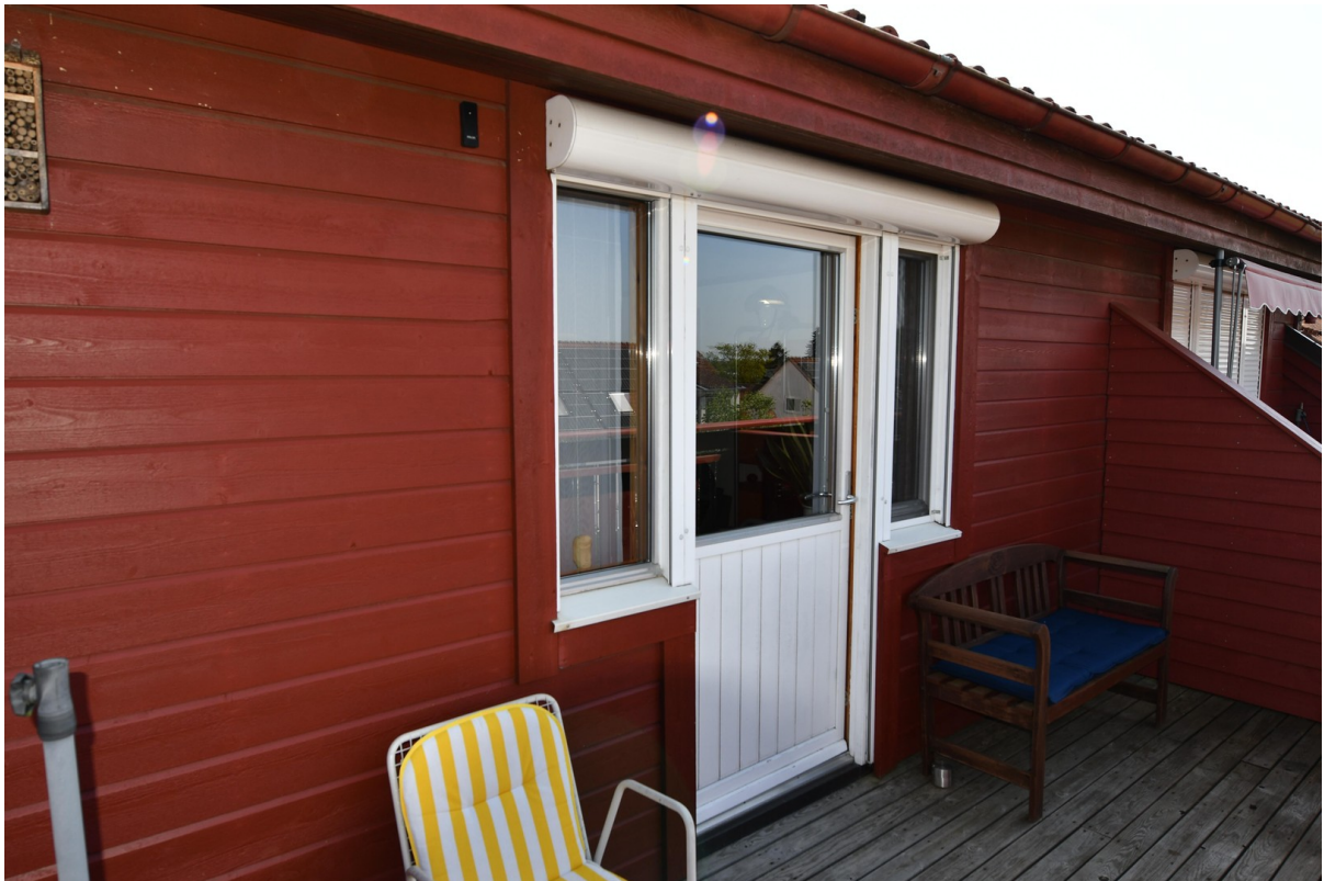
Terrasse oben Bild 1