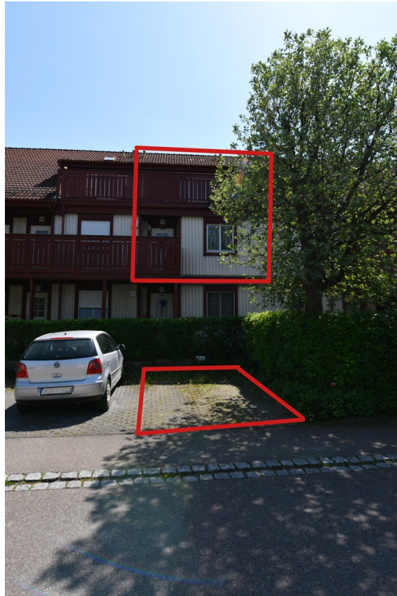
Außenseite Nord mit Stellplatz