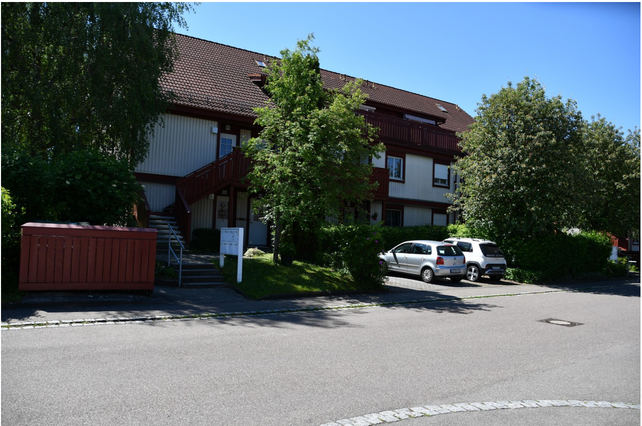
Gesamtansicht Haus von Norden