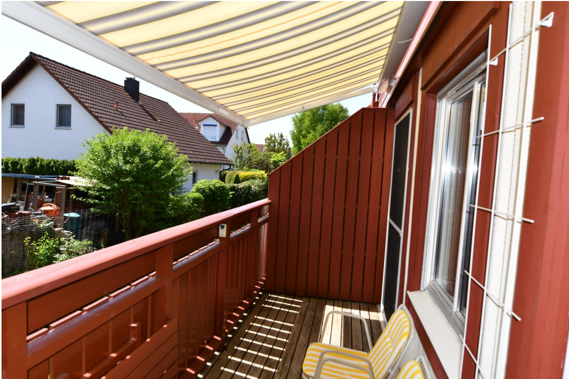
Südbalkon unten Bild 2