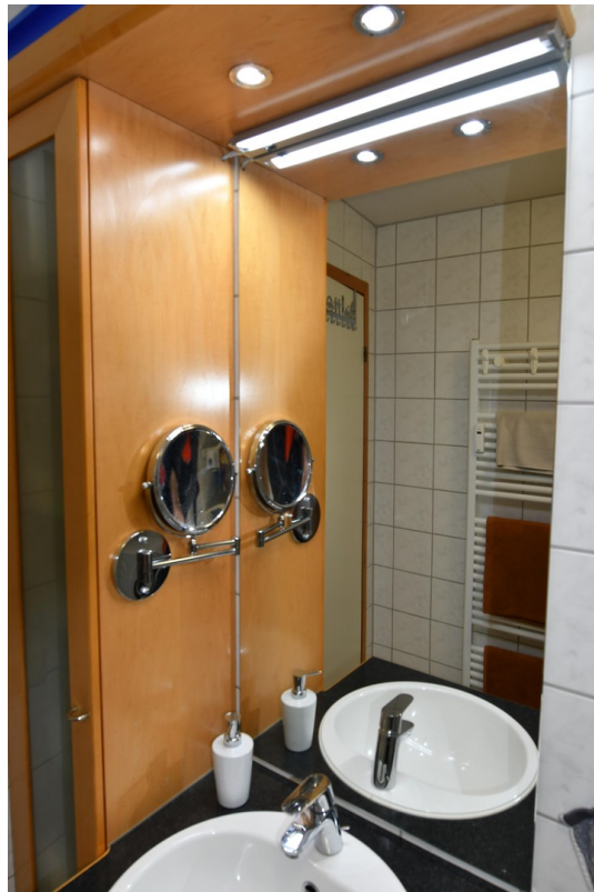
Bad unten Bild 4