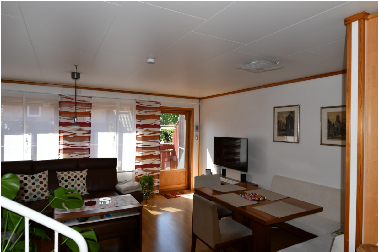
Wohn- und Essbereich Bild 2