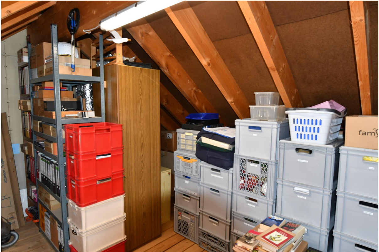
Dachboden Bild 2