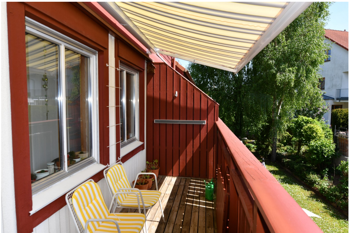
Südbalkon unten Bild 1