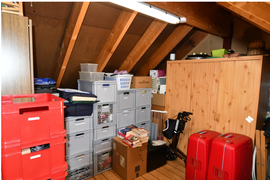
Dachboden Bild 1