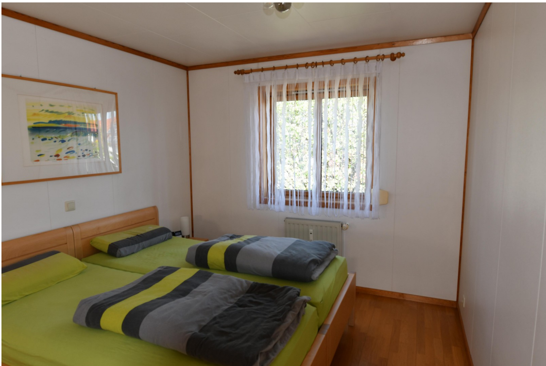
Schlafzimmer Bild 1