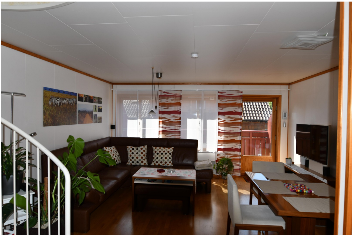
Wohn- und Essbereich Bild 1