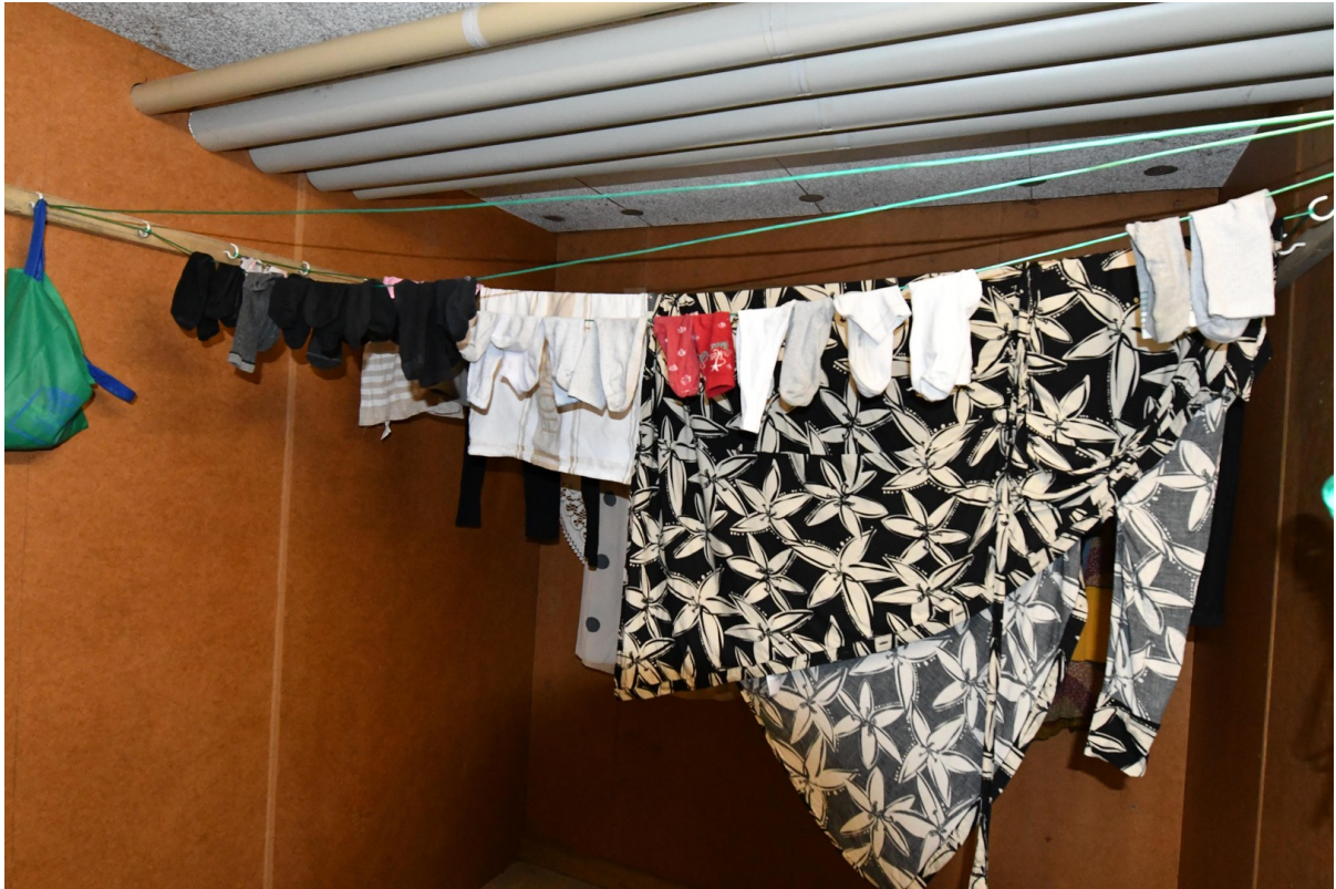
Wäschetrockenraum Bild 1