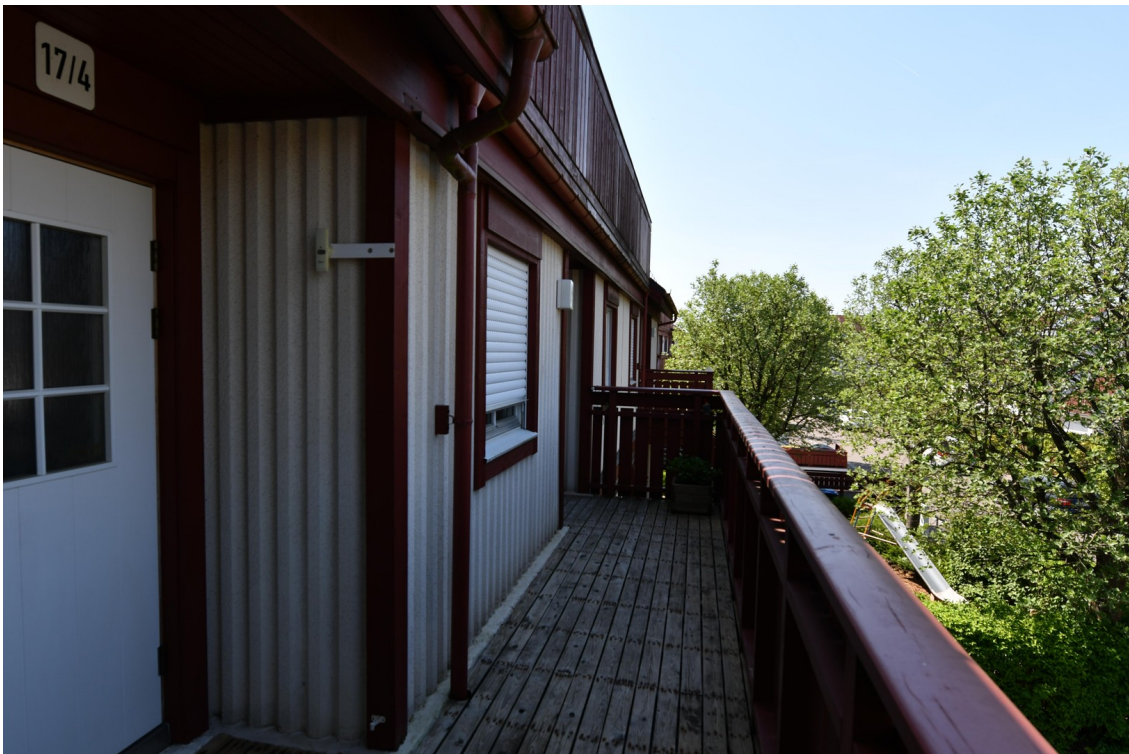
Zugang außen zur Wohnung