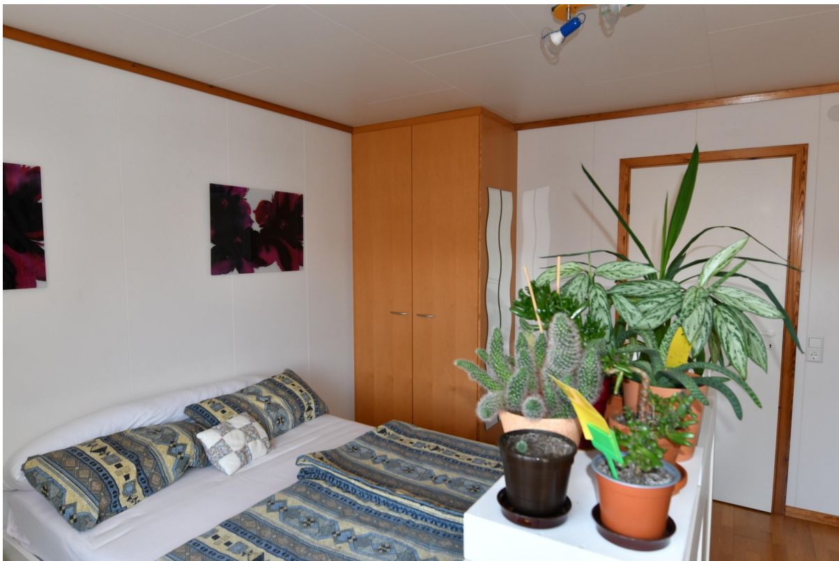
Zimmer oben Süd Bild 2