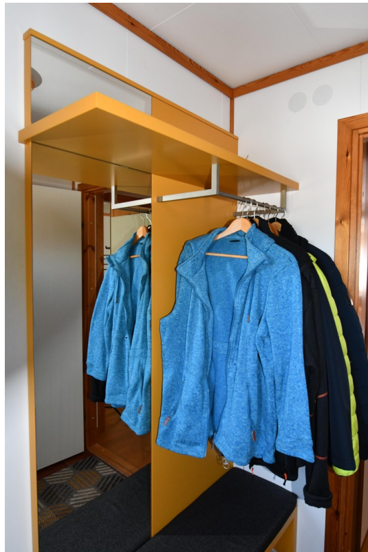
Eingangsbereich Bild 2