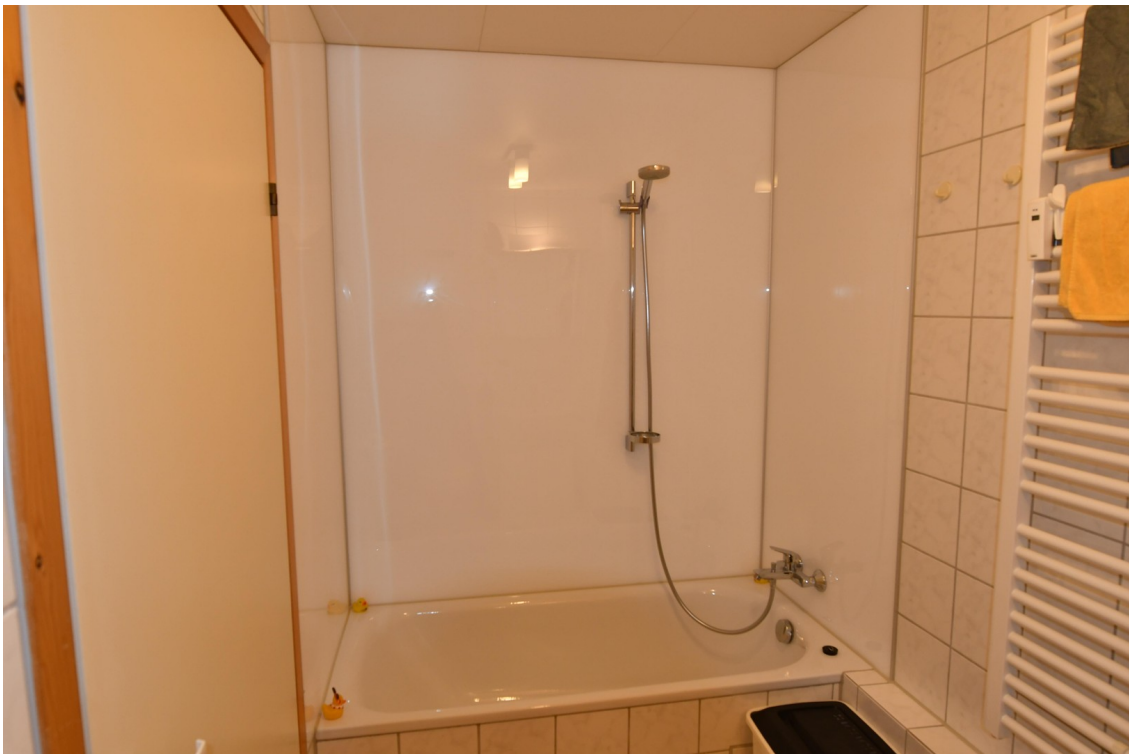
Bad oben Bild 2