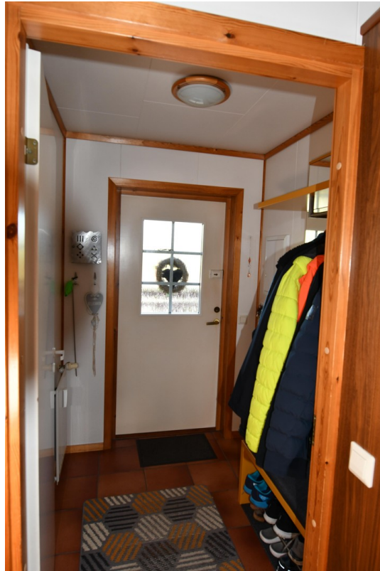
Eingangsbereich Bild 1