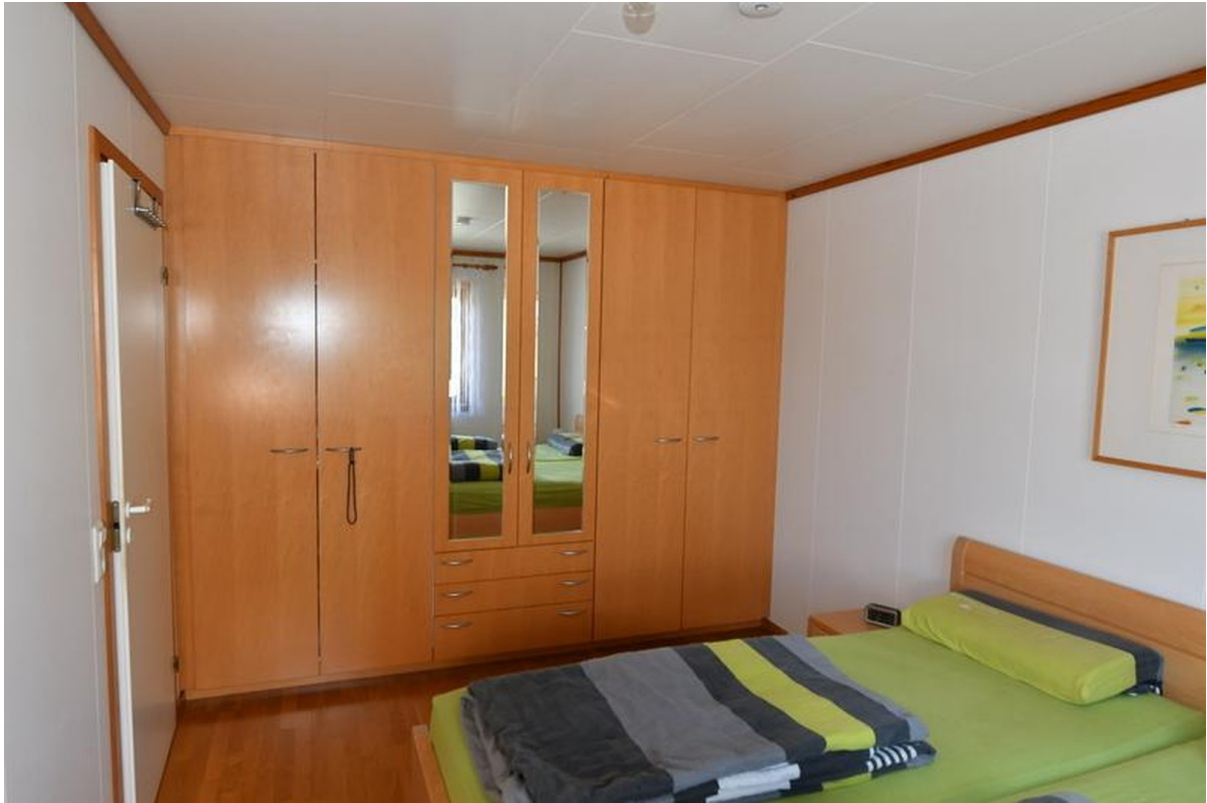
Schlafzimmer unten Bild 2