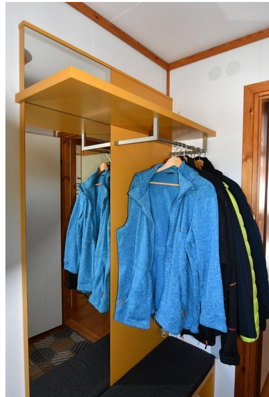
Eingangsbereich Bild 2