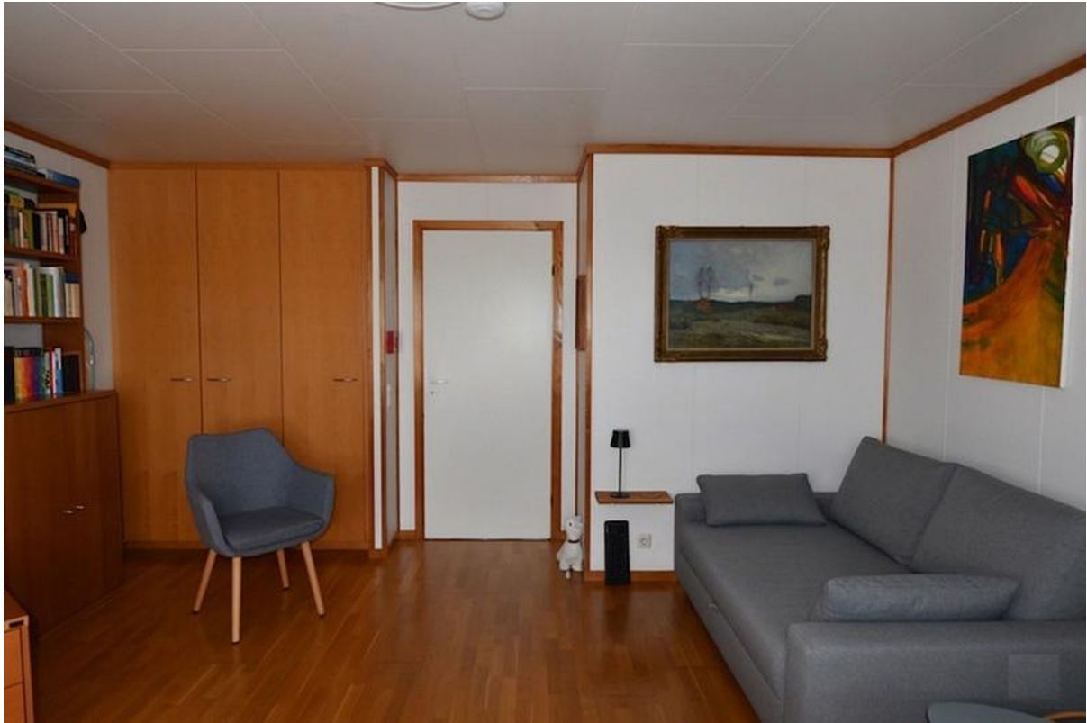
Zimmer Nord oben Bild 2