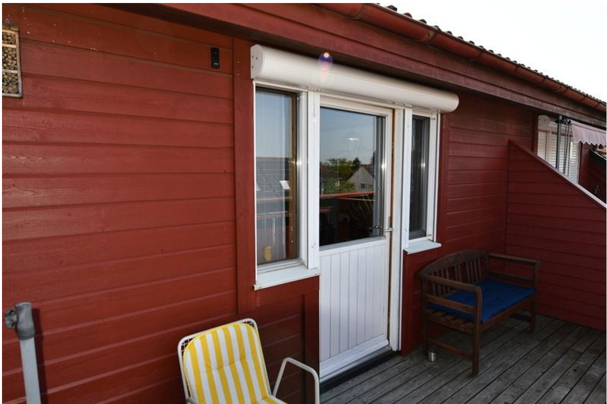
Terrasse oben Bild 1