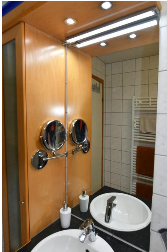
Bad unten Bild 4