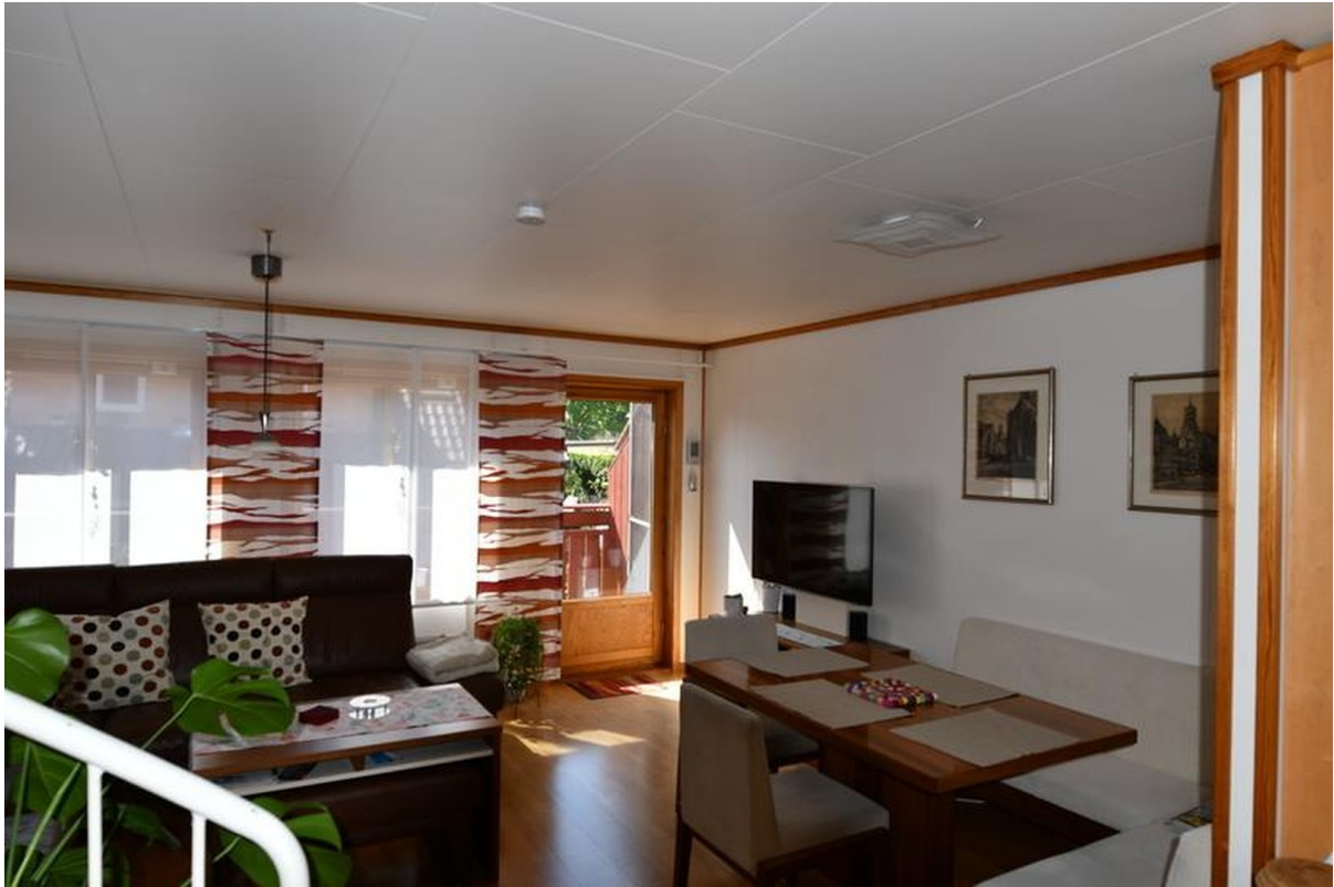
Wohn-Esszimmer unten Bild 2