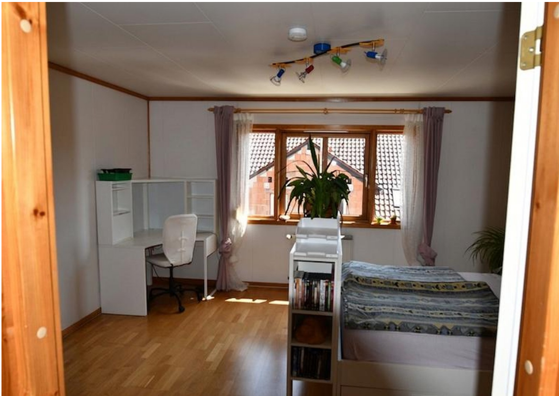
Zimmer Süd oben Bild 1