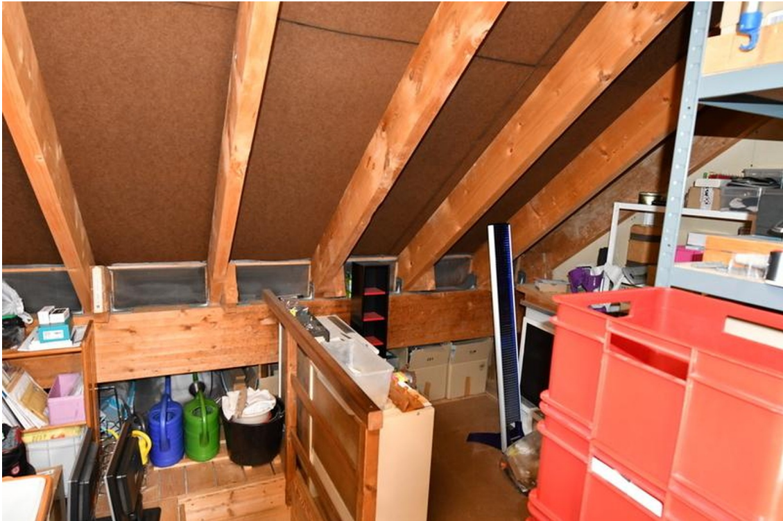
Dachboden Bild 3