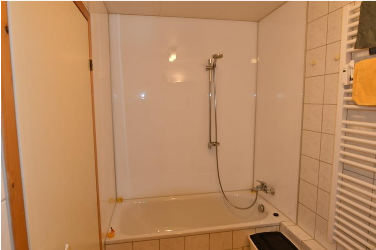
Bad oben Bild 2