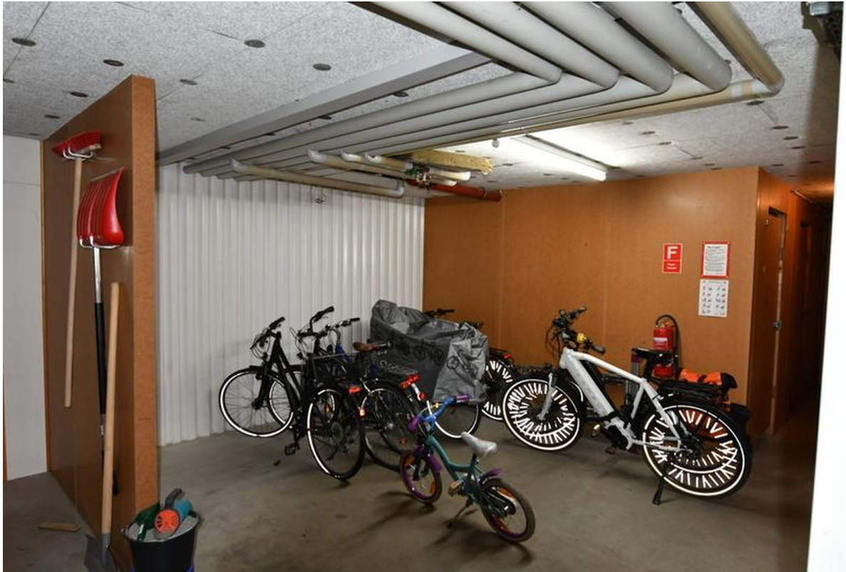
Gemeinschaftseigentum Bild 1