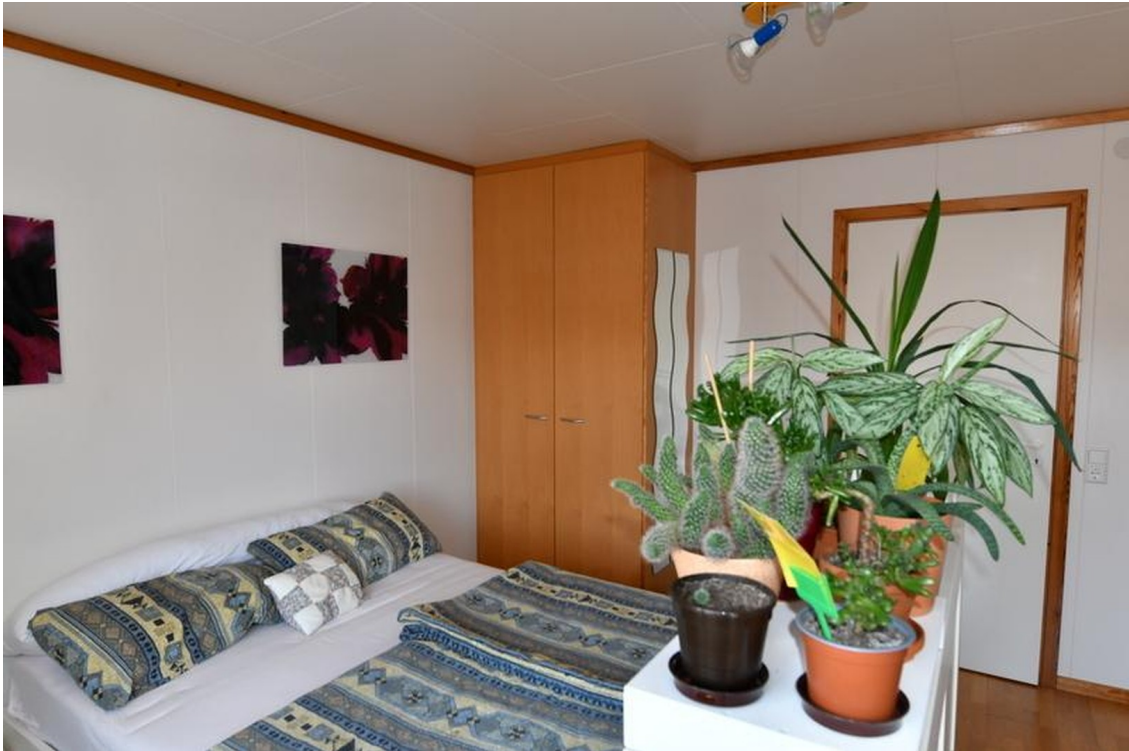
Zimmer Süd oben Bild 2