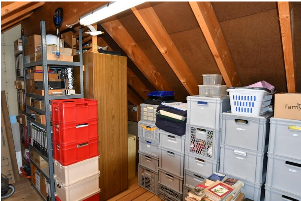
Dachboden Bild 2