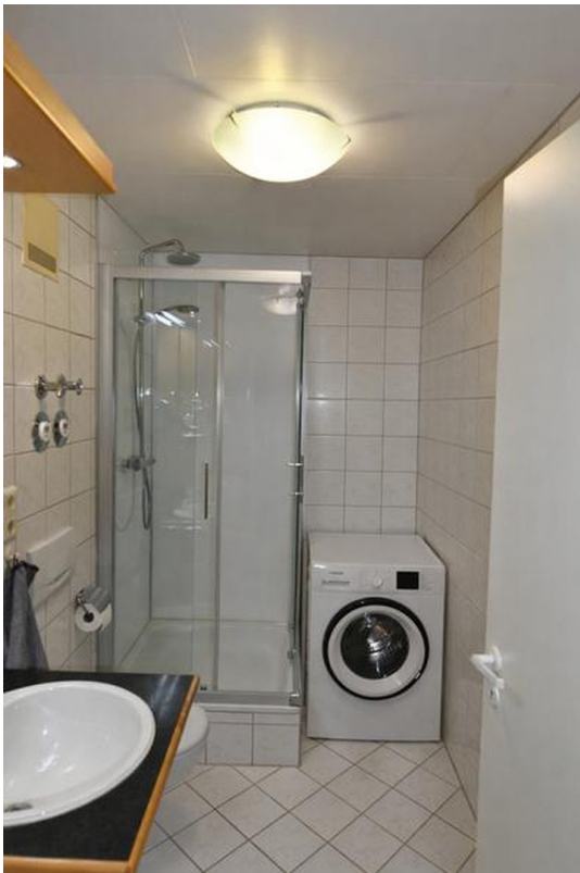
Bad unten Bild 1