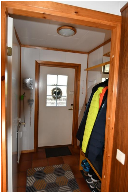
Eingangsbereich Bild 1