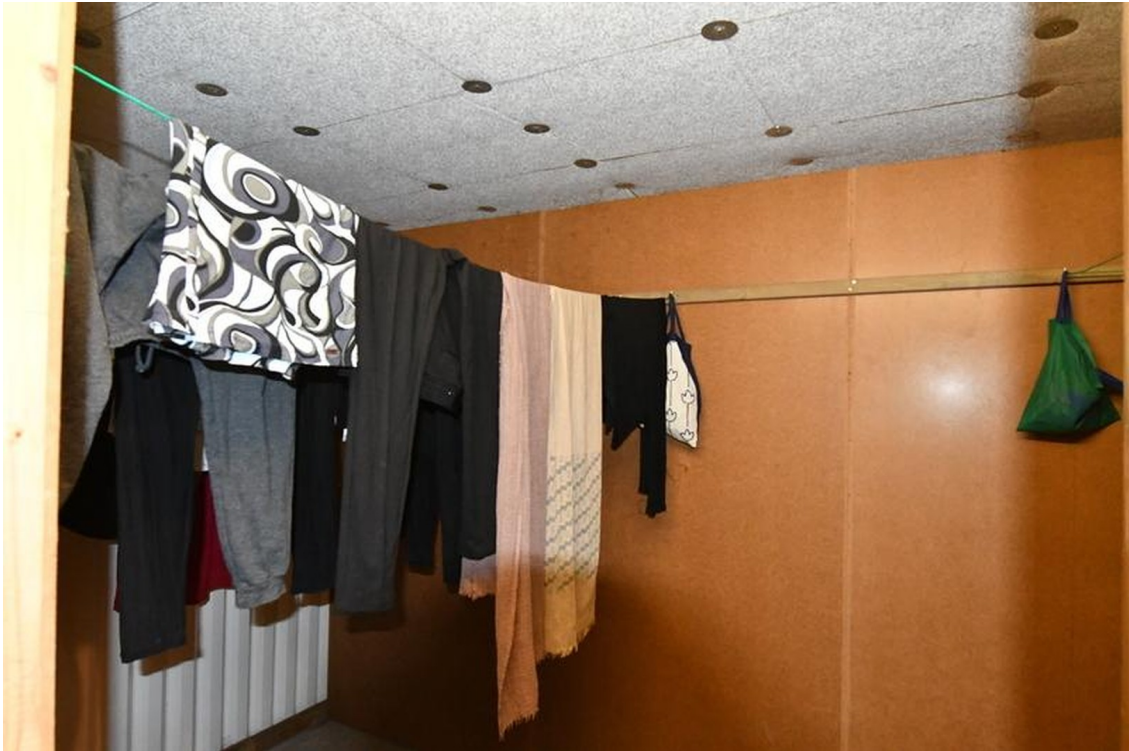
Gemeinschaftseigentum Bild 3