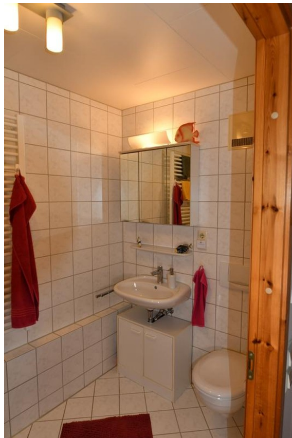
Bad oben Bild 1