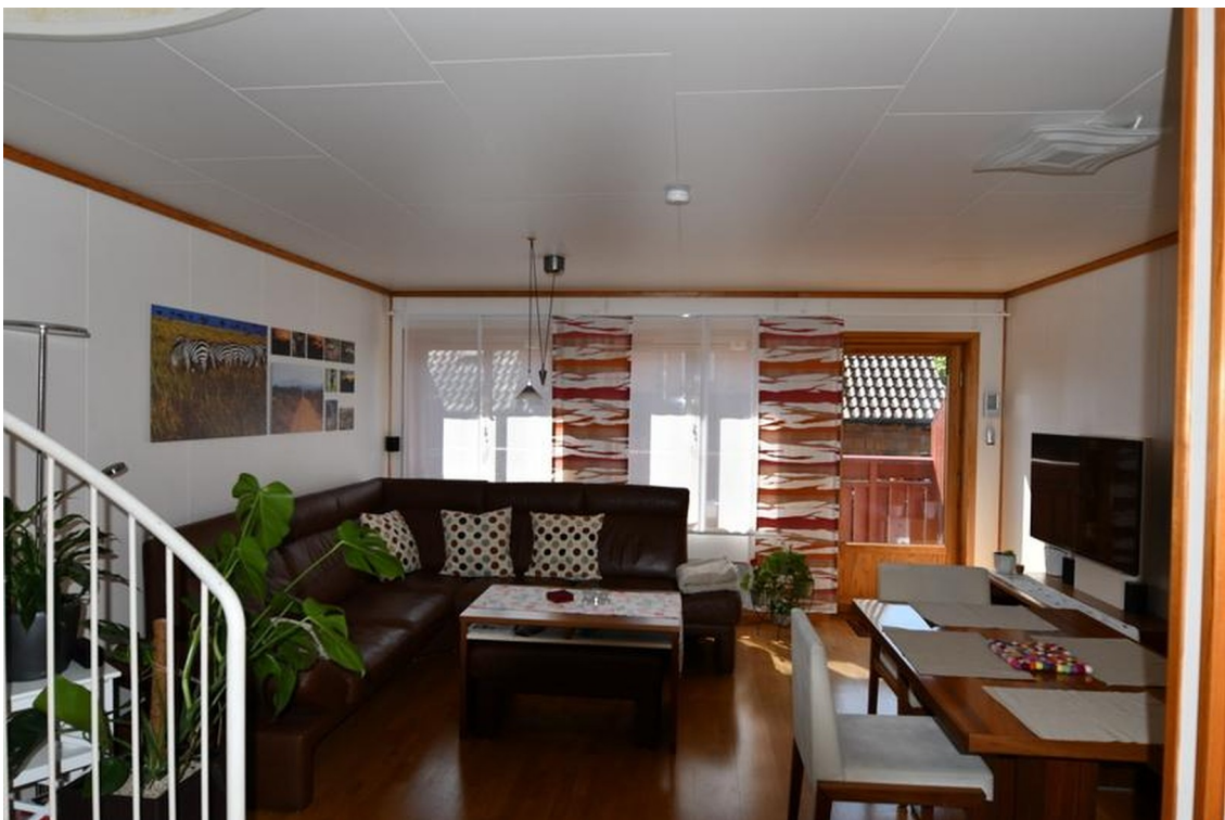
Wohn-Esszimmer unten Bild 1