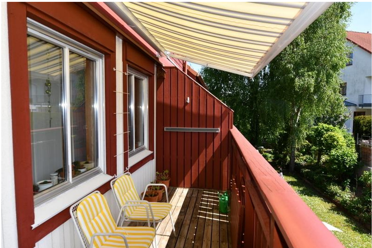
Balkon unten Bild 1