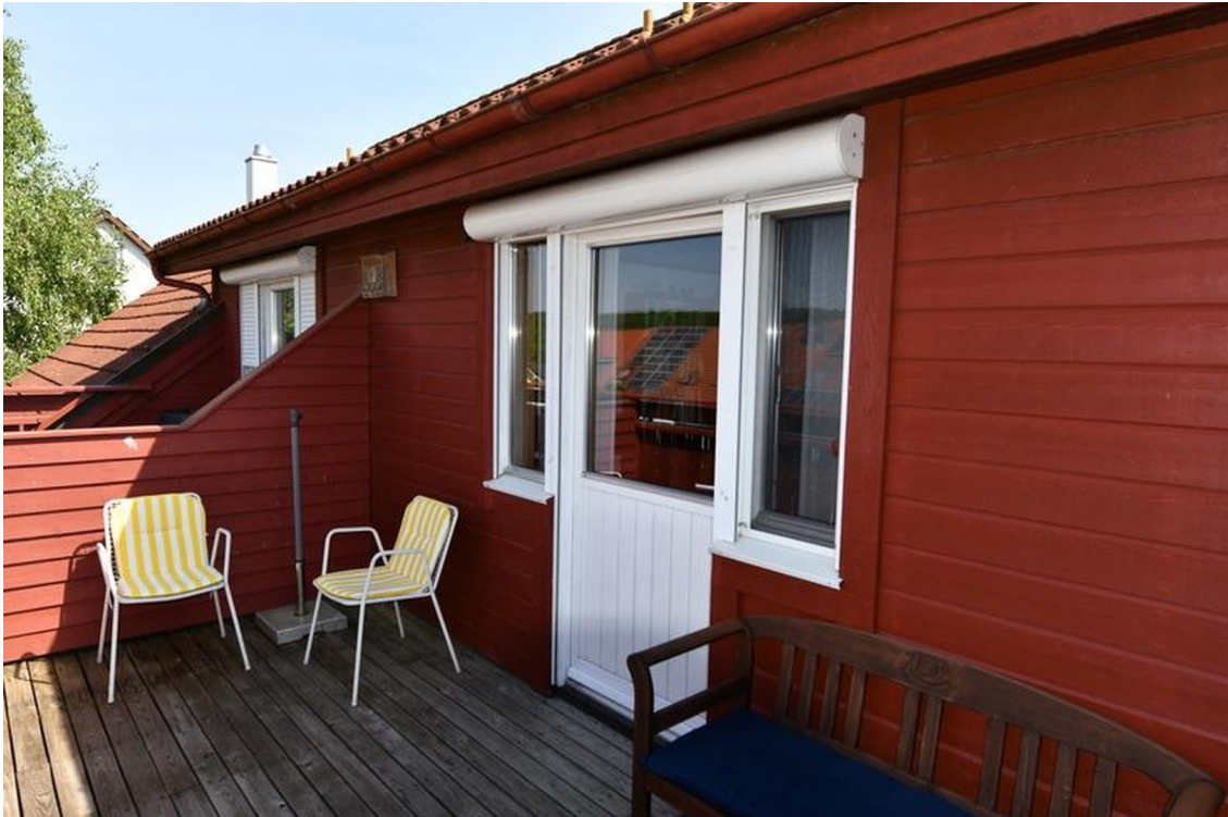
Terrasse oben Bild 2