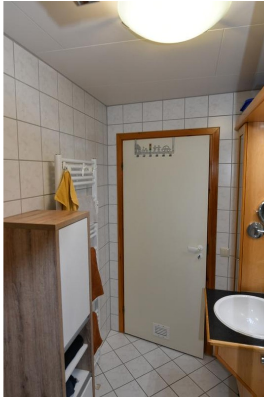
Bad unten Bild 3