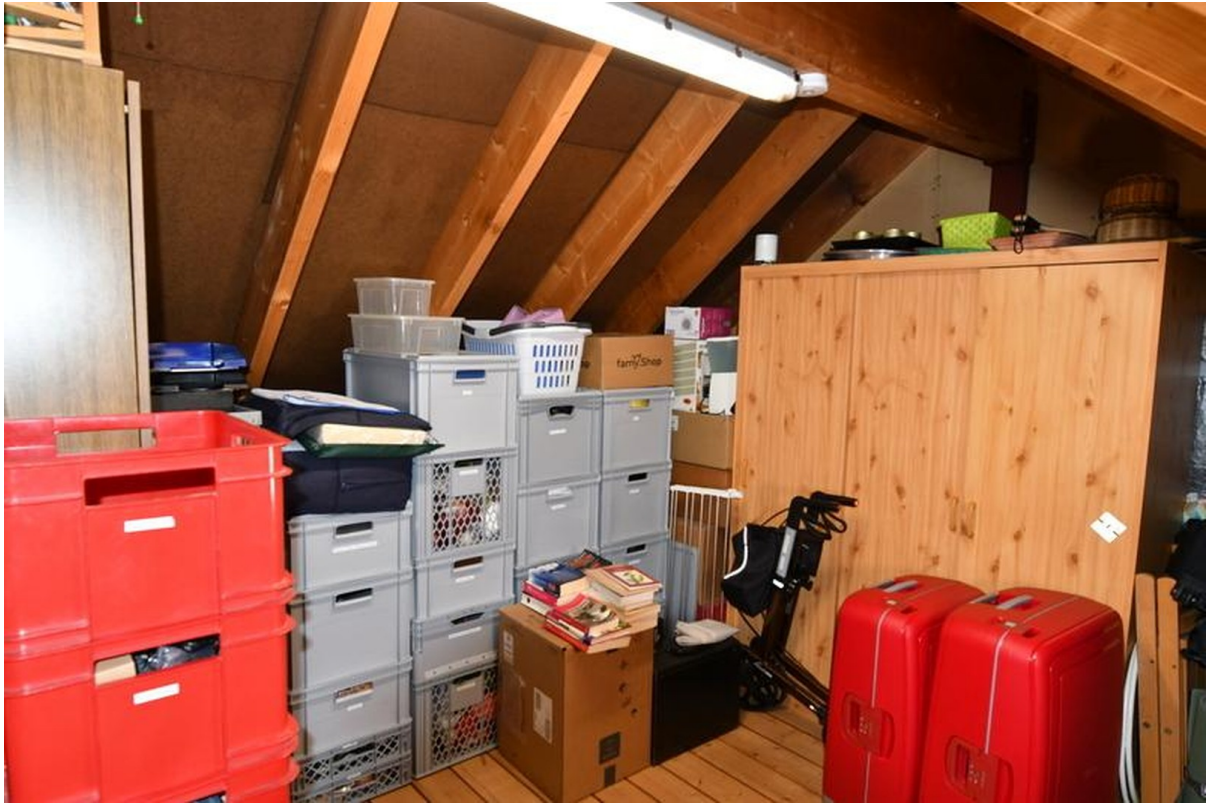
Dachboden Bild 1