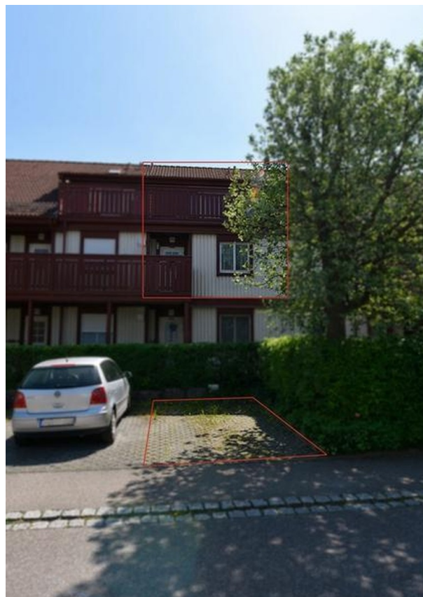
Außenseite Nord mit Stellplatz