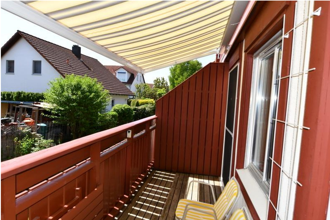
Balkon unten Bild 2