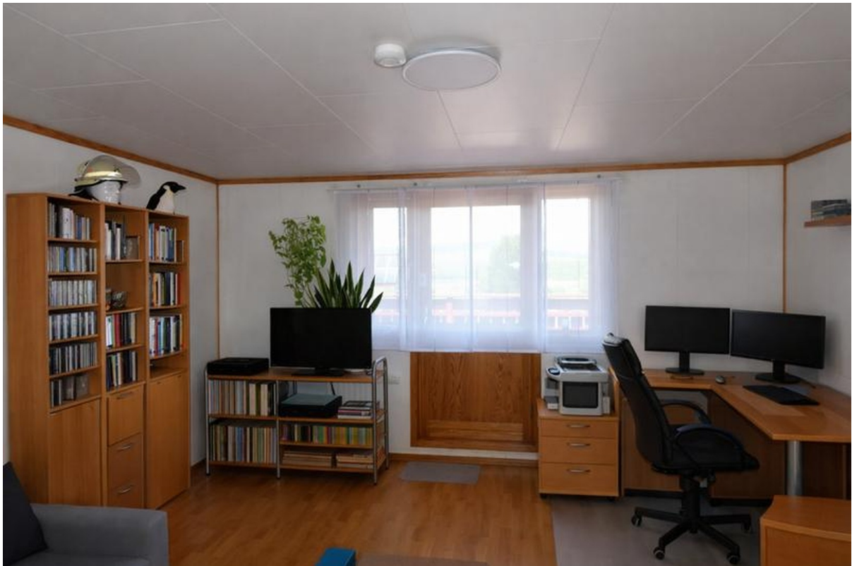
Zimmer Nord oben Bild 1