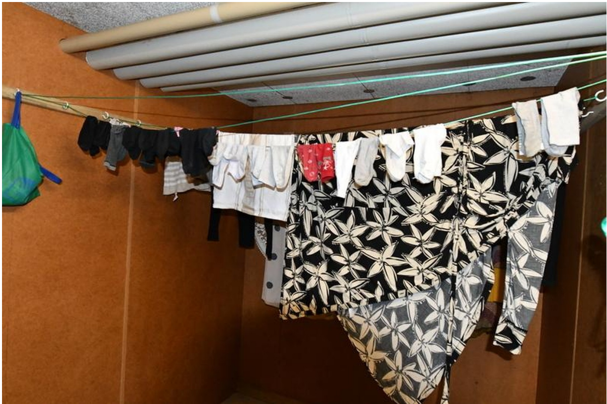
Gemeinschaftseigentum Bild 2