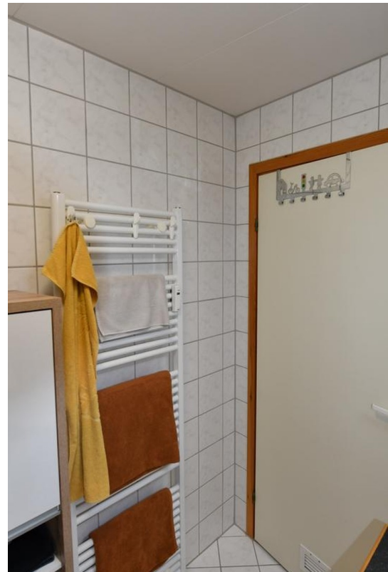
Bad unten Bild 2