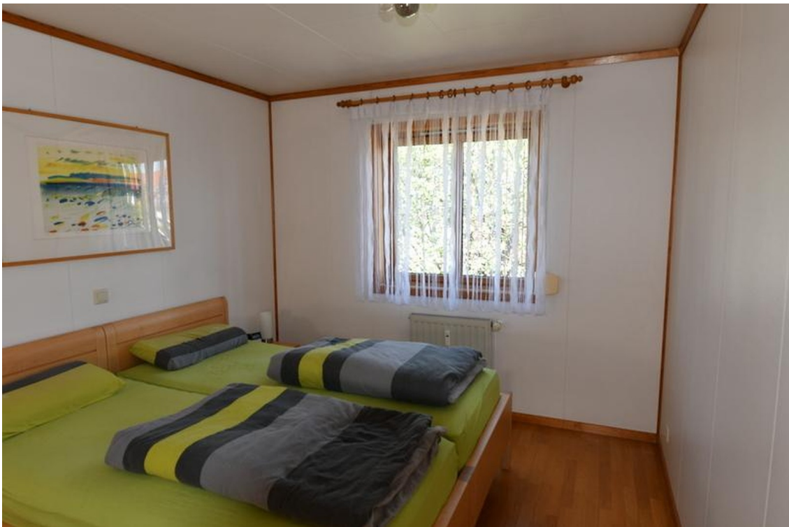
Schlafzimmer unten Bild 1